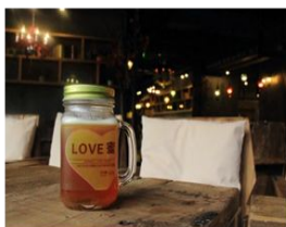
进德生计项目中新生的小羊羔

项目自 2014 年 1 月正式启动，设立了社区发展创新中心，驻点人员到位。截止 2014 年 12 月底，1 个项目已结项，13 个正在结项，