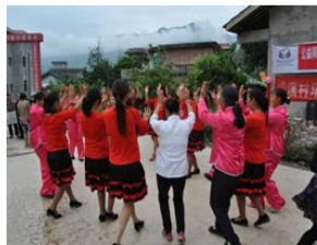
益多支持的横溪村重阳