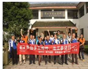
心家返乡工人们在绵阳参观合影