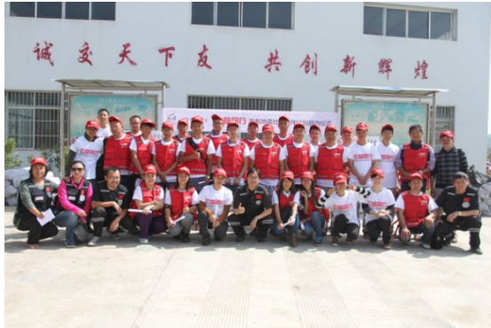
☆ 鲁甸社区陪伴启动仪式 ☆