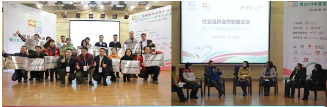
社会组织合作发展论坛暨2014年度项目发布现场