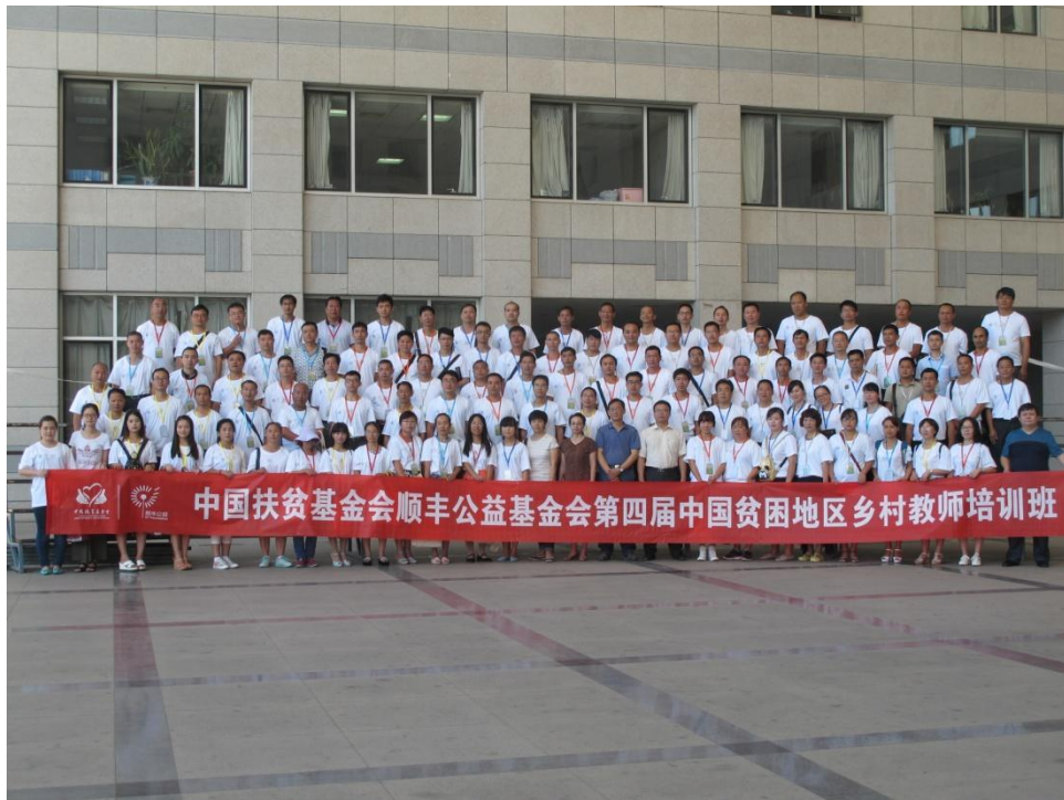
参会人员北京师范大学主楼前集体合影