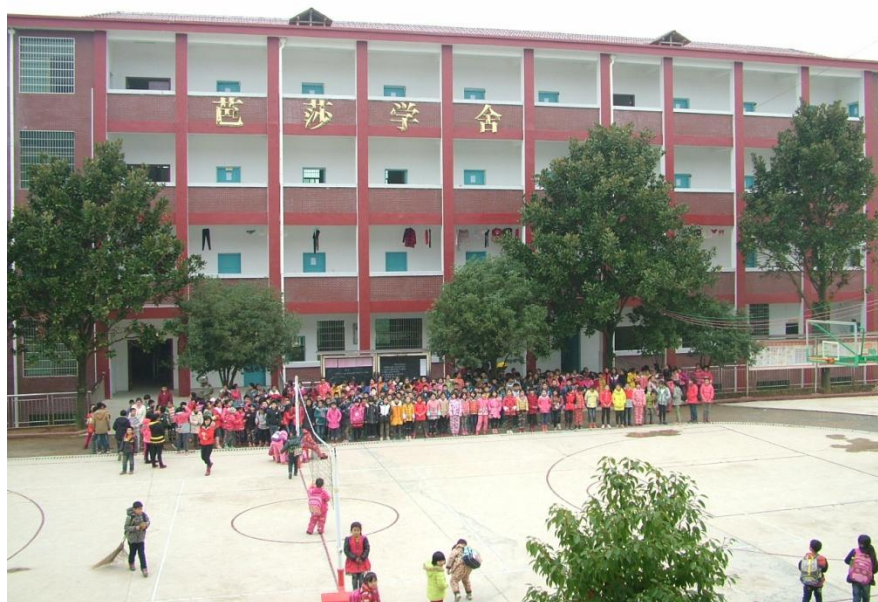
湖南省新化县小洋小学芭莎学舍

筑巢行动项目共 204 所学校，目前 194 所竣工。前 4 期项目中仅有 4 所未竣工，其中 2 所基础，1 所一层，1 所装修。第 5 期 6 所学校于 2015 年 4 月陆续启动，目前 3 所已开工建设，另外 3 所为 11 月新启动项目，目前完成选址考察，尚在前期准备阶段。