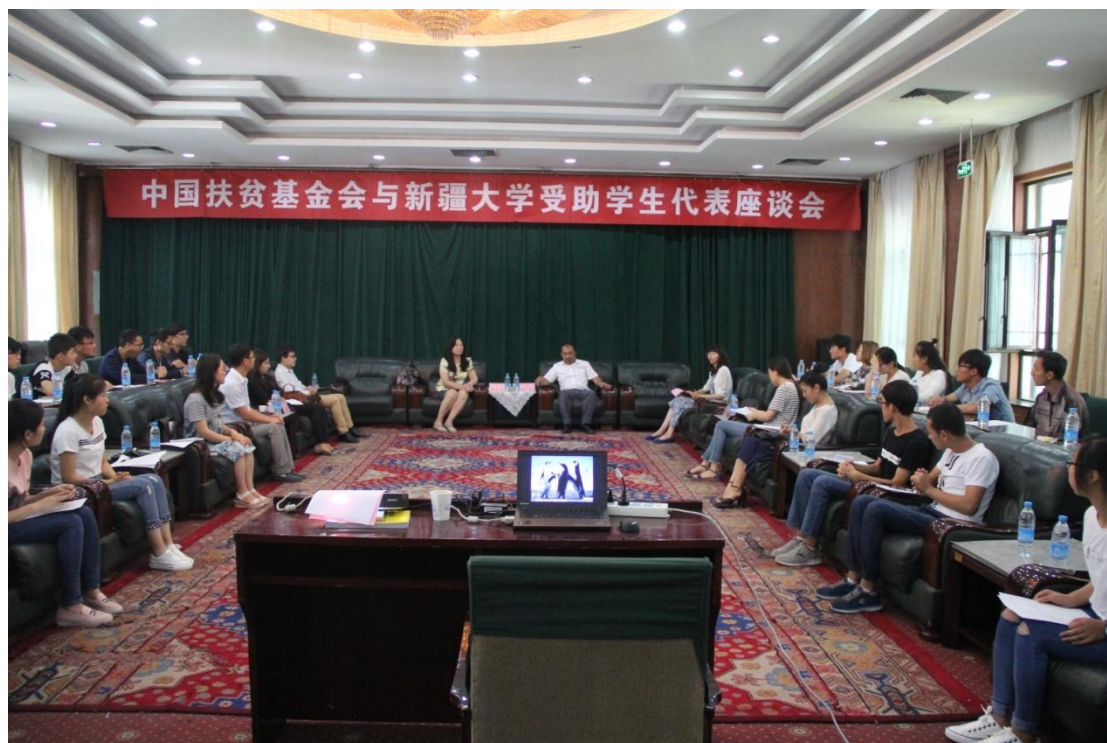
与高校老师及收益学生交流