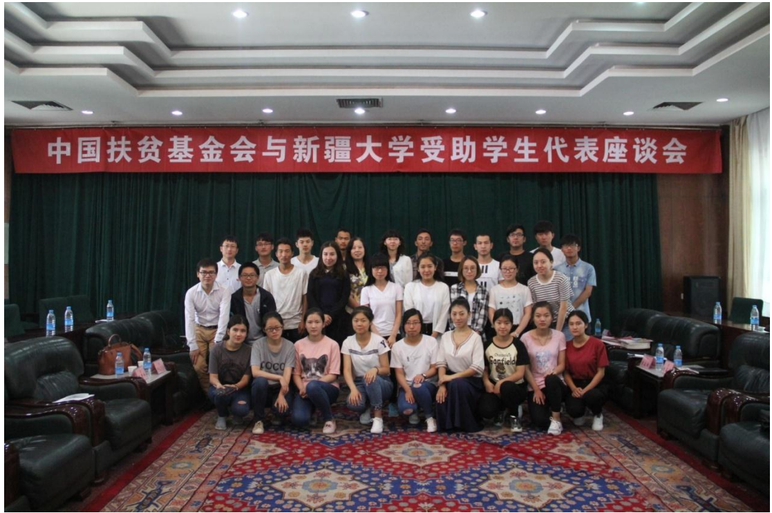
参加座谈会全体师生合影留念