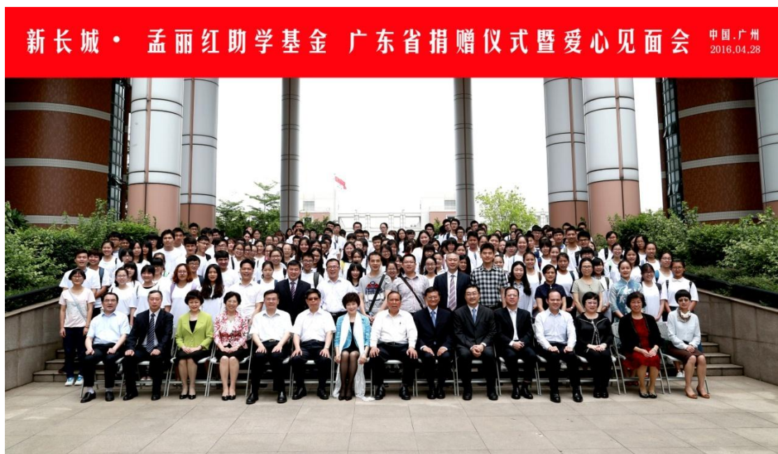
会议结束全体合影