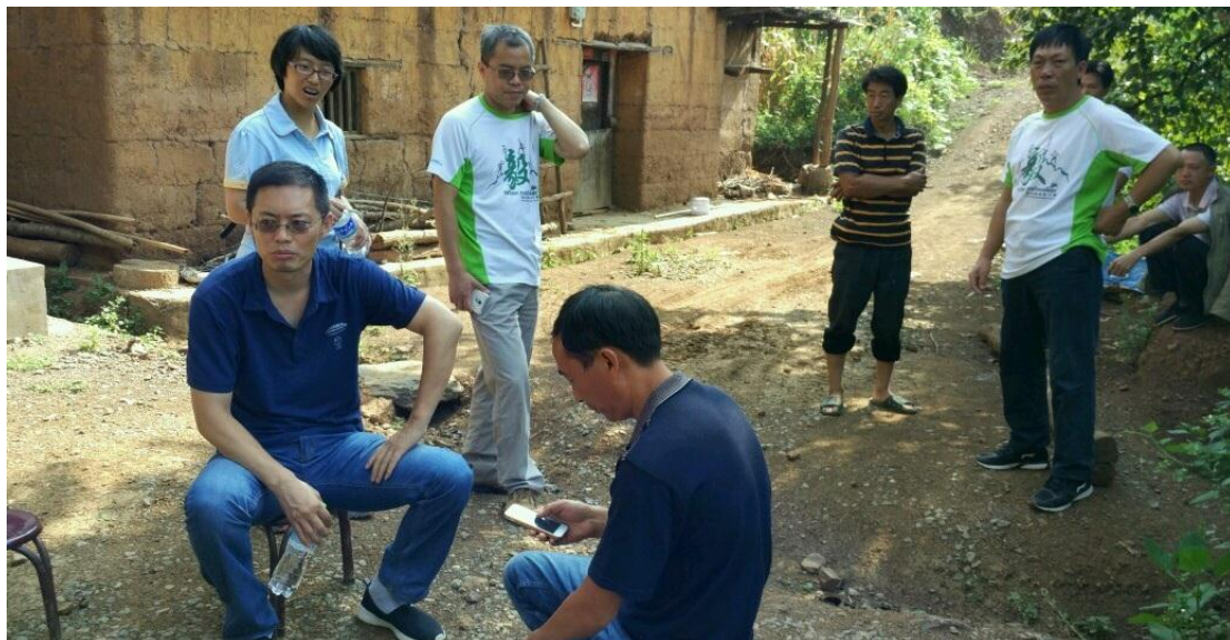
乐施会老师到项目点指导