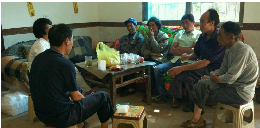
合作社骨干讨论制定合作社制度