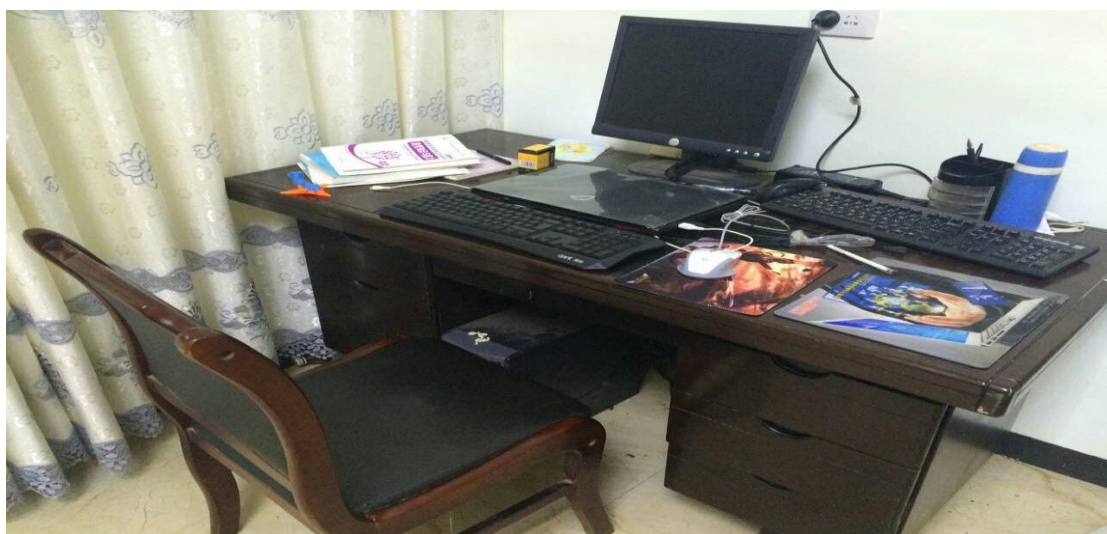
合作社配备电脑设施