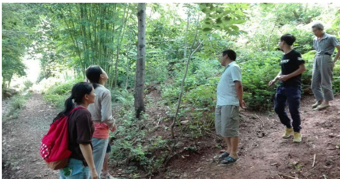
调研走访，与村民沟通项目

项目效果： 群众参与有很高的积极性，自发劳动力共出工 228 人·天，其中公共区域出工 91.5 人·天。道路硬化后，村民出行更加安全，雨天泥泞的道路不会给村民造成困扰；村里农产品运输也更加方便。另外通过第一阶段项目实施，政府也在评估该模式，并规划将村间道路硬化在其他社开展。