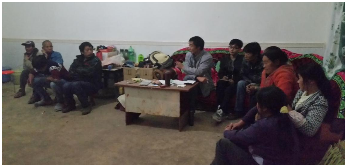
村民会议对项目进行讨论