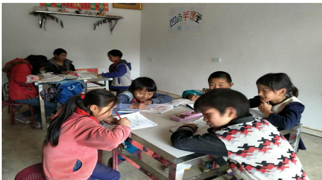
社工站四点半课堂