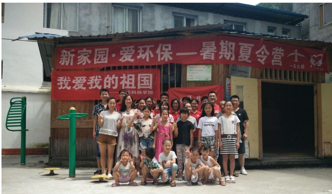
“新家园，爱环保”主题夏令营