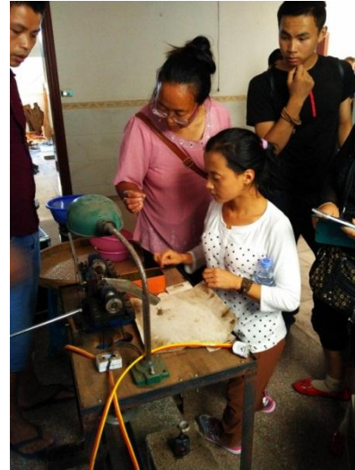
参观当地打磨制作流程

通过这次的考察参访，让社员们看到了当今手工艺打磨的市场情况。同时，对于如何提高产量和产品质量，有了很深的体会，回来后召开全员大会讲述把在仙游的所见所学讲述给没有去的学员。