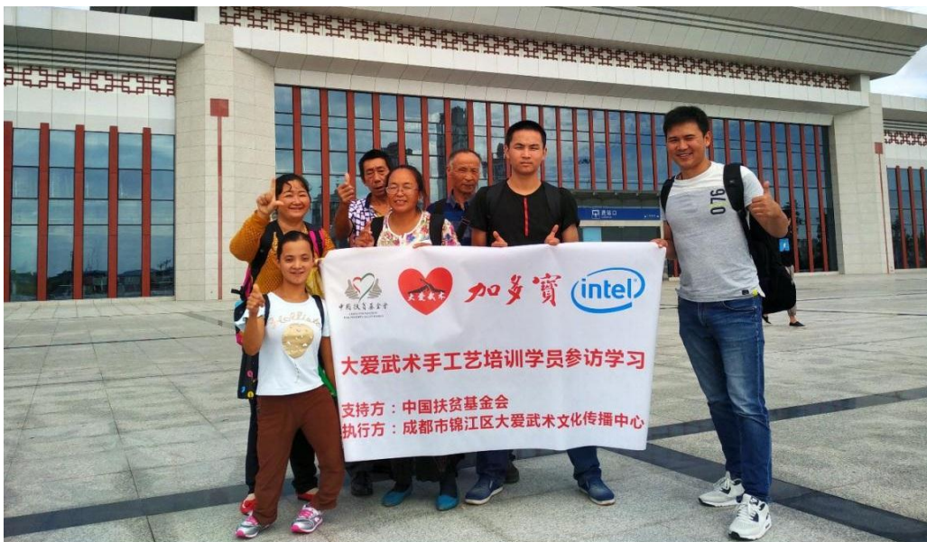
合作社核心成员前往福建仙游学习