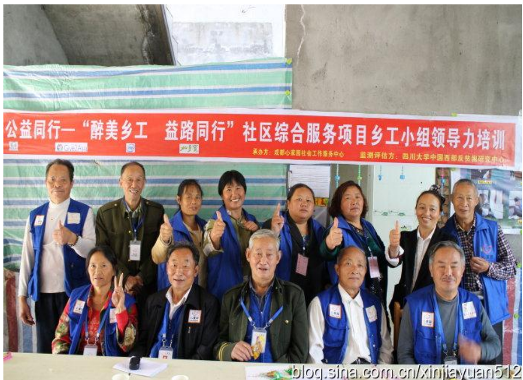
乡工小组领导力培训

项目进展： 心家园开展“七彩盛夏·益心忆毅”暑期夏令营，30 天营会服务儿童青少年 2700 余人次；组织晚间坝坝舞活动，累计 3600 余人次参与；为老年人开展阳光体检活动服务 80 余人；在仁加村放映晚间电影 4 场，走访社区老年人、残障人士近千人次，给 10 名老党员送节日慰问，给 5 名老兵送关怀；举办心理宣传茶话会活动，中秋游园活动；进行乡工督导例会 3 次，乡工小组领导力培训 2 次。