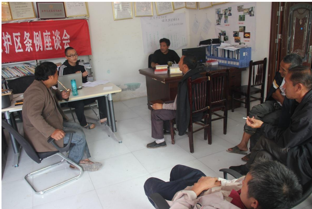
合作社社员手册讨论