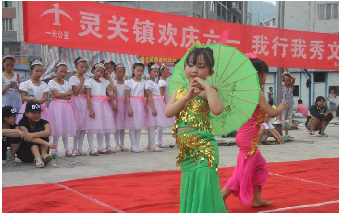
“快乐舞台·达人秀”活动

项目效果： 通过托管服务社区儿童对绘画、舞蹈、音乐有了新的认识，并在认识后选择自己最喜爱的文艺方式，参与活动也使他们比以前更活泼开朗并且爱与人沟通交流。“一天做件事”活动指导当地志愿者小红帽主动参与社区公共事务，孩子们的责任心增强了，对社区有了强烈的归属感。本土社工培育方面，社工获得了很多学习机会，总结之后会成为自身的财富。