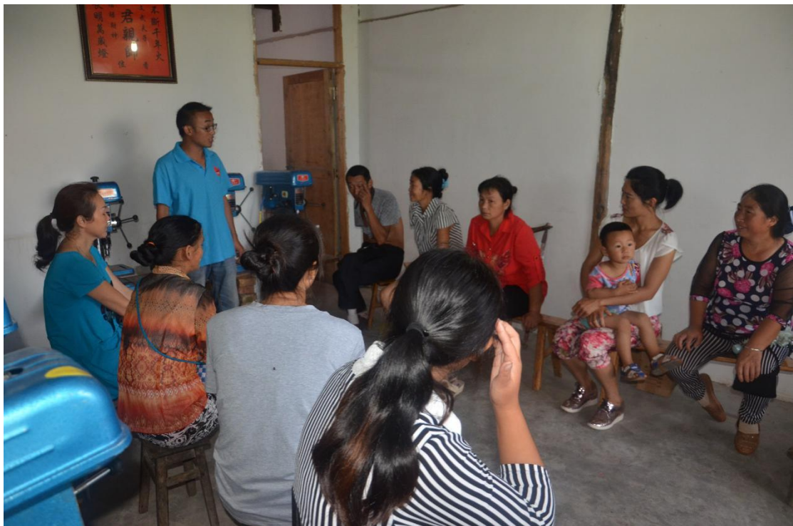
第一阶段技术培训

项目进展： 大爱武术本期新招募 10 名贫困家庭学员，进行佛珠生产技术培训已进展到中期，学员已经可以进行产品定型操作。为合作社成员购买了书籍并督促学习木材知识，由他们自行采购了木材原料。9 月带领老学员前往福建仙游参观学习，门店方面通过资源链接已经初步确定了三个店面选址意向。