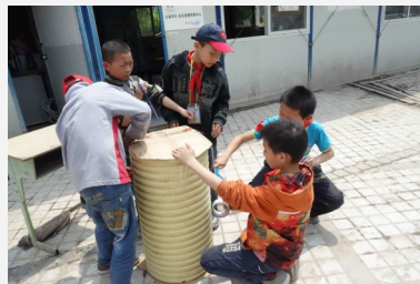
小义工利用废弃资源做环保用品

截止2015年12月底，三小社工站开展了一系列活动共计服务11937人次。其中图书借阅1245人次，沙盘服务234人，组织开展了61次兴趣小组活动。新一千零一夜住校生入睡故事系统安装完成并投入使用，现已播放了179个故事。社工信箱进一步跟进的个体辅导有5人；并开展了16节正向成长课程，小义工团建培训20余次，运动队团建课27节，教师培训一次，工作人员培训8次，亲子活动开展3次。