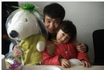
永不言弃的向上少年