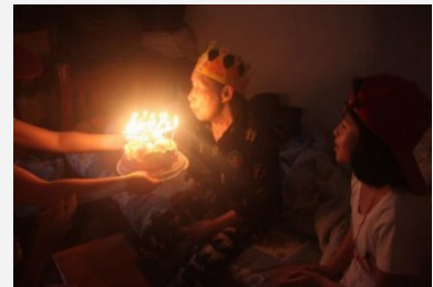
“小红帽”为老人过生日