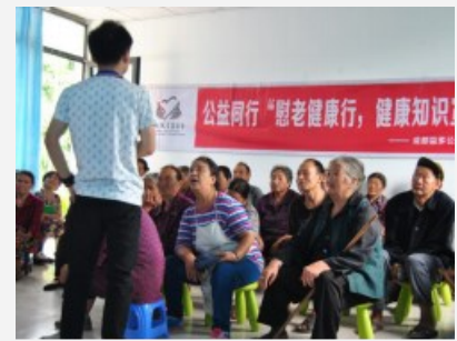
横溪村敬老健康行·健康知识宣传