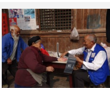
社工为老人检查身体