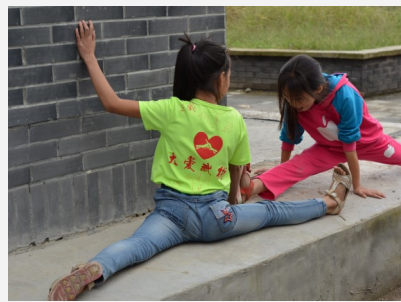
孩子们利用课余时间刻苦训练

截止2016年1月，共计生产佛珠64串，累计销售53串，销售 收入超2万余元。2015年10月建立了一只社区儿童功夫梦表演队 伍，多次登台，受到了社区居民的高度赞扬和肯定。2015年4月 在龙门乡建立了一个以社区为中心，辐射整个青龙场村的社区生 计帮扶培训中心，招募20名学员参与培训（包含8名残疾人学 员），11月互助小组正式转型为合作社，开始自主筹备合作社成 立相关事宜，并于2016年1月正式取得合法的营业执照，确立了 受益对象受政府认可和扶持的正式身份。