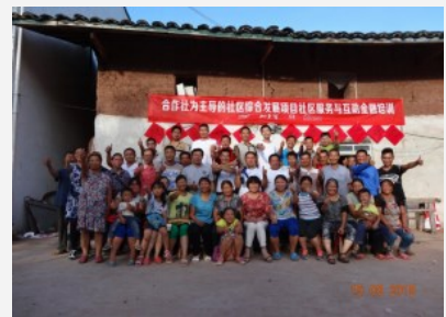
合作社互助金融及社区服务培训