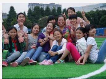
六年级毕业生纪念照