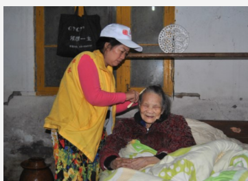
芦大姐入户照顾老人