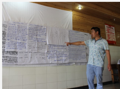
合作社培育评审会

2015年，共为14个合作社提供社区服务、互助金融、人才培养方面的服务，协助合作社进行互助金融、社区服务活动的实施，并开展人才培养外出考察、集中培训、座谈交流等活动。年内，合作社共收到申请29份，评审通过并签约支持18家合作社（社区服务7家、人才培养8家、互助金融3家）；期间，项目举办大型培训活动4次，小型培训交流活动10余次；合作社开展社区服务共48次，服务人群包括老人、妇女、儿童，受益人数超过千人次。益众通过集中培训、交流参访、自主学习、学习网络建立等活动形式，参与培养合作社成员30余人。