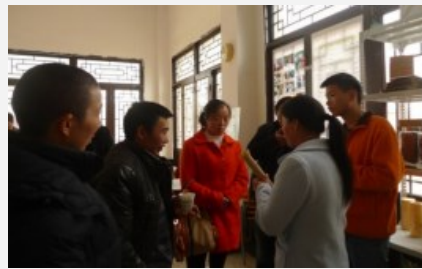
村民外出参访交流

2015年，养殖规模扩大近一倍，羊只存栏数210只，出售淘汰羊5只，获得的收入为合作社所有。合作社目前共有42户社员，新增合作社成员10户，全年召开合作社大会2次，进行了加强合作社制度安排、利益机制、成员合作行为和组织绩效等方面的努力。2015年全年共组织合作社成员外出参访学习183人次，开展种植培训51人次，开展养殖培训106人次。