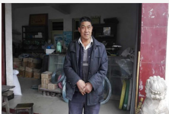
长毛兔养殖协会会长

近年来，供销系统承担了农村电商和产业发展的任务，老杨又利用自己曾经是供销系统老员工的身份争取市县供销社对长毛兔产业发展的重视和支持。社员们戏虐地称他为：一只不老的“种公兔”。