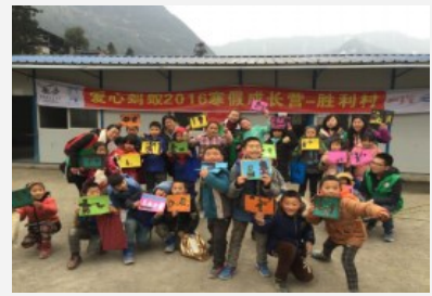
寒假成长营杨寺庙分队的手工课展示