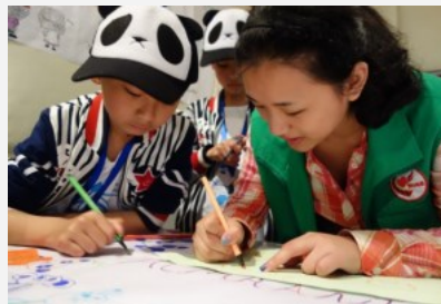
小蜜蜂在志愿者的带领下认真学画

2015年，项目开展了暑期成长营和寒假成长营各1次，服务中林小学和胜利村共209人，参与志愿者28名，开展了儿童兴趣培养、安全教育、自然教育、主题活动、行为纠正以及志愿者素质拓展等活动内容；期间开展小蜜蜂计划各1次，中林小学和杨寺庙活动中心直接参与儿童22名，志愿者8名。社区儿童活动中心的常规陪伴如课业辅导、手工绘画兴趣培养、儿童成长陪伴及小小图书角以如期开展，项目效果明显，并于2016年元旦正式组建了一支8人的小小志愿者队伍。