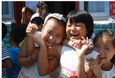
坚持上课-开心快乐的小朋友

截止2016年1月，已为当地社区培育15名乡工，开展15次乡工培训活动，参与人数达230余人次。2015年中至少有9户农户参与了加村生计互助小组，实现平均每户经济收入达5000元以上。社区服务方面，开展儿童青少年服务9200余人次；老人探访服务60余人次，社区活动服务老人1400余人次；仁加持续开展晚间电影放映7个月，大同广场舞持续开展12个月；开展社区融合活动14次。