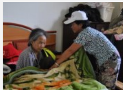
横溪村护理员在为老人整理床铺

芦山益诚公益服务中心注册成立，在当地招募了10名本土护理员，其中大板村5名，横溪村5名，开展居家养老服务，建立了居家养老服务评估指导体系。项目已为两村建立340位60岁以上老人档案，分三类针对性开展居家养老服务。益多与两村老协沟通讨论，设计出符合当地特点的大板村九大碗服务队生计项目和横溪村老年茶坊生计项目。两个项目都已启动实施，并实现盈余，收支单独立账，记录清晰。项目结项时，横溪村老人照护专项基金共有1200元；大板村老人照护专项基金共有960元。两村都已制定《老人照护专项基金使用管理办法》，并开始实施。