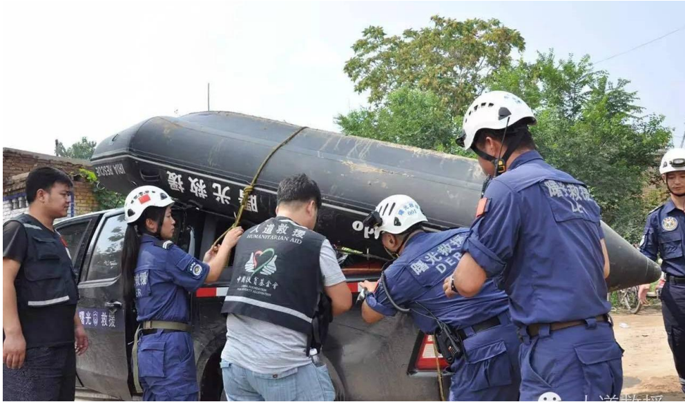
人道救援网络成员厦门曙光救援队紧急出动两艘冲锋舟，为抢险人员提供水面保障