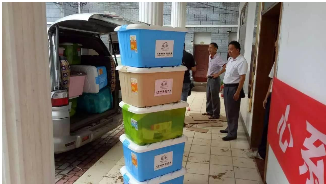
人道救援成员盘县社会主义工联合会于湖北省红安县 13 个乡镇发放物资