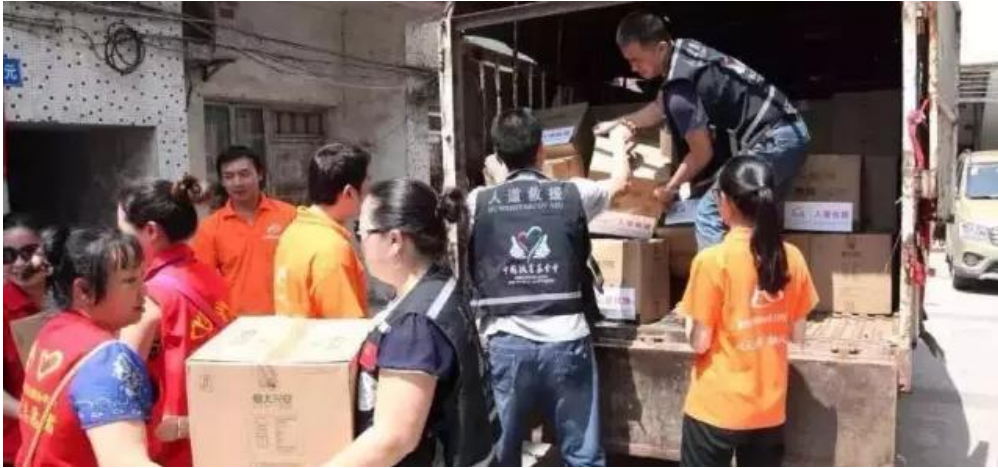
人道救援网络成员重庆青助会在重庆江津区发放救援物资