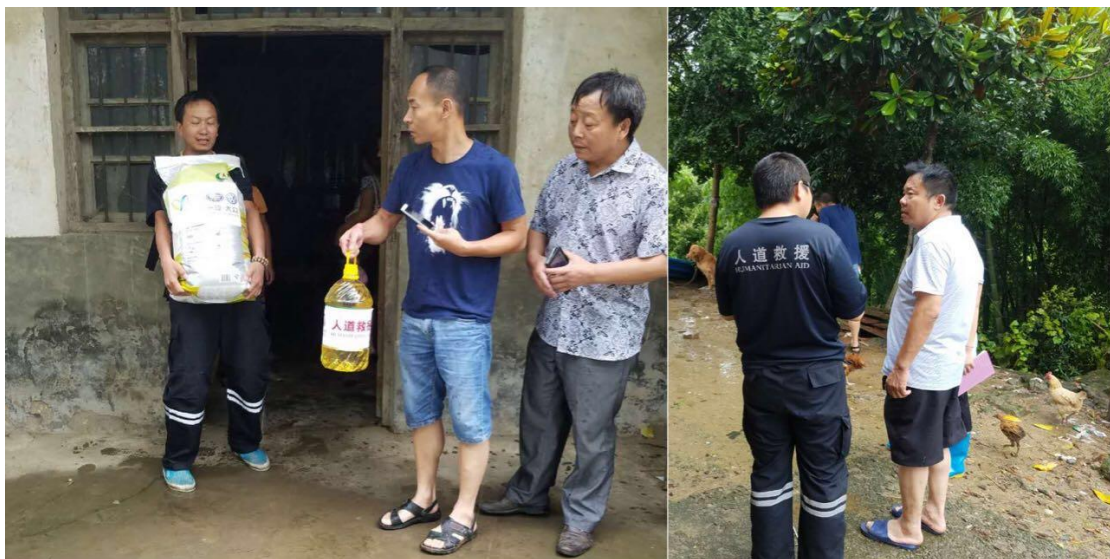
中国扶贫基金会湖北救援工作人员入户发放粮油并走访受灾农户

7 月 1 日—31 日，中国扶贫基金会中扶人道救援队，人道救援网络成员盘县社会主义工联合会、重庆青助会、彩虹公益社在湖北红安县、大悟县、蕲春县、麻城市 4 县市 28 个乡镇发放价值 677.03 万元物资，包括 23496 份粮油、11472 个家庭包，惠及 2.5 万户 10 万余人。