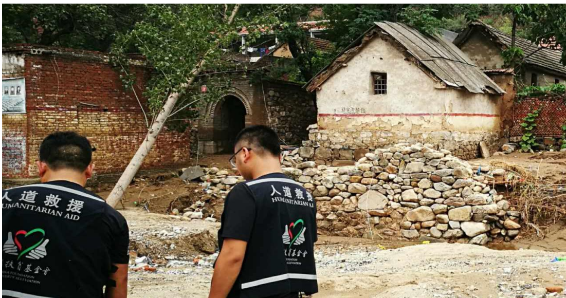
人道救援网络成员平顶山志愿者协会在河南安阳市安阳县进行灾情排查、需求评估工作

7月20日—24日，中国扶贫基金会人道救援网络成员平顶山志愿者协会在河南安阳市安阳县发放价值2.7万元物资，270份面粉与食用油，惠及270户1000余人。