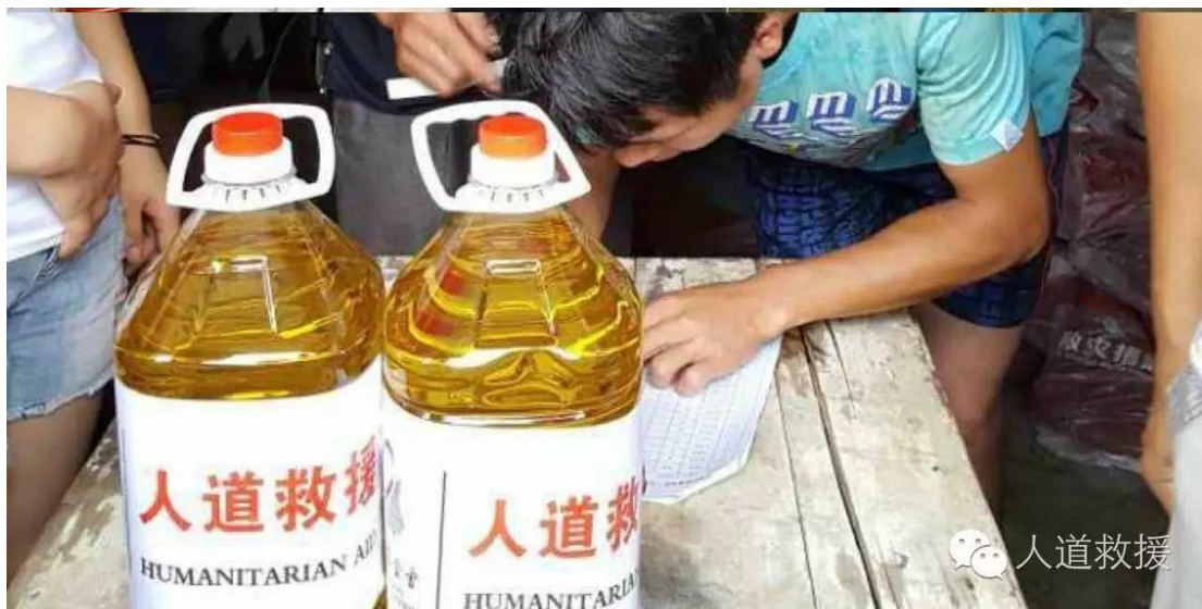
人道救援网络成员盘县社会主义工联合会在贵州省榕江县发放物资