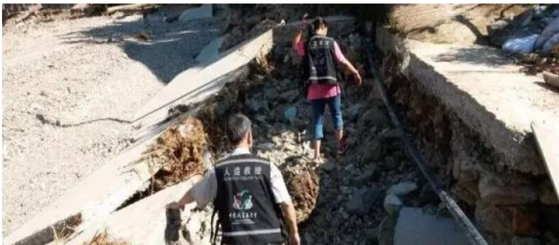
人道救援网络成员盘县社会义工联合会在受灾地区进行需求评估、灾情排查工作

7 月 8 日—31 日，中国扶贫基金会人道救援网络成员盘县社会义工联合会在贵州榕江县 6 个乡镇发放价值 101.69 万元物资，包括 722 份粮油、1324 个家庭包、2000 件雨衣、2000 条防雨布、1000 床棉被，惠及 3300 余户 1.3 万余人。