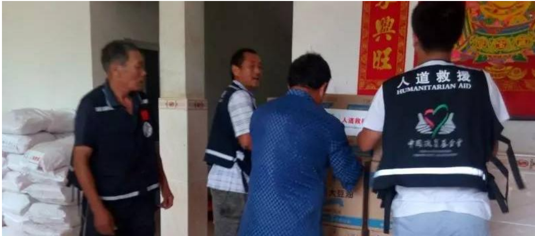
人道救援网络成员江西岷美公益在江西鄱阳县 2 个乡镇发放救援物资