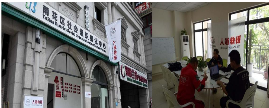
南方水灾物资调配中心在湖南长沙设立