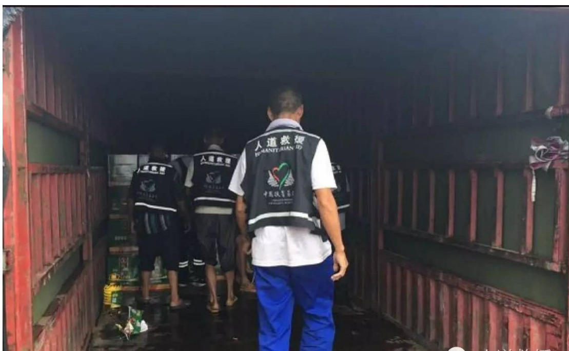
人道救援网络成员彩虹公益社在湖北省大悟县开展粮油分装运输工作