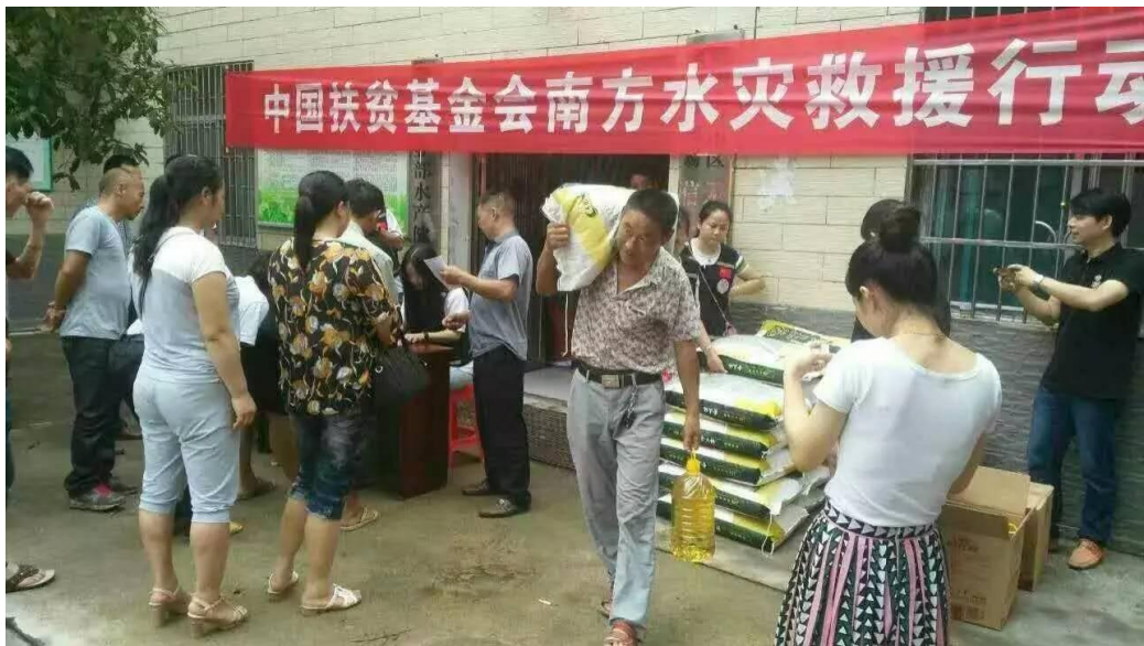
人道救援网络成员长沙市群英会于湖南省岳阳市君山区、岳阳楼区、云溪区发放粮油

丈县、安化县 15 个市区县 25 个乡镇发放价值 317.21 万元物资，包括 14305 份粮油、2594 个家庭包，惠及 1.5 万户 6 万余人。