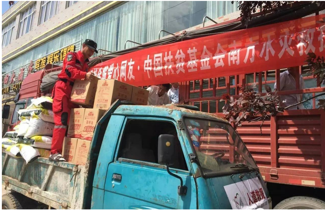
中扶人道救援队于湖北省麻城县福田河镇发放救援物资