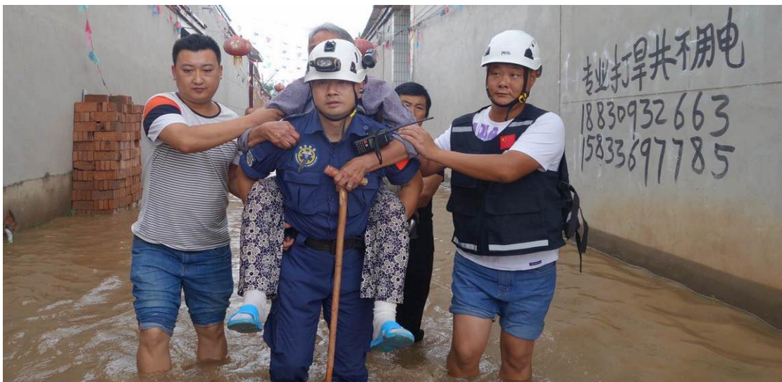
人道救援网络成员厦门曙光救援队转移受灾群众

7月20日—28日，中国扶贫基金会人道救援网络成员厦门曙光救援队在河北邢台市宁晋县发放价值3.76万元物资，1253件救生衣，惠及1253人。