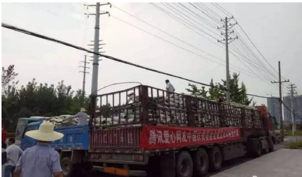
人道救援网络成员重庆青助会在湖北省蕲春县为 12 个安置点发放大米、食用油等救灾物资