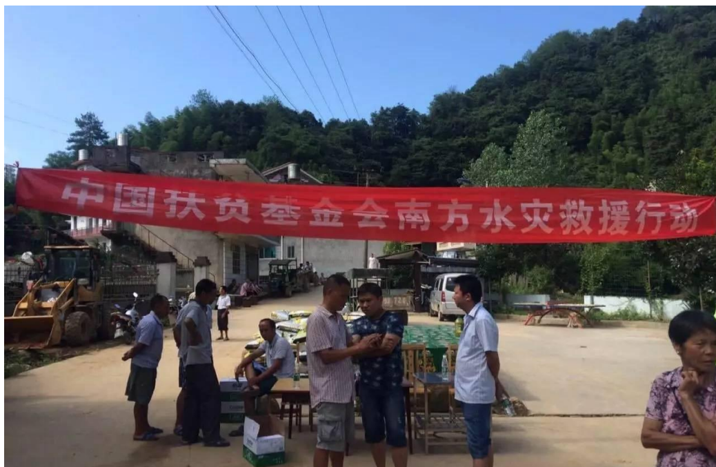
人道救援网络成员长沙市群英会于湖南省安化县烟溪镇通溪桥村为村民发放救灾物资