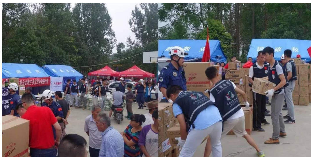
人道救援网络成员厦门曙光救援队在安徽池州市、无为县4个乡镇发放救援物资