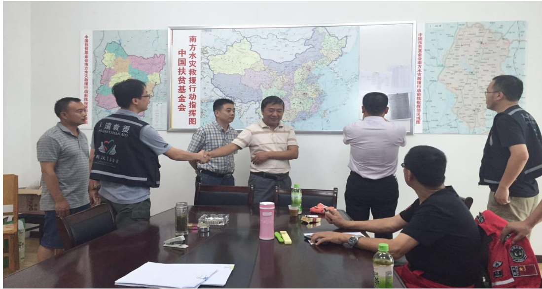
南方水灾一线救援指挥部在湖北红安设立