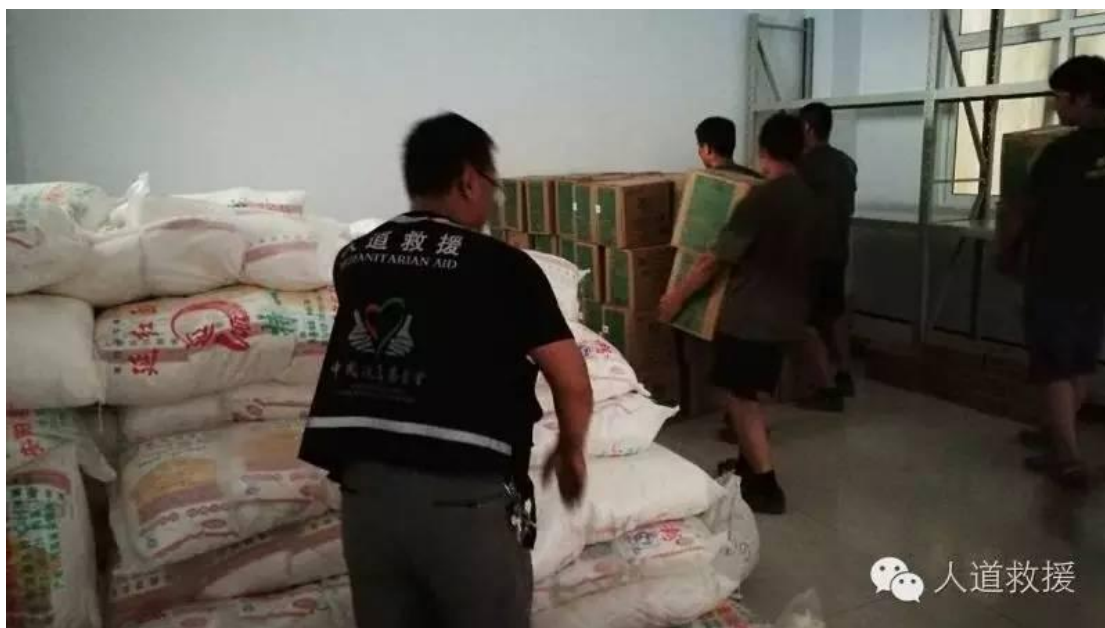
人道救援网络成员平顶山志愿者协会在河南安阳市安阳县搬运救援物资