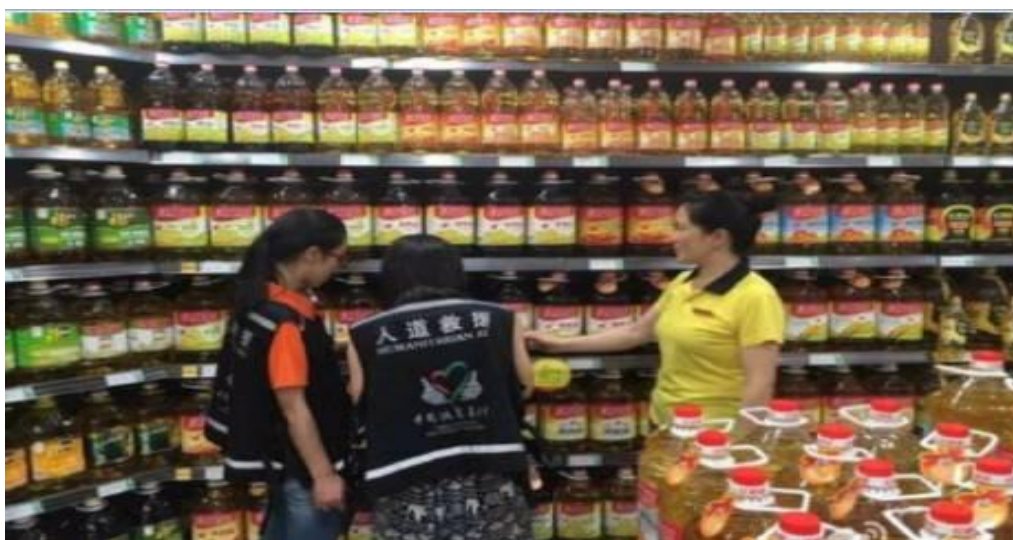
人道救援网络成员重庆青助会成立7人询价小组开展询价工作

7月8日—15日，中国扶贫基金会人道救援网络成员重庆青助会在重庆江津区发放价值4.89万元物资，365份粮油，惠及365户1500余人。