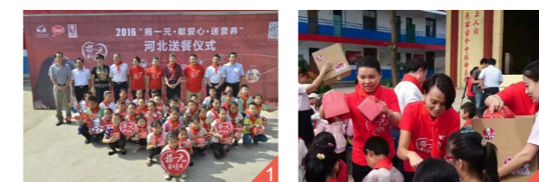
图一 | 活动大合影。

9月10日，中国扶贫基金会副会长江绍高、肯德基中国CEO屈翠容、肯德基公益大使——奥运冠军张梦雪赴河北省西洪子店小学，看望“捐一元·献爱心·送营养”项目受益的孩子们，为每一个孩子亲手送上牛奶和鸡蛋，作为每日营养补充。