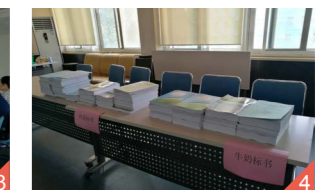
图四 参加谈判会供应商提交的招标文件。