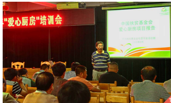
图一：项目工作人员为受益学校的老师们做项目管理培训。

2016年，中国扶贫基金会工作人员先后赴云南福贡县、施甸县、南华县开爱心厨房项目的项目监测。通过查看各学校爱心厨房使用情况与教育局、学校老师座谈、走访学生家庭，了解项目实施情况。同时，项目工作人员为项目学校的校长、老师们进行了项目培训。