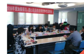
图一 爱心厨房供应商竞争性谈判会现场。

2) 7月26日，在中国扶贫基金会举行2016年爱加餐项目——营养加餐竞争性谈判会。此次谈判会共9家供应商参加，评委包括3名外部专家、捐赠人代表、百胜集团北京市场代表、受益项目区江华县教育局代表以及中国扶贫基金会秘书处领导和监测部工作人员共7位，中国扶贫基金会采购督导官全程监标。各家供应商分别述标，评委从技术、价格、售后服务、增值服务等方面进行评审，经过打分和核算确定了投标供应商的评分和排名顺序。最终，牛奶、鸡蛋供应商分别选定了昆明华曦乳业集团有限公司、湖北神丹健康食品有限公司以及昆明雪兰牛奶有限责任公司、内蒙古伊利实业集团股份有限公司4家作为2016年爱加餐项目一营养加餐的中标供应商。