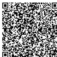
微公益爱加餐项目

地址：北京市海淀区双榆树西里 36 号南楼 5 层 邮编：100086 网址： www.cfpa.org.cn 邮箱： my120@fupin.org.cn 联系电话：010-6256 1633；010-8287 2688 转 588,825