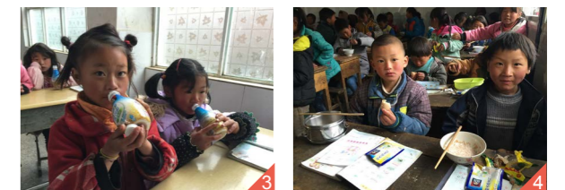
图四：早上，学生们吃着营养“桂格燕麦片”和鸡蛋。

2) 9月20日，中国扶贫基金会携手百事公司大中华区共同邀请中国营养学会的营养专家在云南昭通县盘河乡三寨小学举办食育教育活动。他们依据《中国居民膳食指南(2016)》开发出了适合小学生的《健康营养手册》和营养知识海报，为孩子们设计了寓教于乐的“营养知识课”和食物模型等，让孩子了解什么是基本营养保证，怎样吃才能更营养。此外专家还对当地学校校长以及老师开展了“学校食堂供餐安全及营养知识”培训，旨在帮助提高中国贫困农村地区学生营养水平和健康意识，促进青少年健康成长。