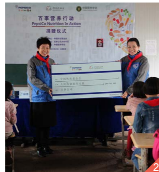
图二 百事公司向中国扶贫基金会捐资100万元