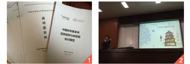
图一：制作的项目管理手册

1) 3月11-12日，中国扶贫基金会联合中国营养学会在云南昭通昭阳区开展爱加餐—“百事营养行动”培训会，培训包括项目执行流程、反馈、宣传以及学生营养、学校供餐安全等内容。来自昭阳区主要乡镇学校校长、学校供餐负责人等近200人参加了培训。