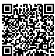
网织希望 - 为饥饿儿童 送营养 腾讯乐捐