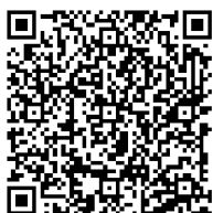
捐一元项目腾讯乐捐