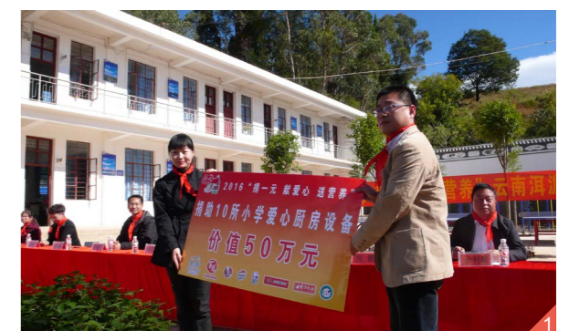
图一 | 中国扶贫基金会、百胜中国西南市场共同向洱源县捐赠10所爱心厨房。

11月4日，中国扶贫基金会与百胜中国西南市场公共事务部、云南省委宣传部共同举办2016年“捐一元·献爱心·送营养”项目云南省洱源县捐助仪式，会上，向洱源县10所完小捐赠了爱心厨房，将惠及洱源县21000多名学生。