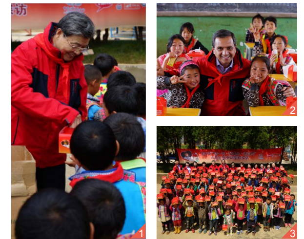
图三 | 活动大合影。

9月10日，中国扶贫基金会副会长江绍高、肯德基中国CEO屈翠容、肯德基公益大使——奥运冠军张梦雪赴河北省西洪子店小学，看望“捐一元·献爱心·送营养”项目受益的孩子们，为每一个孩子亲手送上牛奶和鸡蛋，作为每日营养补充。