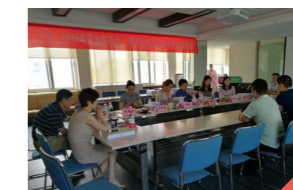
图三 营养加餐供应商竞争性谈判会现场。