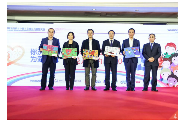
图一 贴满爱心墙的“你沃一起，为爱加餐”爱心卡。 图二 沃尔玛收银人员接收顾客爱心捐款。 图三 沃尔玛供应商在各家店宣传“你沃一起，为爱加餐”。 图四 沃尔玛携手中国扶贫基金会、腾讯公益以及主要供应商和顾客为爱加餐项目捐款。2011年至今，累计捐出约700万元人民币，受益儿童超过5000名。