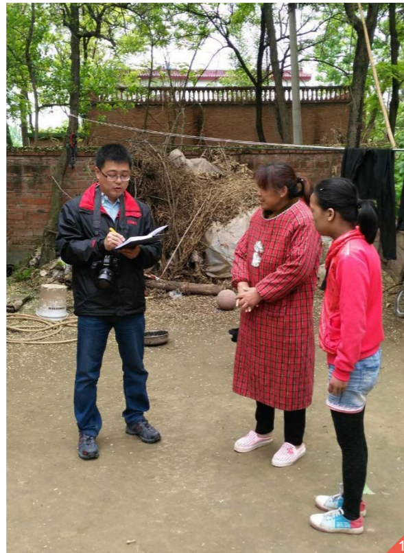
图一：图为项目工作人员入户考察学生家庭。

2016年，为了解各县在实施项目前的准备工作及各县基本情况，项目工作人员先后赴河北、辽宁、河南、贵州、云南5省13县进行项目考察。2016年，爱加餐新增项目县学校85所，项目人员赴43所项目学校进行前期考察，考察率达50.59%。通过实地走访学校、学生家庭，了解各地关于农村地区营养改善计划实施模式、学校发展情况、贫困现状、厨房准备情况等，并通过座谈会的形式介绍了项目基本情况、操作要求，为项目在当地的顺利开展奠定了基础。