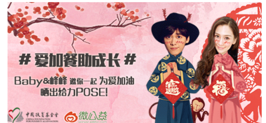
图一 | 李易峰与 Anglebaby 助阵“晒给力 POSE，为爱加油”活动。

扶贫基金会微信以及腾讯公益爱加餐项目捐款页面进行推广。截至 2 月 19 日，微博 # 爱加餐助成长 # 话题阅读量超过 6700 万，吸引 17 万网友参与讨论；微博以及微信端累计筹款超过 18 万元。