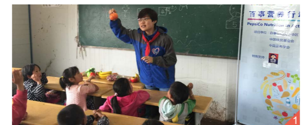
图一：营养专家利用食物模型为学生们讲解营养知识。

2) 9月20日，中国扶贫基金会携手百事公司大中华区共同邀请中国营养学会的营养专家在云南昭通县盘河乡三寨小学举办食育教育活动。他们依据《中国居民膳食指南(2016)》开发出了适合小学生的《健康营养手册》和营养知识海报，为孩子们设计了寓教于乐的“营养知识课”和食物模型等，让孩子了解什么是基本营养保证，怎样吃才能更营养。此外专家还对当地学校校长以及老师开展了“学校食堂供餐安全及营养知识”培训，旨在帮助提高中国贫困农村地区学生营养水平和健康意识，促进青少年健康成长。