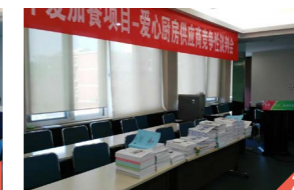
图二 参加谈判会供应商提供的招标文件。