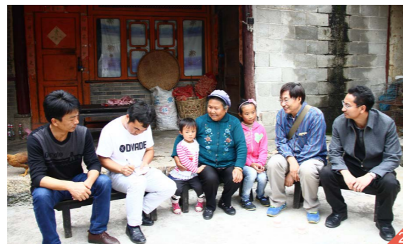
图二：项目工作人员入户探访项目受益学生家庭。