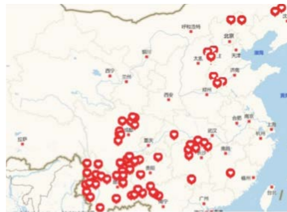
爱加餐项目国内受益地区

2016 年，爱加餐项目投入款物 3860.3 万元。在国内，覆盖 8 省 23 州/市/30 县 15.6 万人次儿童，其中营养加餐覆盖云南、贵州、广西、四川、湖南 5 省 12 州 17 县 245 所学校约 6.13 万人次学生；爱心厨房为云南、贵州、广西等 8 省 22 州 27 县的 271 所学校配备了标准化的爱心厨房设备。在柬埔寨、加纳等国家开展学校供餐项目，受益儿童达 2.78 万人。此外，为云南、贵州 2 省 5 县 1.3 万人次儿童提供了近 4.8 万包蜜儿餐，价值 858.8 万元。