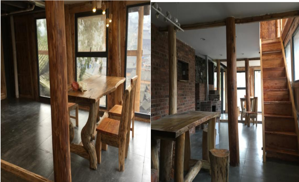
图△改造完成的二号民宿客栈公共休闲区域与部分客房展示