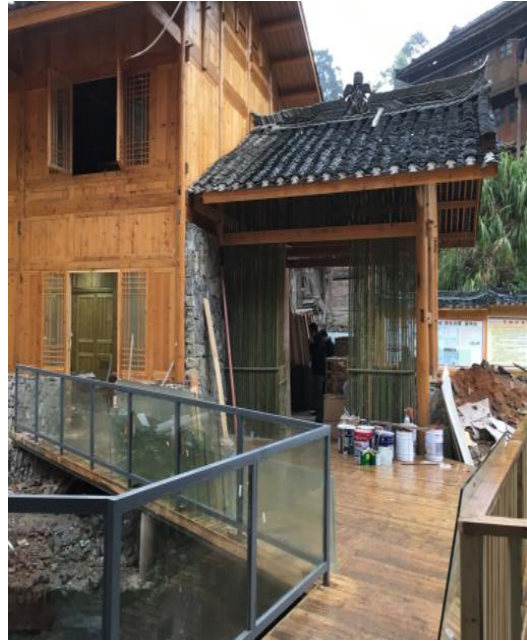
图△文化中心室外桥的外观图