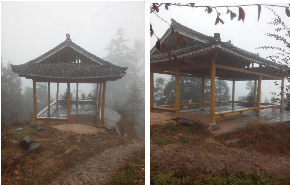
图△景观凉亭的外观

完成了一座景观凉亭的建设，目前凉亭已经投入使用；同时完成村中部分鱼塘和坡道的整改。