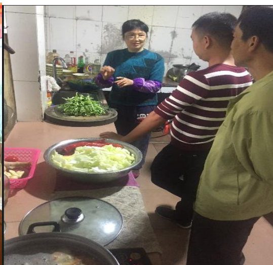
图△餐饮培训人员和老师学习菜品处理方法