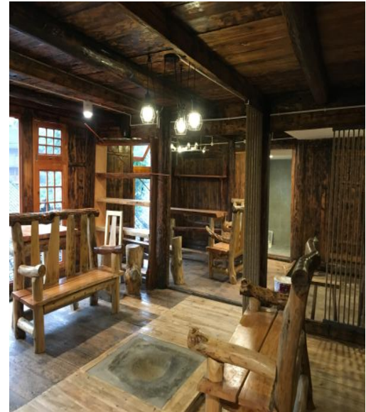
图△改造完成的一号民宿客栈公共休闲区域