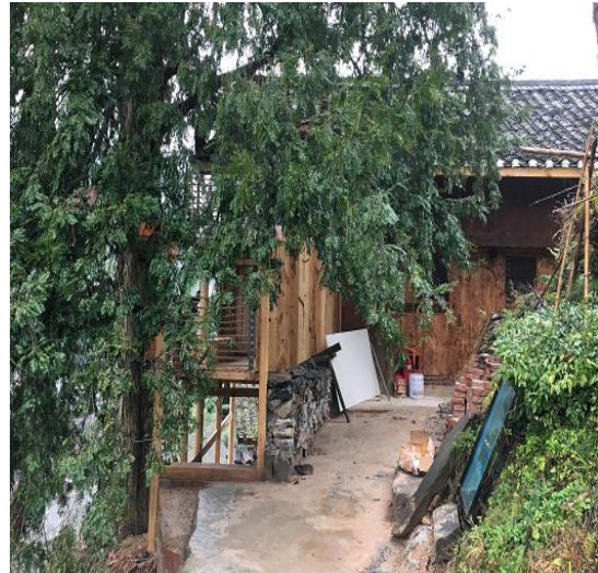
图△ 二号民宿客栈红豆杉外观

整合文化中心与两个民宿客栈，现在反排的高端民宿接待量可以达到 40 人左右，餐饮接待可以同时满足 100 余人共同进餐，会议室可以容纳 40-50 人。