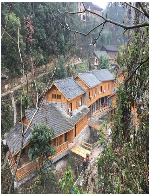
图△文化中心外观图

反排文化中心的一层占地近600平方米，一层的功能区有旅游接待大厅、餐厅、厨房、游客体验区、木鼓舞训练区、表演器材储存室、村史馆；二层主要以住宿为主，有三个高端民宿客房和两个志愿者之家。在住宿上，反排文化中心接待量可以达到20人；在餐饮上，一层可以接待100余人同时就餐。文化中心集接待、住宿、餐饮、会议、娱乐休闲为一体，成为反排真正意义上的文化中心。