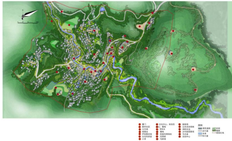
反排村规划平面图

2016年8月份，由贵州省建筑设计研究院完成了对反排周边建设规划、保护规划、反排村示范民居的整套设计图与施工图，交付完成的图纸由贵州省黔东南州台江县方召镇政府申报贵州省建设规划委员会，拟作为反排未来规划总规方案。