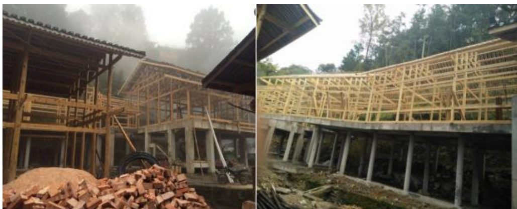
图△2016年3月份反排文化中心概貌

2014年9月19日，反排文化中心项目正式开工建设，由于前期做了大量的民事协调工作，导致反排文化中心的施工进度异常缓慢。直到2016年3月份，反排文化中心的主体框架基本完成。