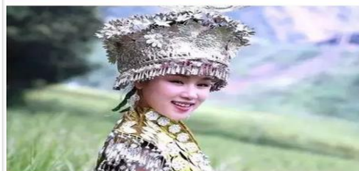
▲ 美丽的苗族姑娘，佩戴苗族传统银饰