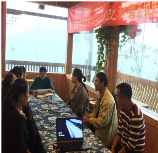
图△培训老师每天早晨开培训例会

培训结束之后，组织学员开展培训总结大会，学员在客房打扫、与客人沟通能力、餐饮方面得到了很好的提升，为反排的正式开业做了扎实的铺垫。通过培训，开阔了反排学员的视野，让他们有了民宿客栈经营的初步理念，也意识到了自己观念的落后，愿意更加配合合作社今后的工作。