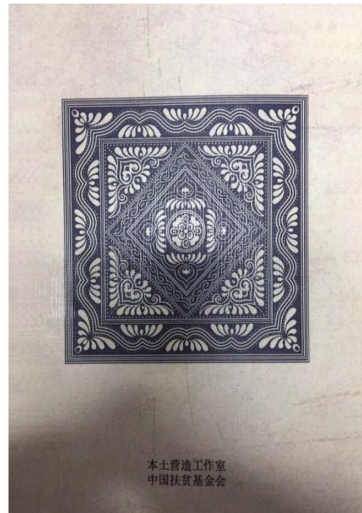
图△文化书初稿封底