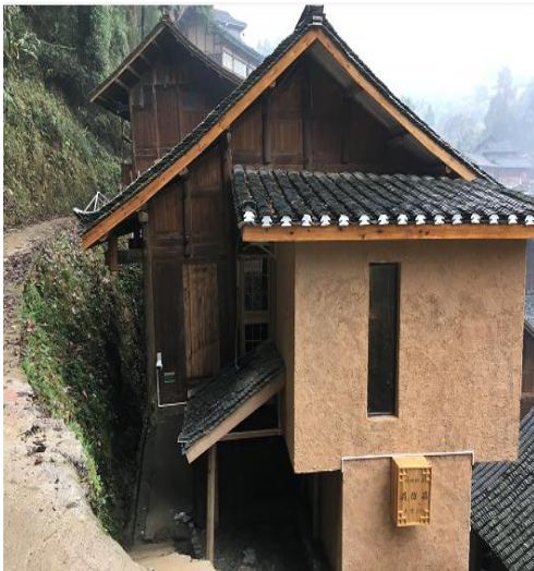
图△ 一号民宿客栈外观