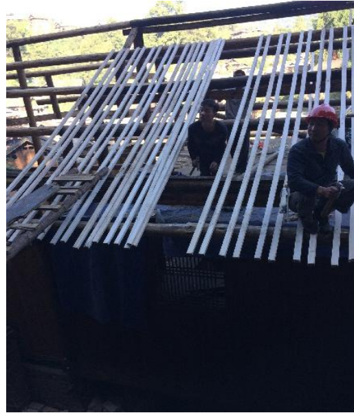
图△旧民居屋面改造