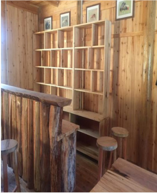
图△：文化中心内部休闲区吧台装修