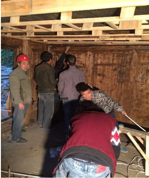
图△旧民居改造内部结构的加固改造