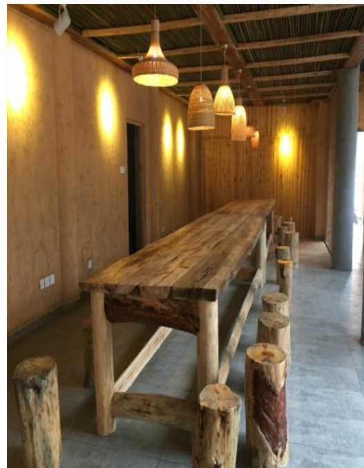
图△文化中心餐厅，长桌宴