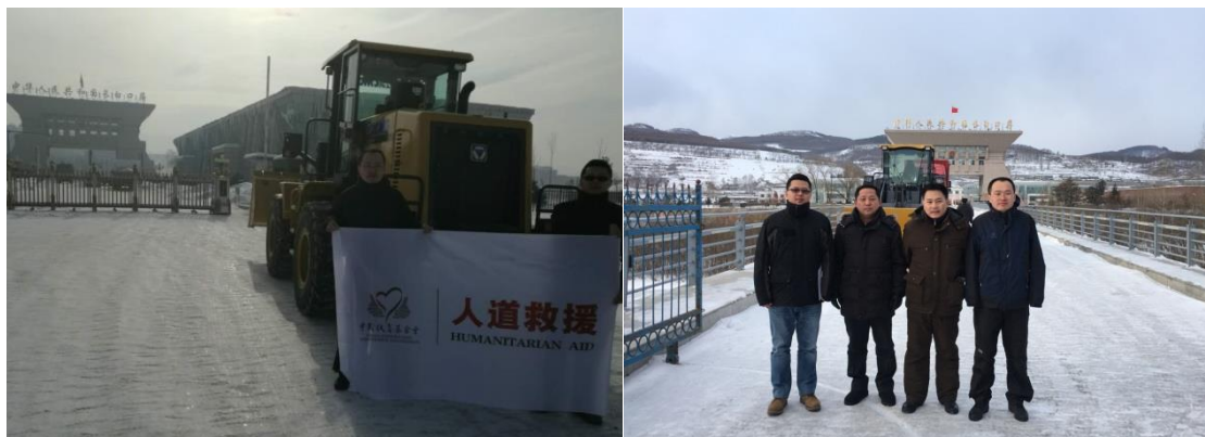
中国扶贫基金会工作组与朝中民间交流协会官员、北部灾区参谋进行了物资捐赠移交工作