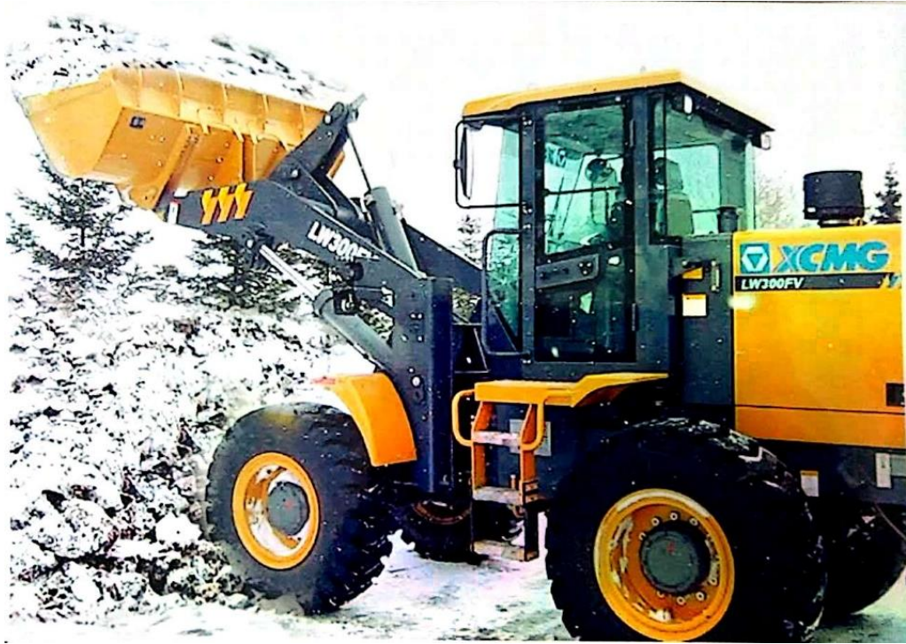
我会捐赠的铲车在朝鲜三池渊郡灾区投入使用