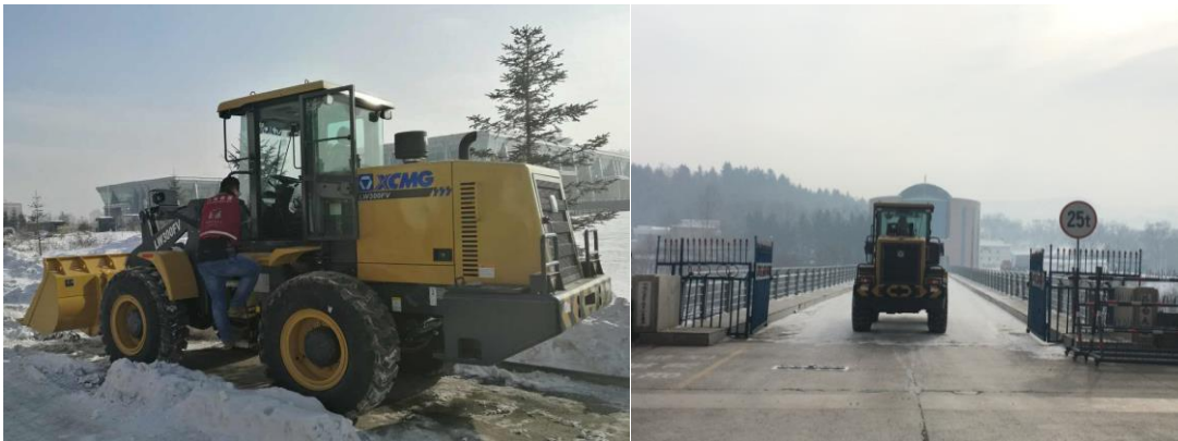
轮式装载机通过长白口岸过关