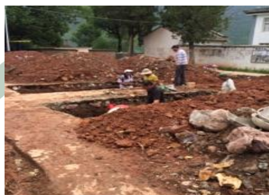
2016年8月8日，进行基础开挖工作