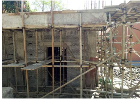
2017年4月28日，宿舍楼一层建设完成，开始二层施工