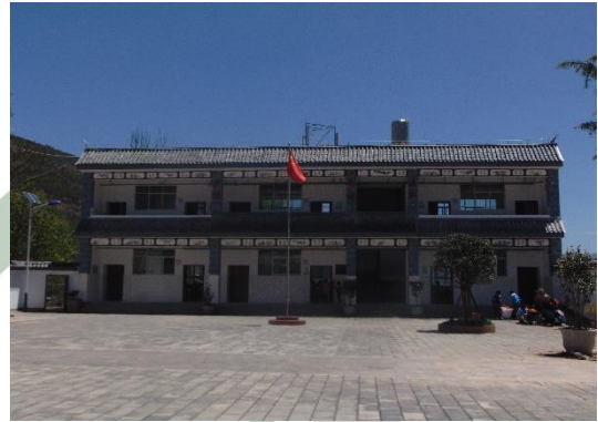
2017年4月28日，黄花完小已验收投入使用