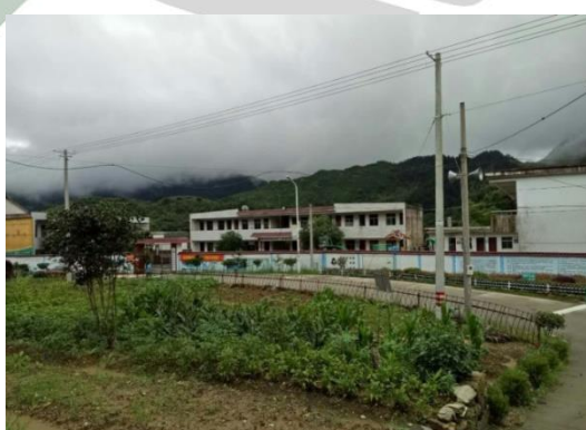
组图：天华镇朱河小学调研现状