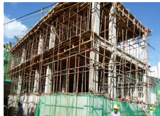
2016年9月19日，正在进行钢筋绑扎及屋面模板安装