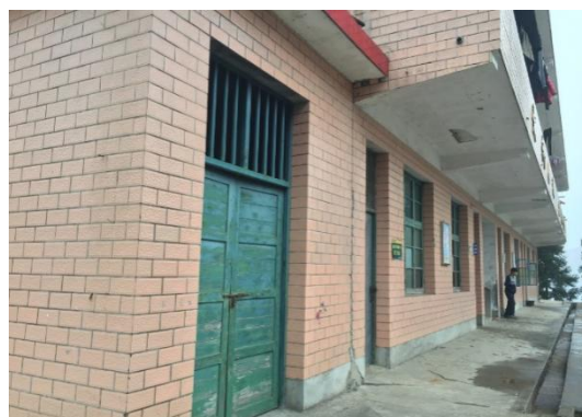
组图：林场中心学校调研现状