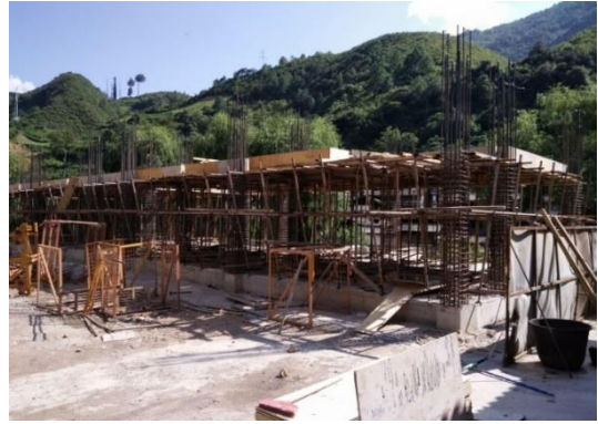
2016年9月底，一层板面混凝土浇筑完成