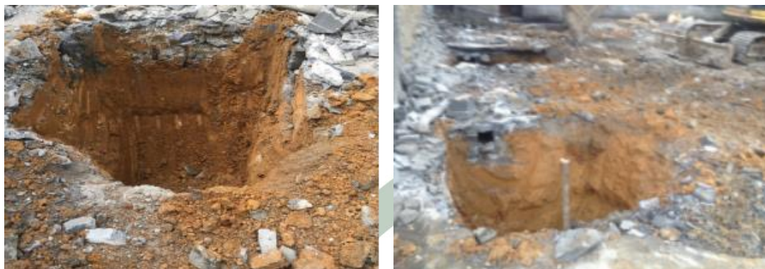
2016 年 9 月底，基础开挖现场照片

碧峰乡中心小学计划新建砖混结构学生宿舍 300 平方米。项目于 2016 年 9 月底开工，后因施工便道瘫痪，项目停工修路，11 月底，项目重新启动；至 12 月 10 日，施工场地平整已经完成，挡墙砌筑过半；截至 2017 年 4 月 28 日，第一层已经修建完成，正在进行第二层砌砖。