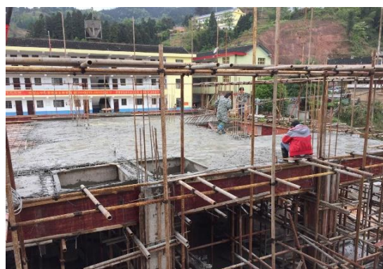
2017年4月28日，宿舍楼二楼修建施工照片