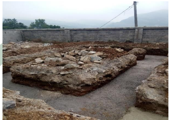
2016年9月，基础垫层浇筑完成