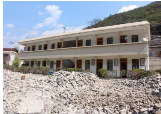
组图：弥沙中心小学现状