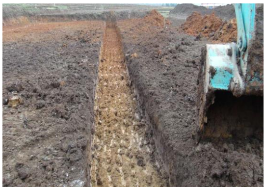
2017年4月19日，基础开挖施工照