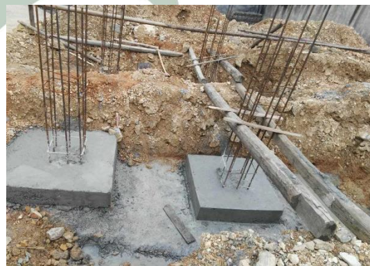
2017年4月28日，基础钢筋施工照片