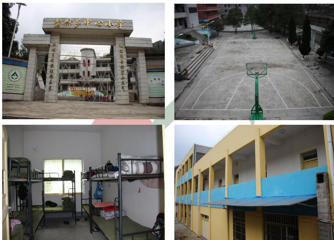
组图：碧峰乡中心小学调研现状

5023 m 2 ，在校学生 505 人，其中女学生 234 人，由于条件限制，现有寄宿学生 173 人，教职工 37 人，目前该校现有学生宿舍 600 平方米，现双人同铺住宿，现有资源不能给学生更好地寄宿。随着移民搬迁的进行，预计将有在校学生 800 人，其中住校生达 400 人。