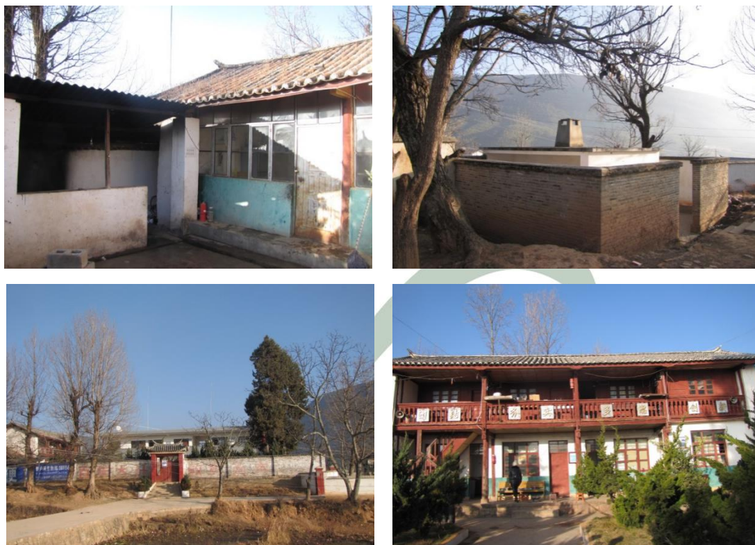
组图：黄花完小学校现状

使用，属于D级危房，40平方米的厕所为砖混结构，2004年建成使用，属B级危房。学校现有一至六年级学生111人，6个教学班，9位专任教师。已全部取得大专及以上学历，一级教师3人，二级教师2人，特岗教师4人。