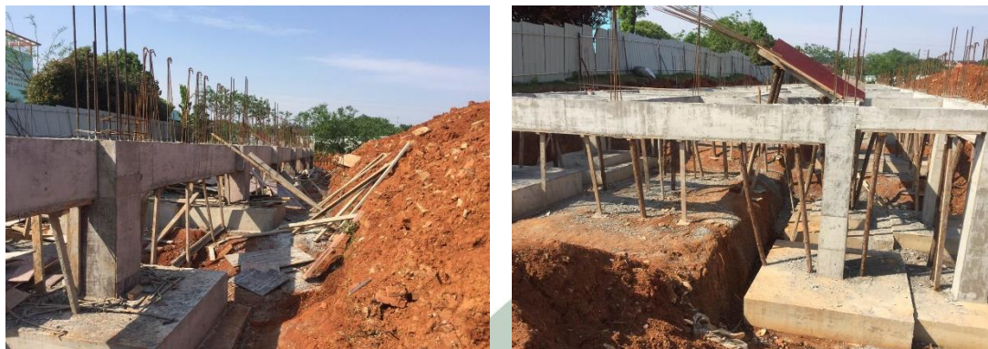
2017 年 4 月 28 日,中洲小学基础桩基混凝土保养

中洲小学计划新建学生综合楼 1500 平方米,项目于 2017 年 2 月底开工;至 4 月 28 日,已完成基础桩基混凝土浇筑,正在保养期,保养结束后立即组织基础验收,验收通过后立即回填并开始主体建设。