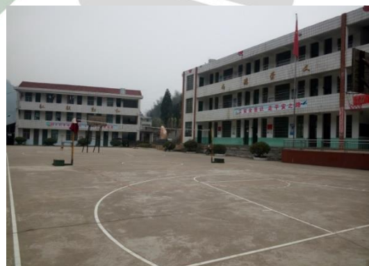
组图：圳上镇株梓学校调研现状