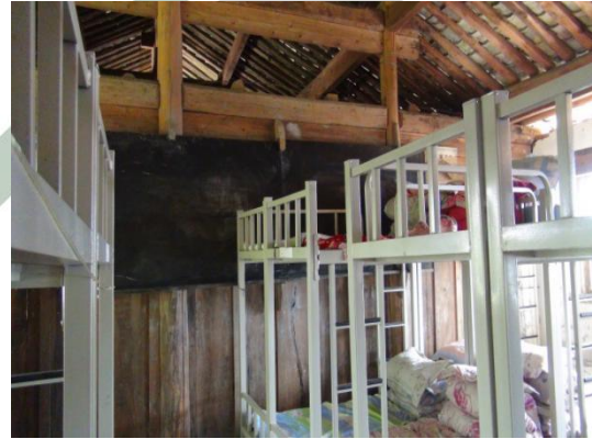
组图：界头镇东华明德小学调研现状