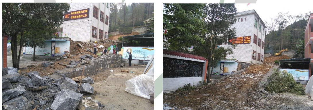
2016 年 11 月底，宿舍楼施工便道施工