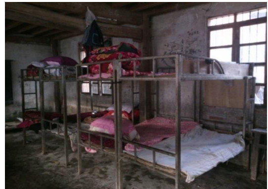
组图：中和镇勐蚌小学调研现状