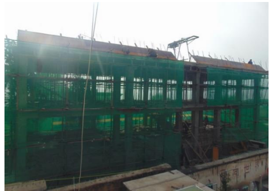
2016年9月29日，屋面模板安装基本完成