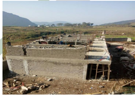
2016年10月底，旦坪学校主体一层建设完成，正在砌砖