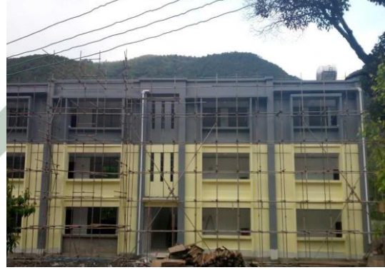
2017年4月28日，弥沙完小内部装修完成，正在屋顶屋架修建