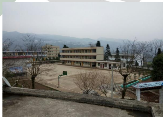
组图：旦坪小学调研现状