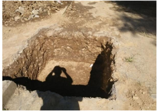
8月底，正在开挖基槽