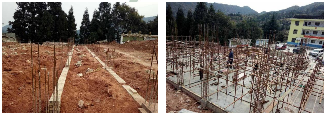
2017 年 2 月,林场中心小学开始施工

项目于 2017 年 2 月底开工;至 4 月 28 日,一层主体建设完成,正在进行二层修建。