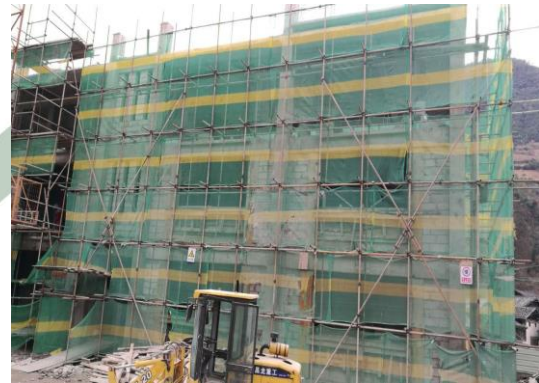
12月10日，弥沙完小宿舍楼主体封顶，正在砌砖