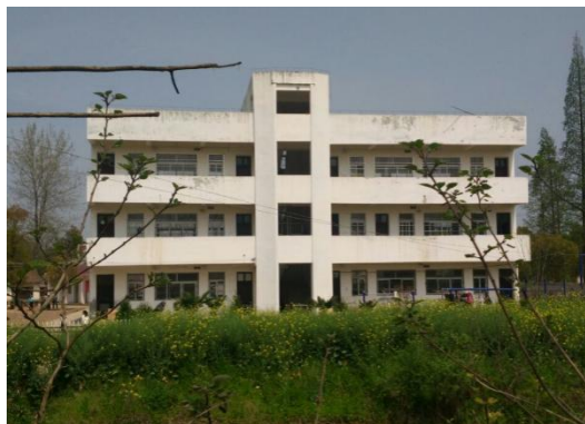
组图：漳湖镇中洲小学调研现状