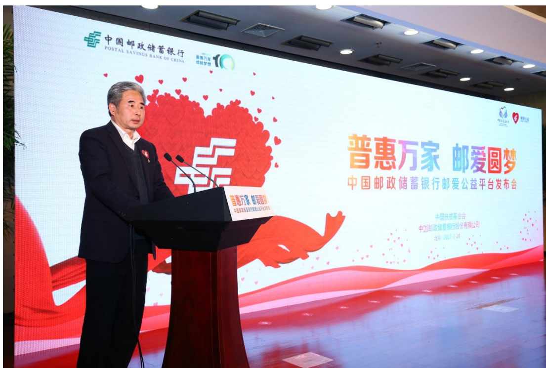
国务院扶贫办巡视员曲天军致辞