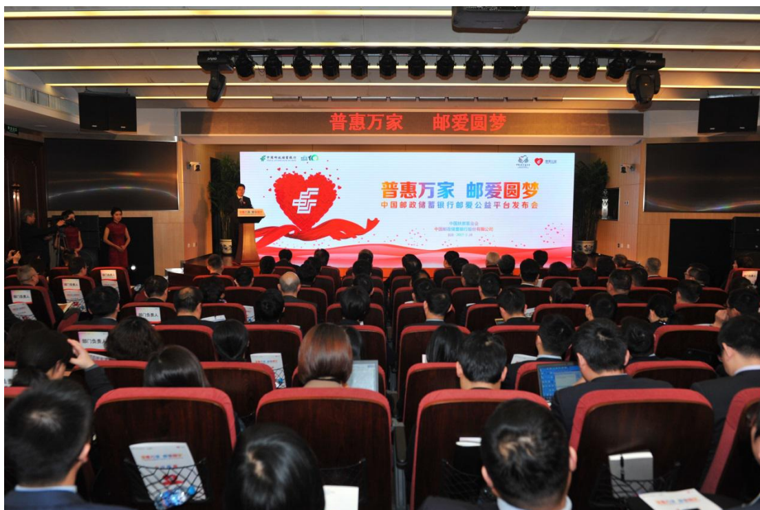
“邮爱公益平台”发布会现场

2) 2017年3月，为了丰富JORDAN展翅飞翔奖学金项目700名受助学生课外知识，更深入帮助受助学生成才，项目负责人为20支公益导师队伍进行成才知识的相关培训。