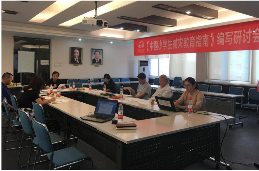
《中国小学生防灾减灾教育指南》一稿修改建议讨论会