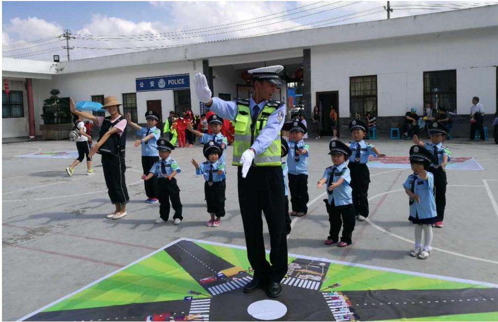
2017 向灾害 SAY NO 活动现场