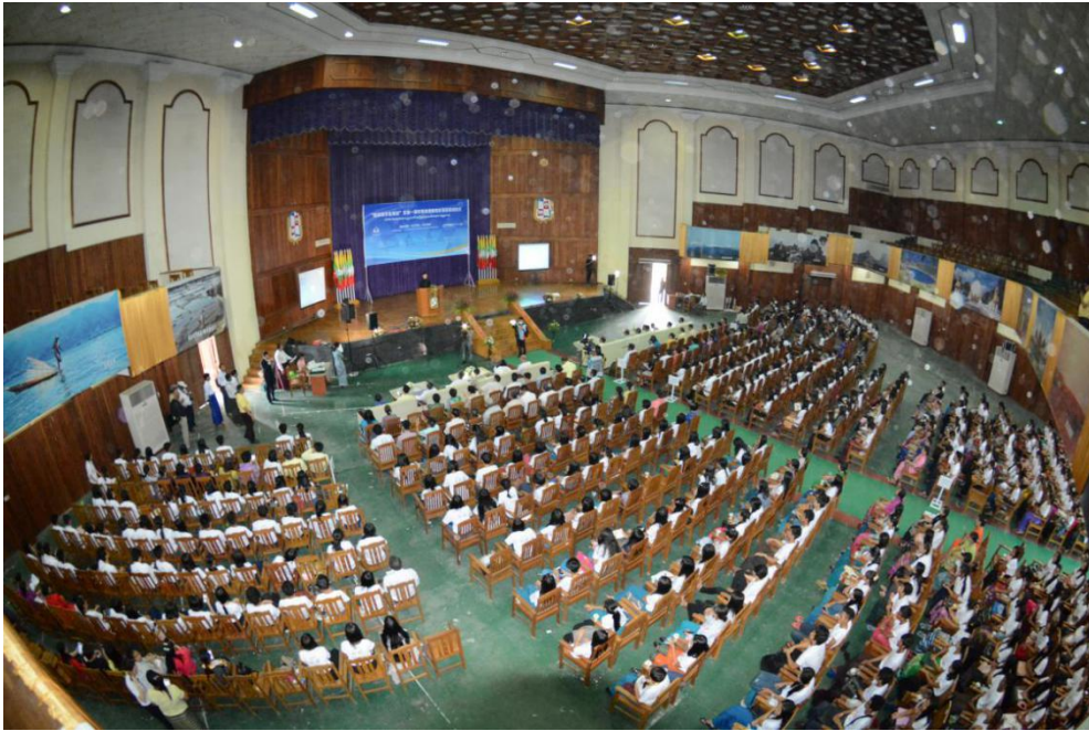
2017年8月10日上午，由中国扶贫基金会主办，阿里巴巴公益基金会资助，主题为“为了学生、为了未来”的庆祝中国扶贫基金会缅甸办公室成立两周年暨“胞波助学金项目”曼德勒启动仪式在缅甸成功举行。共800余人参加了庆祝和启动仪式。