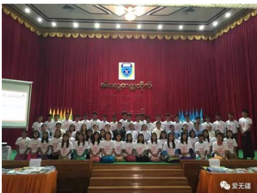
2017 年 3 月 10 日，中国扶贫基金会执行的“中缅民心桥”大学生助学金项目启动仪式在缅甸若开邦实兑市成功举行，为实兑大学、洞鸽大学 100 名学生发放助学金。

缅甸胞波助学金项目 2016 年 8 月在仰光启动，目前项目从最初资助仰光地区 4 所大学 600 名大学生，到今年 3 月扩展至若开邦的两所大学 100 名大学生，8 月走进曼德勒，资助 6 所院校的 500 名大学生，使得项目资助大学生总数达到 1300 余人。