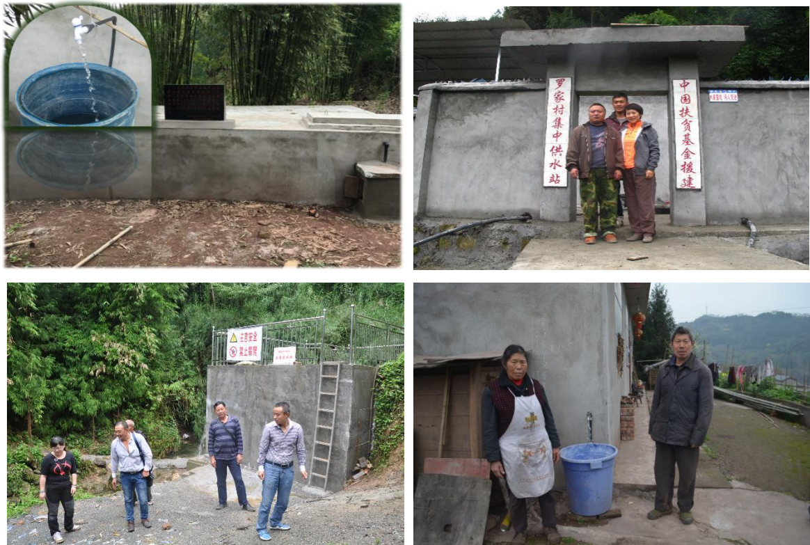
组图五：人畜饮水项目

我会在宝兴县、天全县、芦山县、汉源县、石棉县等地建设 20 个人畜饮水项目，受益村民 27864 人。