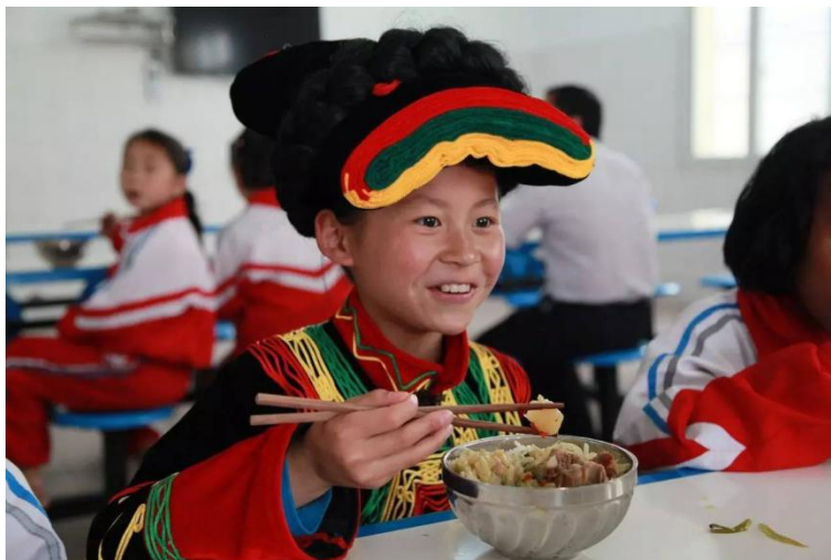
图一：爱心厨房项目

中国扶贫基金会以在雅安实施“爱心厨房”项目，资金投入共计 714.94 万元，在雅安地区的汉源县、雨城区 48 所学校为 1.53 万学生提供爱心厨房设备，保证这些学校的学生能够享有营养、可口的热餐。2017 年第二季度，在四川省汉源县援建 2 个爱心厨房，项目正在执行。