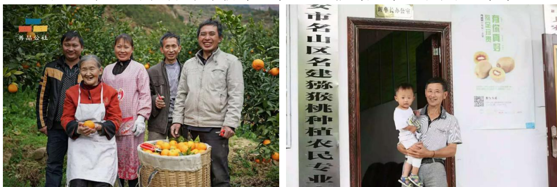
组图四：电商扶贫项目