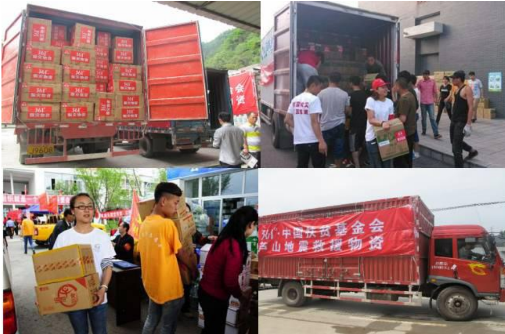
组图一：紧急救援项目物资发放现场

份：大米、油）、棉被凉被等（14510 条）、帐篷（410 顶）、彩条布（768240 平米）等，发往芦山县、宝兴县、天全县、雅安市雨城区、汉源县、石棉县等 6 个受灾县区。