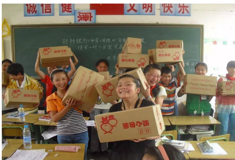
图五：爱心包裹发放现场

我会向芦山县、宝兴县、天全县三个重灾县 11870 名小学生发放了 11870 个学生型美术包和 10050 个学生型生活包；向芦山县、宝兴县的 9 所学校发放 27 个学校型体育包和 14 个学校型音乐包；向芦山县、宝兴县、天全县的 6000 名教师发放了灾区教师关爱包。