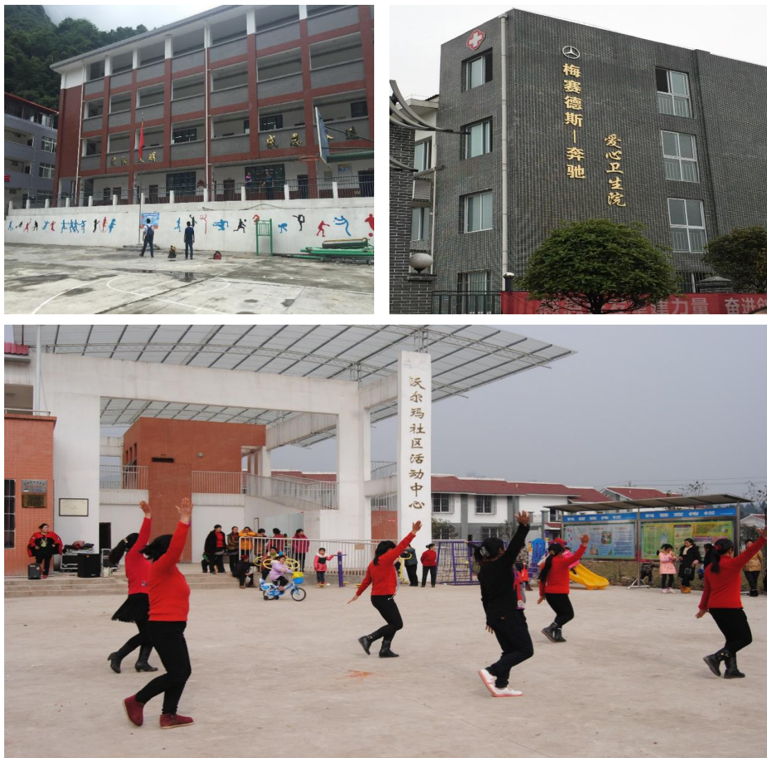
组图三：社区发展类项目，学校（左上）、卫生院（右上）、活动中心（下）

在汉源县、名山区、石棉县实施电商扶贫项目，开展车厘子、猕猴桃、黄果柑推广活动并实现交易额 3829.65 万元，为种植农户人均直接增收 700 元，总体上，通过合作社组织培育、生产资料补贴及产品营销推广等方式累计支持受益农户约 1 万人。