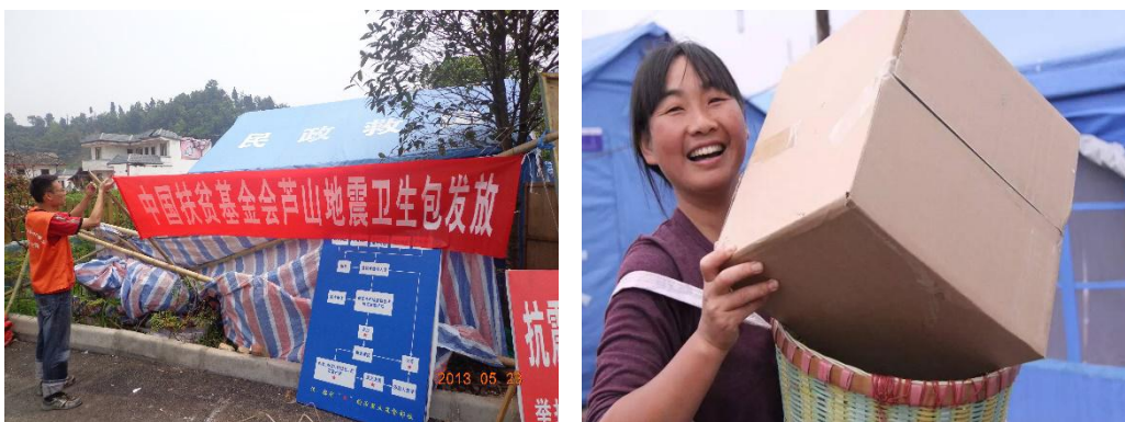
组图九：卫生包领取

芦山地震发生后，为防止疾病发生于传染，我会向雅安市天全县、芦山县、宝兴县和雨城区采购并发放 26087 个卫生包。