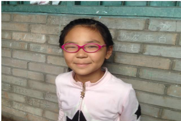
图二：助明计划项目

项目为雅安市宝兴县、汉源县、芦山县和雨城区的妇幼保健院提供小儿眼科检查设备，对以上4县区3-7岁儿童进行视力筛查、并对筛查出眼疾的儿童进行配镜、矫正及手术补贴；同时在当地开展验光师培训和小儿眼科疾病相关知识培训。