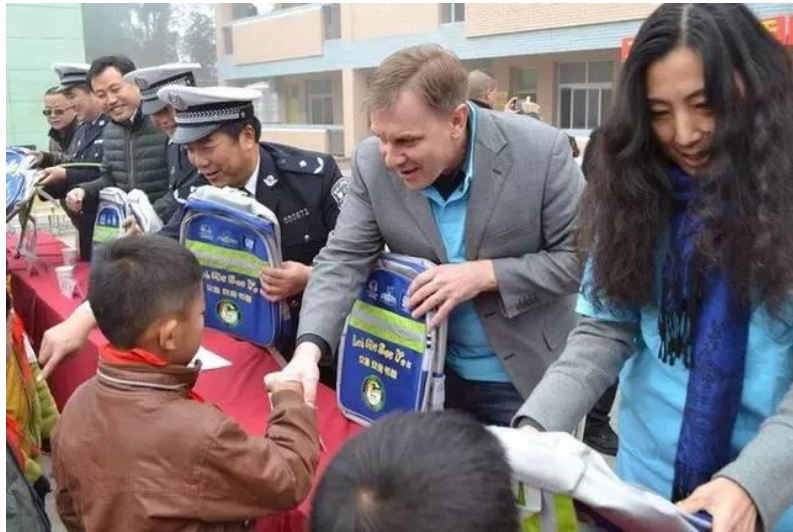
图六：安全书包发放现场

我会在天全县 15 所学校、芦山县 13 所学校、名山区 3 所学校发放交通安全书包，受益学生 1.5 万人。