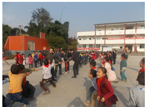
组图十：加油计划活动现场