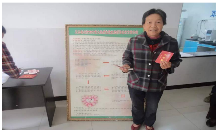
图三：天全县妇女大病项目

妇女大病项目于2013年5月在天全县开始实施，并于2014年6月实施完毕。项目为雅安市天全县符合救助条件的患重大疾病农村妇女提供现金补助，项目累计救助150名天全农村身患大病的妇女。