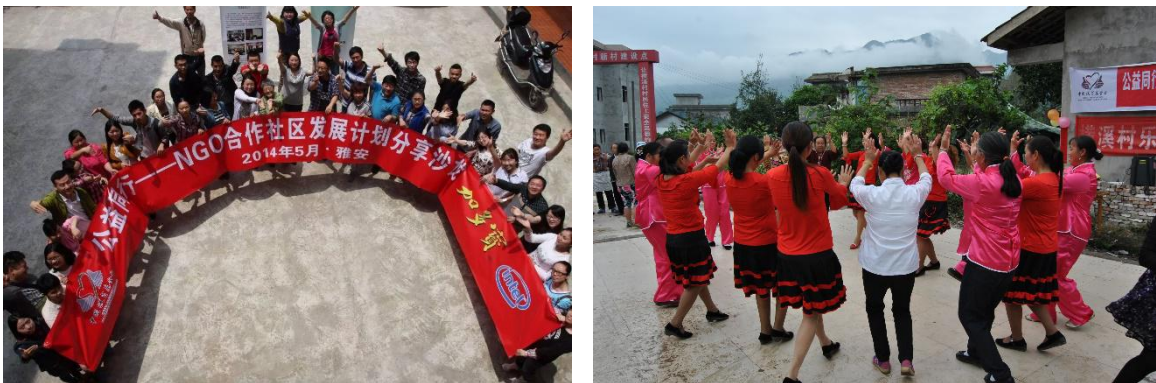
组图八：公益同行—NGO合作社区发展计划分享沙龙

2013年芦山地震后,我会支持13家NGO针对灾后过渡安置开展社区陪伴项目，缓解受灾人群紧张情绪，恢复社区关系和社区正常生活。2014年开始，从社区项目支持、社区成长陪伴、社区人才培养三个层面系统性支持16家NGO从生计发展、社区服务两个领域，激发社区活力，推动社区发展。2016年芦山公益同行进入项目实施的第三个周期，我会进一步优化项目模型，以项目支持为核心，资助9个项目，进行日常监测、月度督导等工作，项目已全部执行完成。