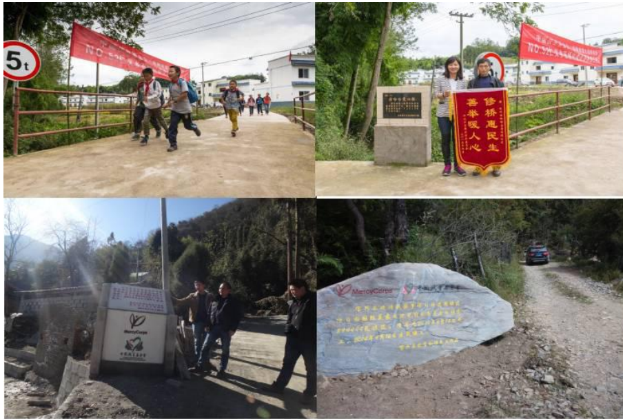
组图六：小微基础设施项目照片