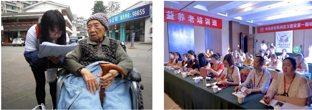
组图七：养老项目调研及培训