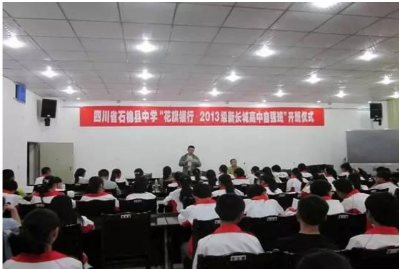
图四：高中生自强班开班仪式

我会在四川省名山中学、石棉中学建立两个“花旗银行·新长城自强班”，每班 68 名，共 136 名贫困学生。本项目对 136 名贫困学校进行连续三年的资助。