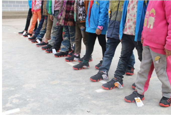
图七：买一善一项目鞋子发放

者每购买一件 361° 指定的公益专款鞋,就同步以消费者名义向受捐赠的贫困小学生捐出一双适合其尺码的鞋子。我会通过买一善一项目向芦山县芦山初级中学、国张中学共 2075 名中学生发放鞋子。