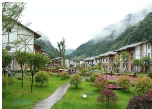
组图二：美丽乡村项目雪山村（左）、邓池沟（右）