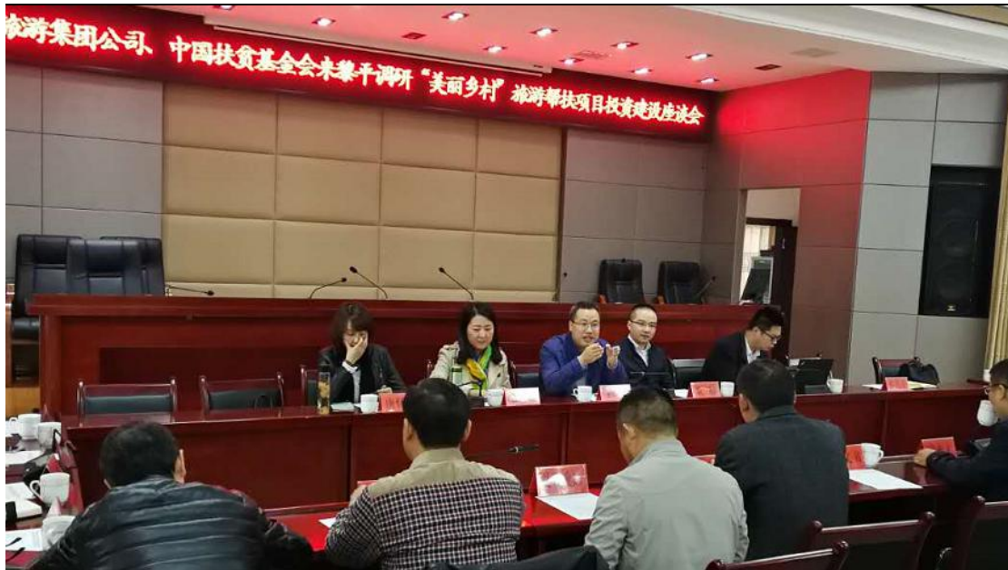
召开项目启动座谈会