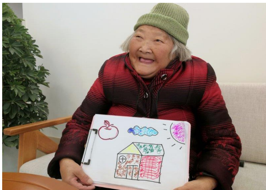
图为雅安中扶养老服务中心-首批入住公益老人