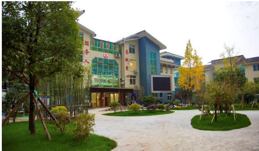
图为雅安中扶养老服务中心-园林景观