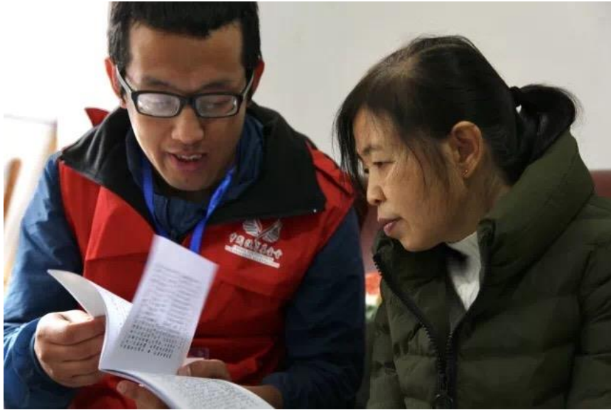
图为雅安中扶养老服务中心-社区服务