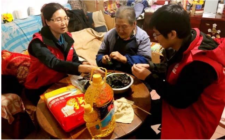
图为雅安中扶养老服务中心-社区服务