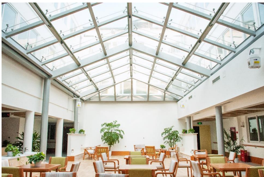
图为雅安中扶养老服务中心-装修实景