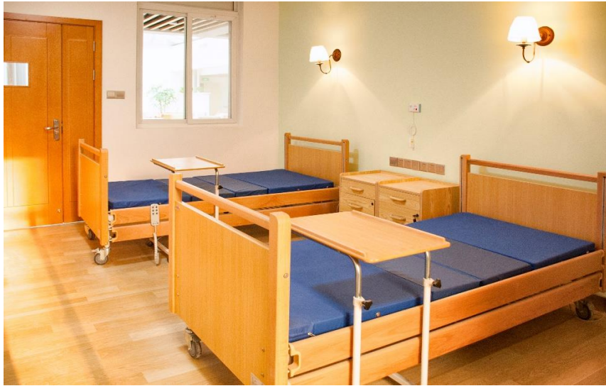
图为雅安中扶养老服务中心-装修实景