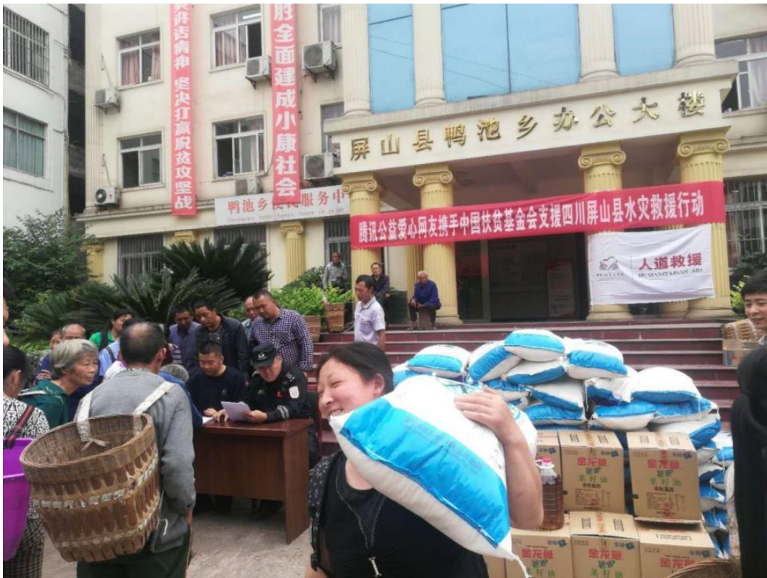
受灾农户领取救灾物资

5月21日，四川省宜宾市遭遇暴雨天气，屏山县书楼镇9000余人受灾；因灾转移群众176人。屏山县鸭池乡16个村4860人受灾，因灾转移群众41人。中国扶贫基金会人道救援网络成员攀枝花援助少年儿童志愿者协会紧急启动灾害救援响应，支出资金3.47万元，发放100份粮油，惠及100户400人次。