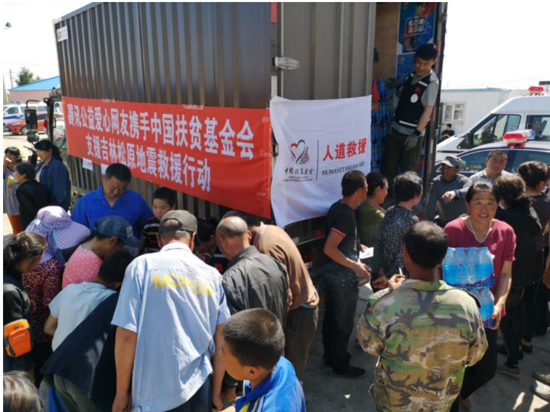
受灾农户领取救灾物资