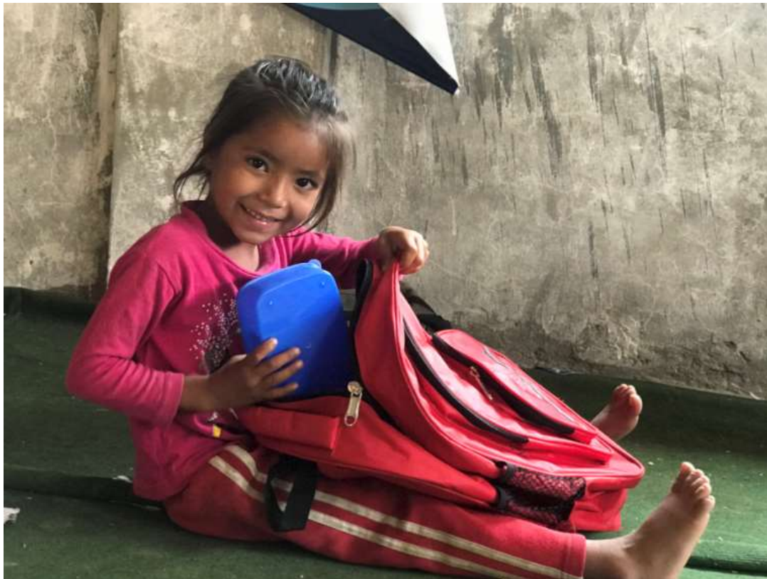
尼泊尔爱心书包发放

尼泊尔国别办公室还对青年培训项目进行了调研及筹资，已经完成项目调研报告及资报告，在秘书处立项，起草操作手册，准备 10 月启动项目。