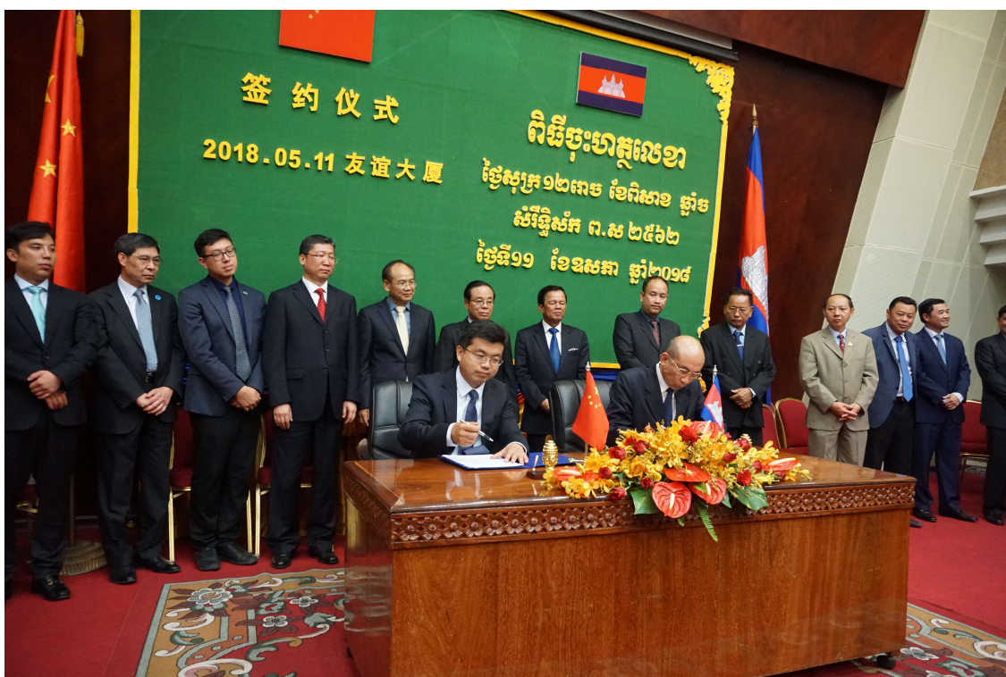
中柬民间组织民生交流合作项目签约仪式