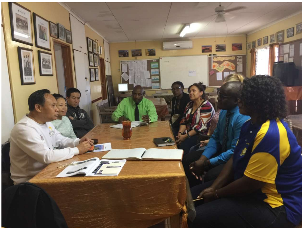
4月20日上午，温得和克纳米比亚小学调研需求