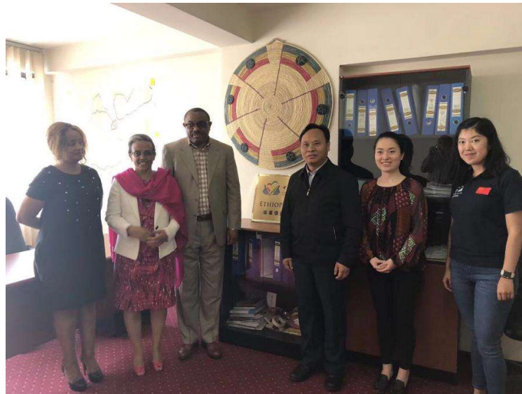
中国扶贫基金会王行最执行副会长与埃塞前总理海尔马利亚姆

埃塞目前正在经历 50 年内最大的干旱，中国扶贫基金会和徐工集团针对当地需求，将中国西南地区的水窖技术引入埃塞，为当地修建了 80 口水窖。2018 年上半年，第二批 40 口水窖已经启动。目前这个项目仍然在继续。