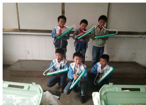
图 2|领到音乐包的学生