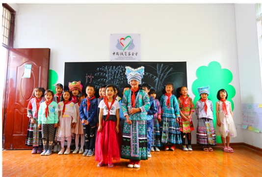
图一| 学生们盛装欢迎捐赠人到来