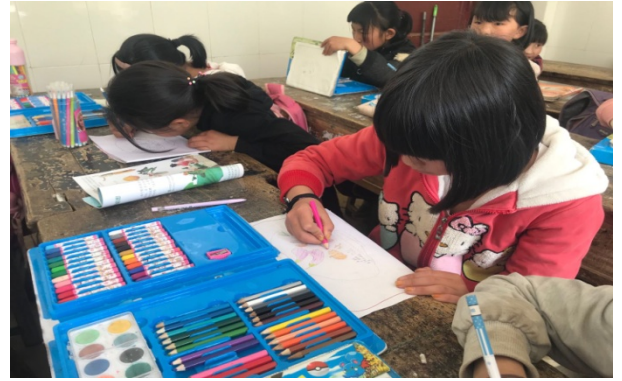
图 2|镇雄县孩子用美术包里的彩笔画“果盘”