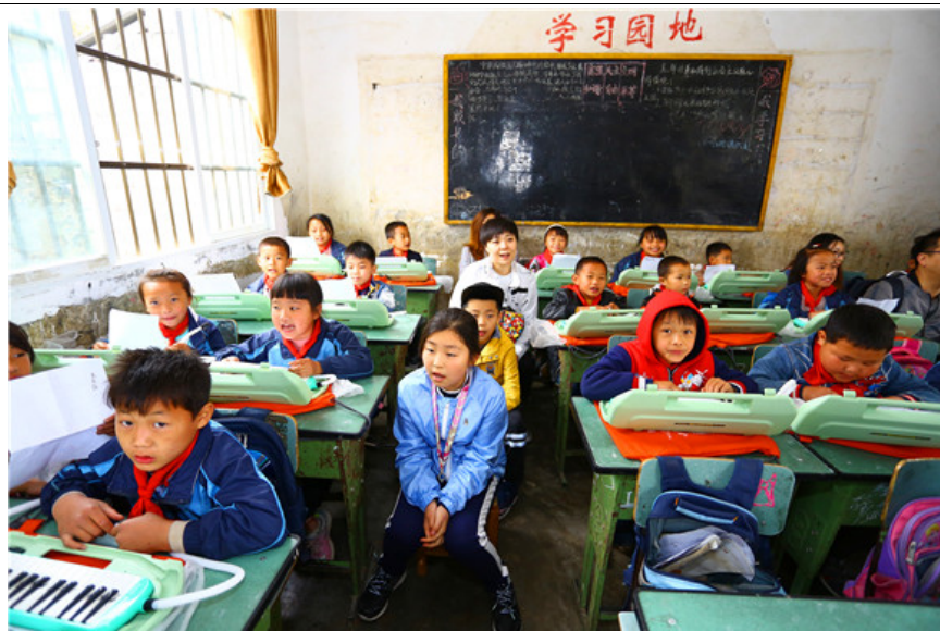
捐赠人与学生一同上音乐课，口风琴为加油计划配发