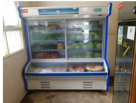
图 2|发放的保鲜柜已经投入使用