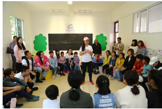
图 2| 陇东小学未来空间