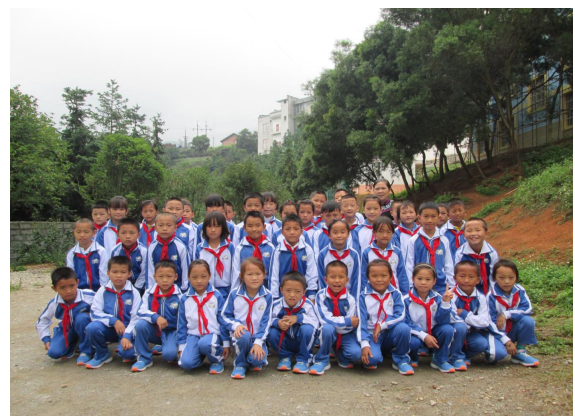
图1 |保上小学的老师给孩子们发体育包