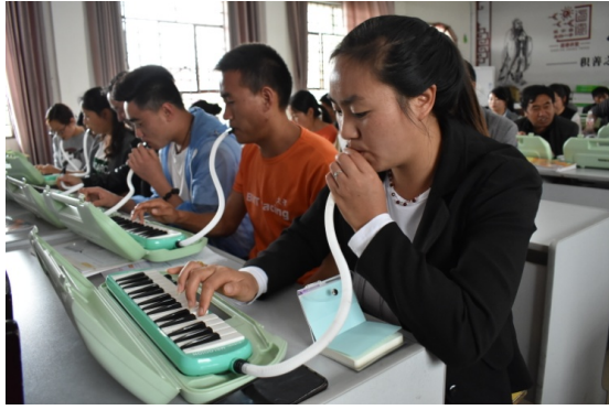
图 1|威宁县音乐教师培训