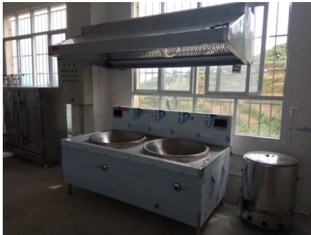
图 1|给学校发放的“大锅灶”

2018年6月底，镇雄县为茶园小学、串九小学、后槽小学、菜子小学、茶卓小学、官庄小学、庙坪小学、青杠坪小学、大河小学共计9所学校发放的厨房设备，学校已经投入了使用，学校告别了简陋，做菜速度慢的时代，孩子们能够吃到卫生，热腾腾的饭菜了。