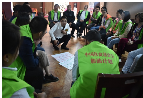
图2 |威宁县加油课培训