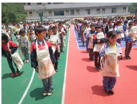
图 1 |音乐包发放

威宁县于本季度6月22日分别为么站小学、小米小学、五嘎小学、新发小学、红岩小学、天龙小学、蛇街小学、出水小学、玉屏小学、松发小学、花园小学、二田小学、双河培才小学、元林小学、院箐小学共计13个乡镇的15所项目学校4414名学生发放了他们期待已久的音乐包。相信音乐包的发放会极大的丰富孩子们的课余生活，让每一个孩子都有成为小音乐家的希望。