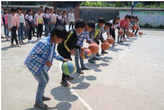
图 3|隆林县孩子们体育课练习拍打