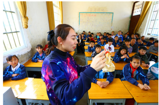
图二| 捐赠人为学生准备了手工课