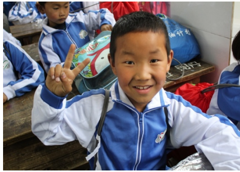
图1 |孩子收到体育包