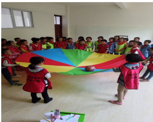
图1| 镇雄县孩子们在“未来空间”教室玩彩虹伞抛球