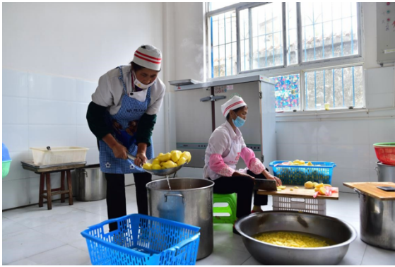
图 1| 平山小学爱心厨房