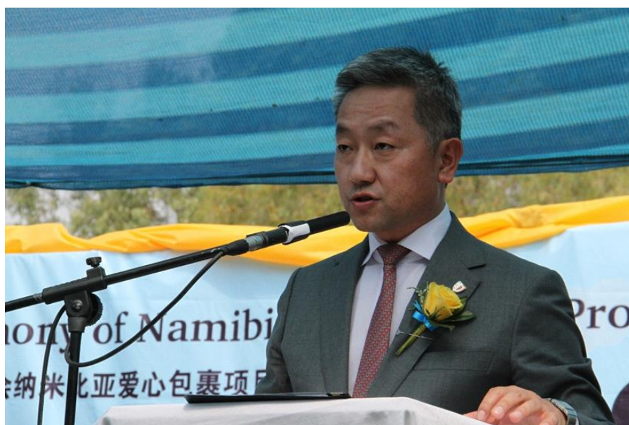
中国驻纳米比亚大使馆在启动仪式上致辞

2018 年 9 月，中国扶贫基金会在纳米比亚西部和中部共计五所小学发放了超过 5000 个爱心包裹，有超过 5000 名贫困地区小学生受益。