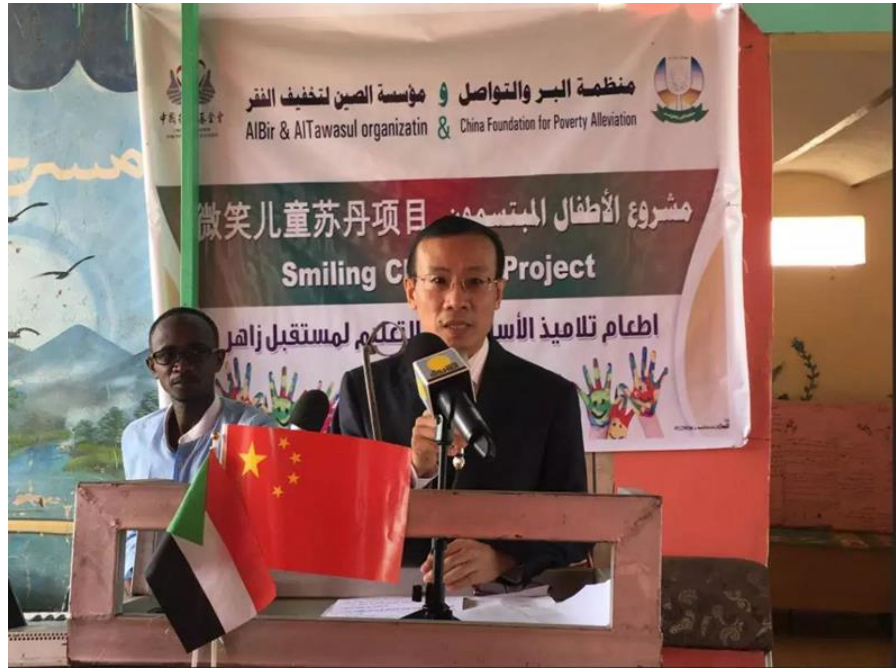
中国驻苏丹大使李连和致辞