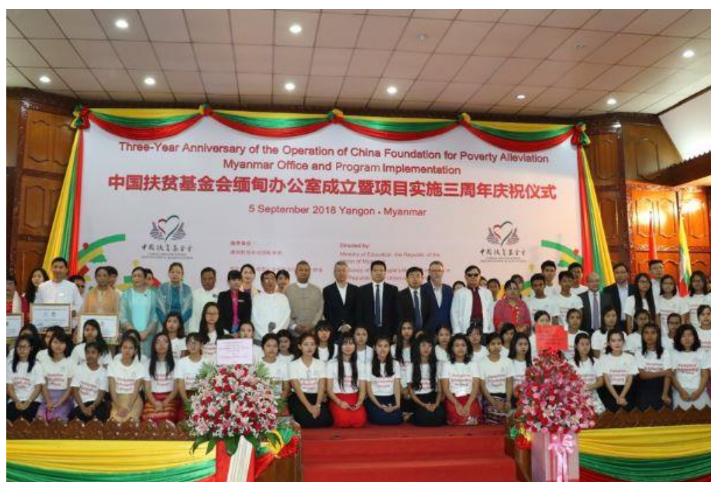
缅甸三周年仪式大合影

(4) 在缅甸多省邦继续执行“爱心包裹项目”，现已完成 5000 个包裹的当地采购、生产、组装、运输、发放工作；