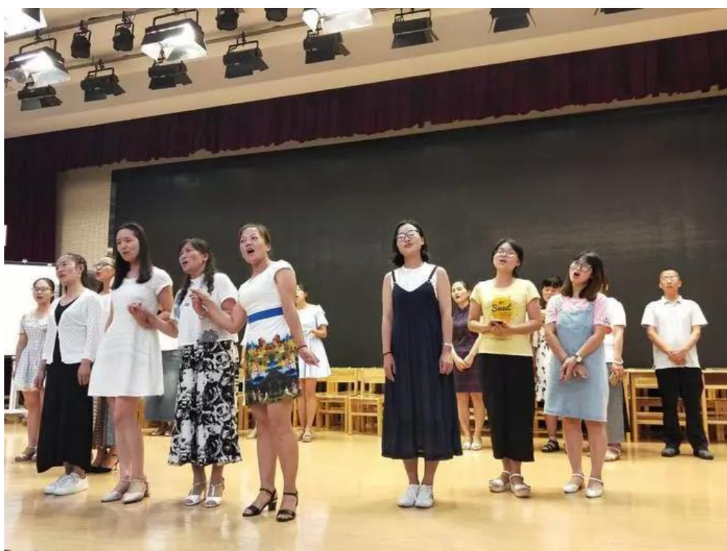
「 节目汇演晚会 」

更不可能、让人想象不到的是节目汇演的时候，那些“高材生”们的作品展示。以前觉得自己算得上是个偏倚的“文艺青年”，因为自己或多或少还是常常“登台演出”。可是在这里千万不能这样说，因为绝对会让你觉得你什么都不是，所以最好把机会留给能行的人，你负责参与和学习就行。