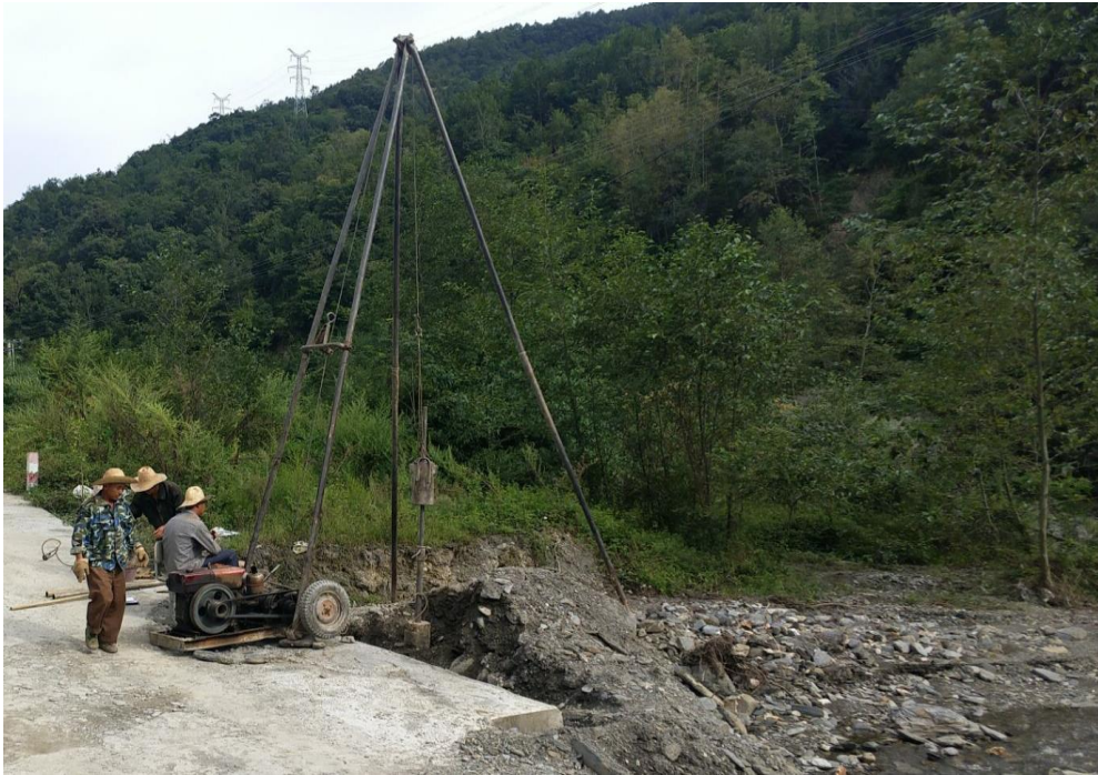
图 6 溪桥地勘现场

地区援建 14 座溪桥。其中，广发证券在平武县援助的 2 座溪桥已完工，正在竣工结项；湘财证券在平武县的 10 座溪桥已完成选址、图纸设计以及预算编制等工作，正在通过比选方式确定施工企业，计划 10 月份开工建设；山西证券在平武县援助的 2 座溪桥已完成选址工作，正在做地勘及图纸设计，计划 10 月份开工建设。