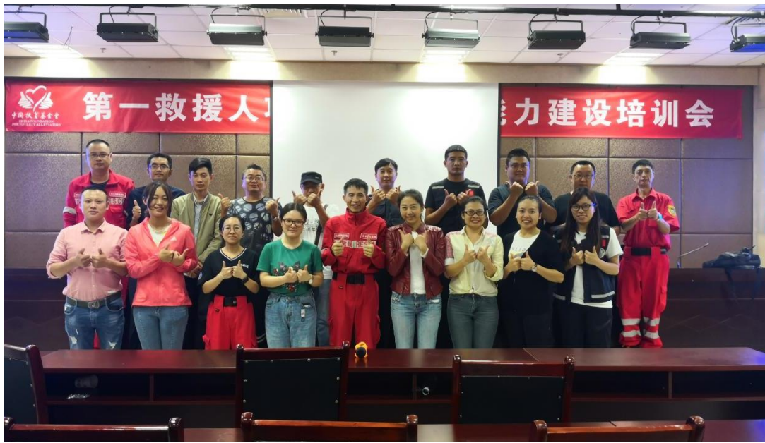
第一救援人项目执行机构能力建设培训会