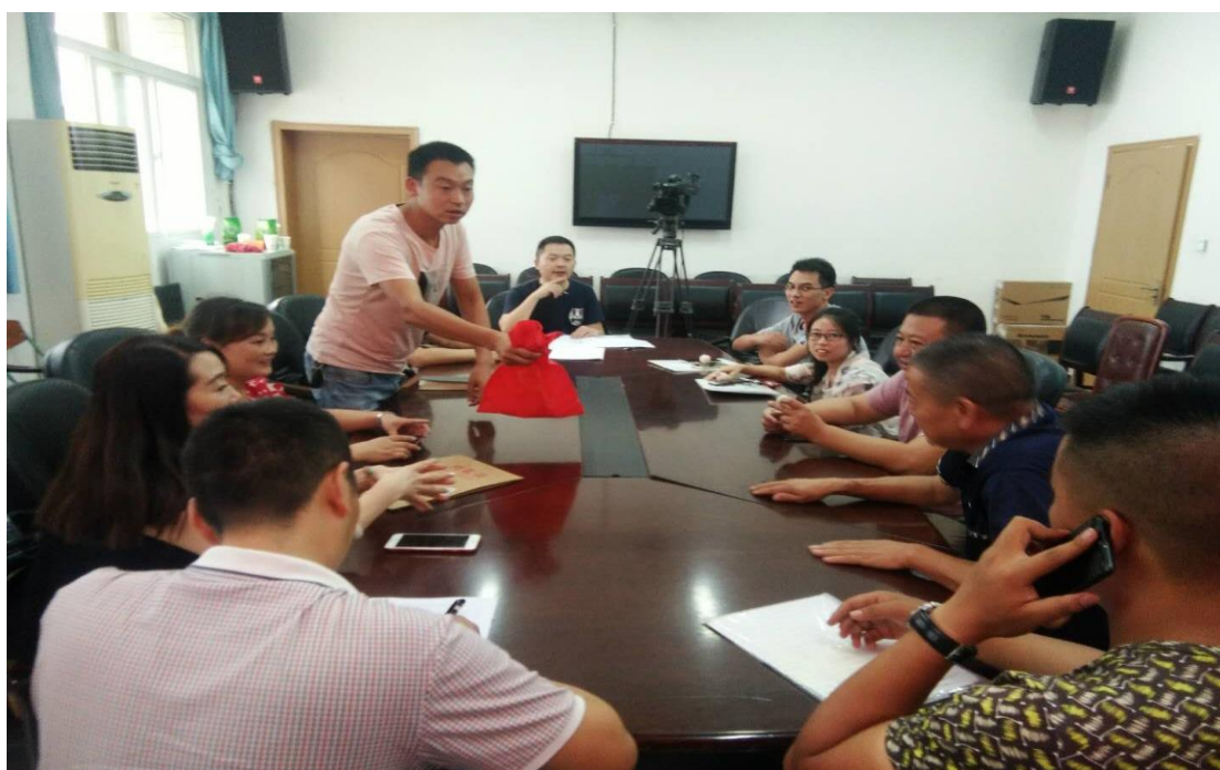
图 5 平武县水晶幼儿园公开招标随机抽取现场会