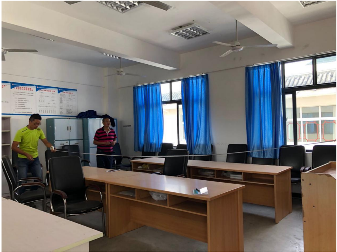
项目组人员和供应商赴项目学校开展实地调研和测量