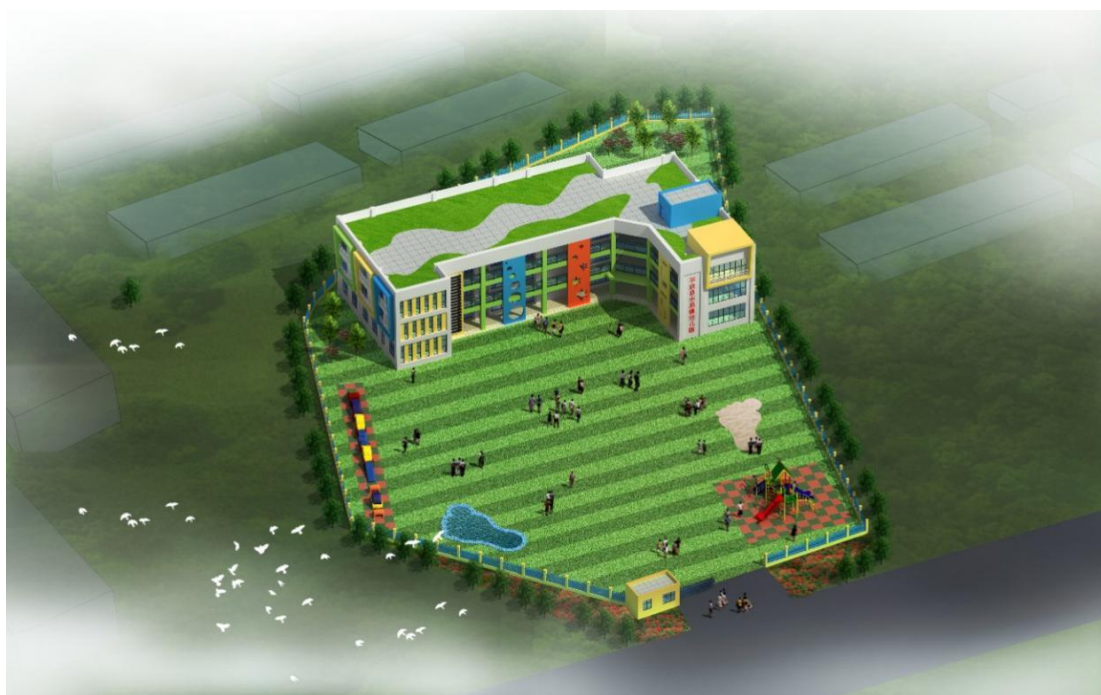
图 4 幼儿园设计方案图