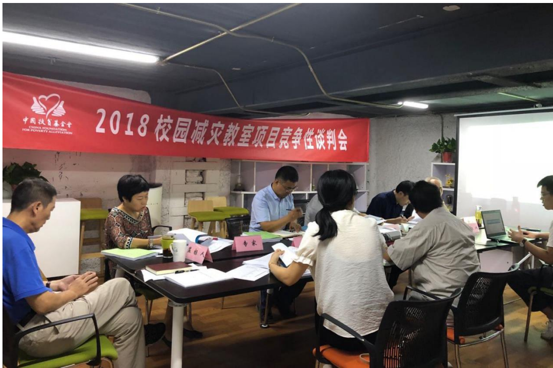
2018 校园减灾教室项目竞争性谈判会

9月18日至29日，项目组工作人员和北京森霖木教育科技有限公司工作人员共同赴茂县、九寨沟、平武对12所项目学校教室进行实地调研和测量，根据测量情况绘制《中国扶贫基金会校园减灾教室项目测量报告》，并对每个学校提出整改意见。