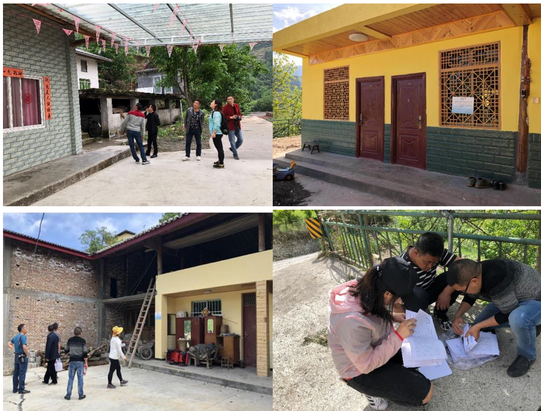
图 3 农房改造验收

截至目前，九寨沟县受益农户农房改造工作已全部完成，7月完成九寨沟县农房改造项目第一批共计95户的材料收集和款项拨付，拨付资金1310000元；8月完成九寨沟县农房改造项目第二批共计106户的材料收集和款项拨付，拨付资金1052860.22元。