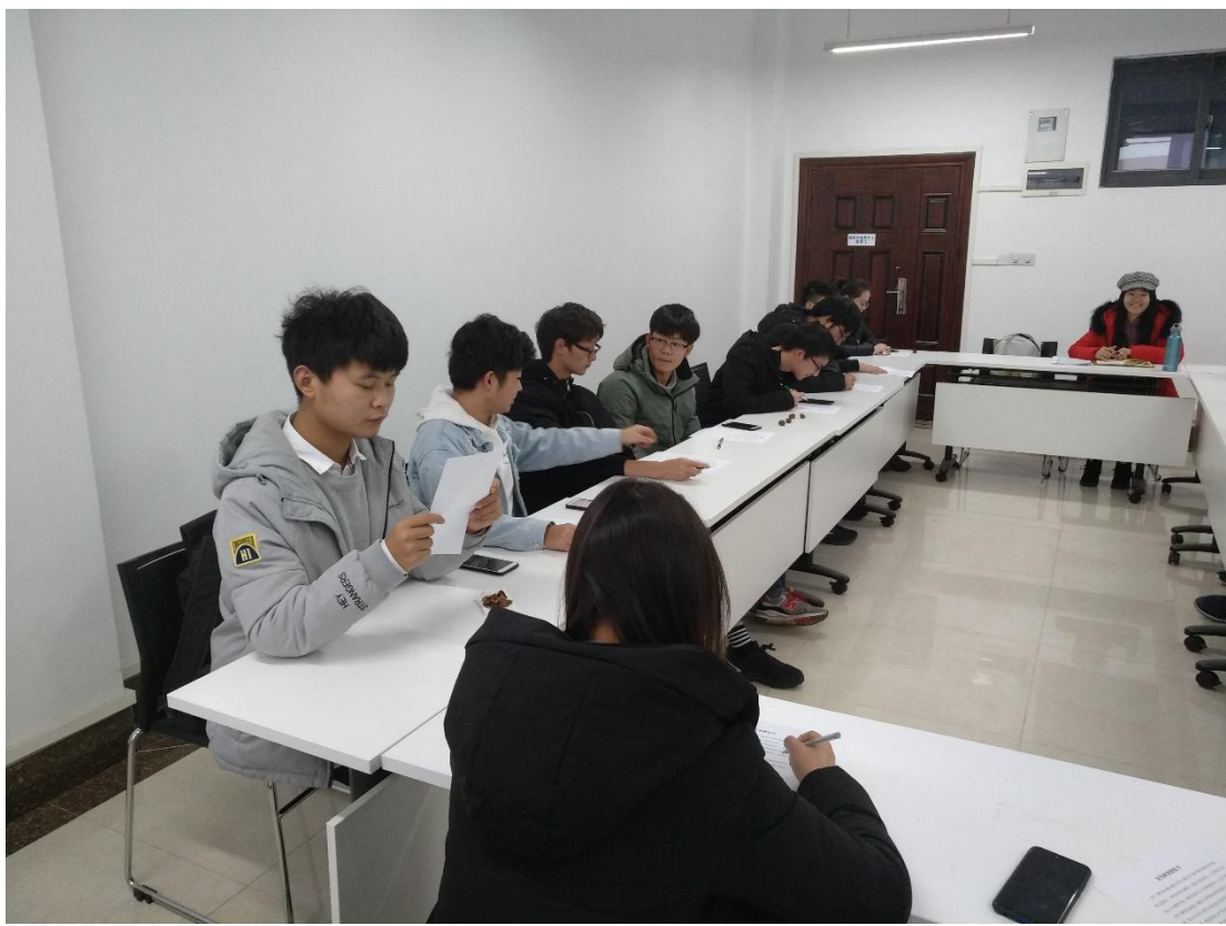
图 2：项目人员与武汉科技大学部分受益学生座谈