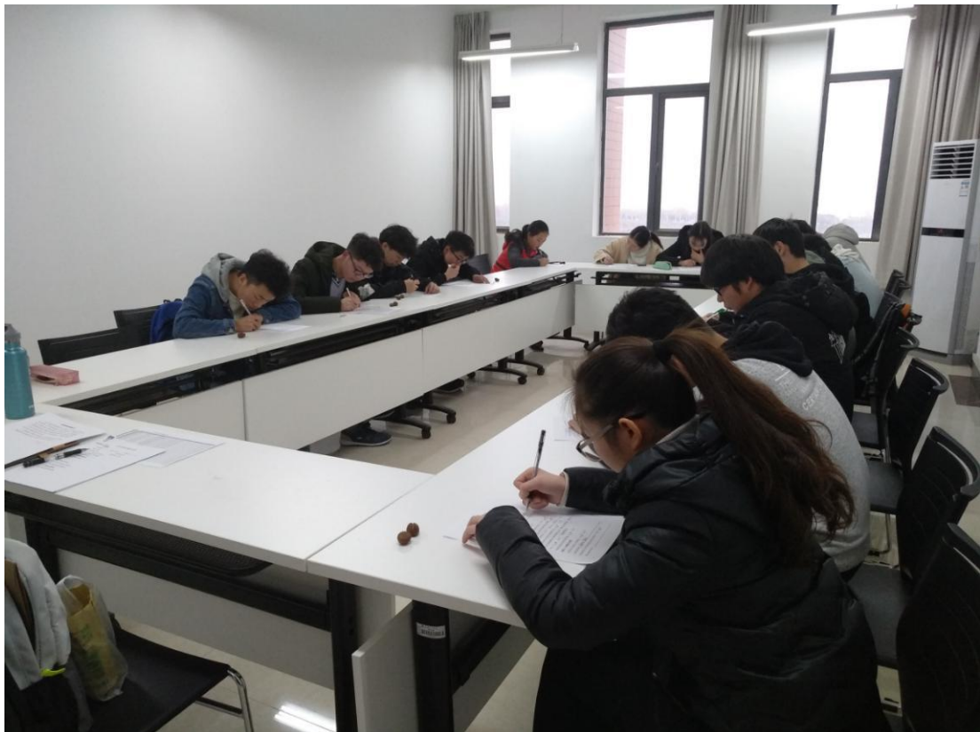
图 3：武汉科技大学受益学生现场填写《受益学生调查表》