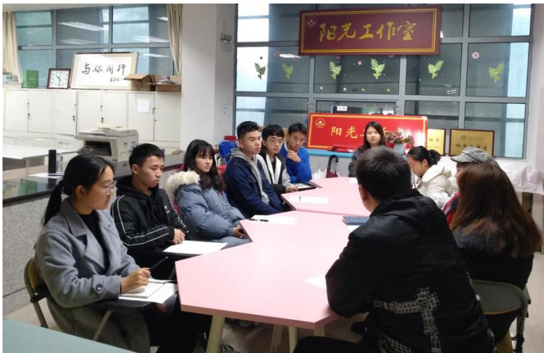
图 1：项目人员与中南民族大学老师及部分受益学生座谈