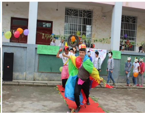
图 1 镇雄夏令营中城乡孩子上山游玩 图 2 在小洛小学开展主题时装秀