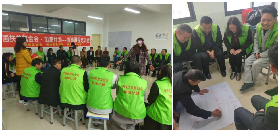
参加加油课程培训的老师