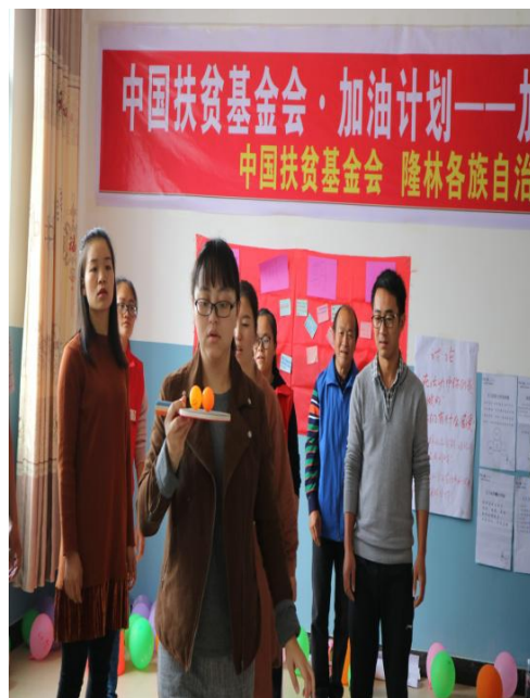
参加加油课程培训的老师们