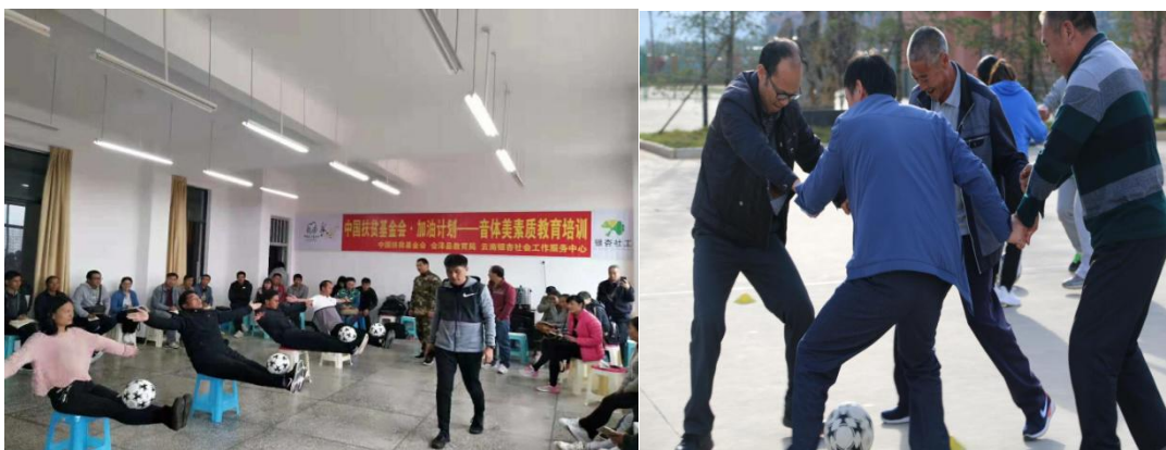
参加体育培训的老师们