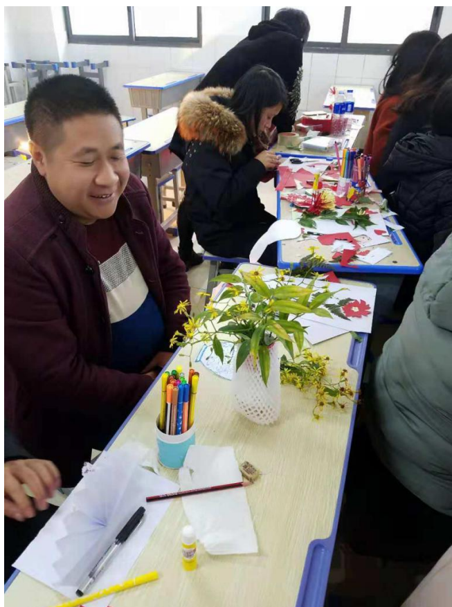
参加美术培训的老师们

2018年7月22日-8月6日，由中国扶贫基金会资助主办、镇雄县教育局、为乐公益协办的第九届“加油！乡村夏令营——城乡互动营”在镇雄县开展了两期营会活动，第一期营会为乡村夏令营，于7月22日至7月28日在瓦房小学、放马坝小学、小洛小学、盐井小学、苏木小学五所学校开展。共有25个大学生志愿者和240个乡村孩子参加。第二期营会中的乡村夏令营于7月31日至8月6日在瓦房小学、放马坝小学、小洛小学、盐井小学四所学校开展；同期的城乡夏令营在小洛小学开展，有7位城市孩子来到学校，和乡村的30位孩子一起在小洛小学体验了7天的城乡夏令营活动。