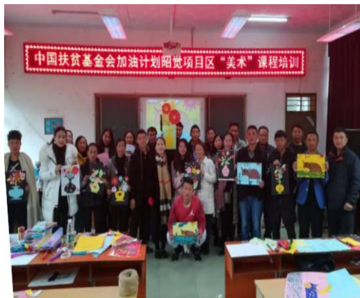
参加美术培训的老师們