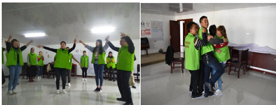
参加加油课程培训的老师