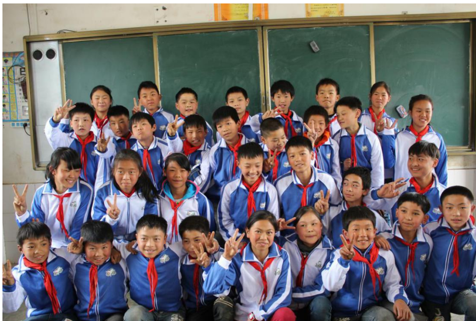
领到体育包的孩子们