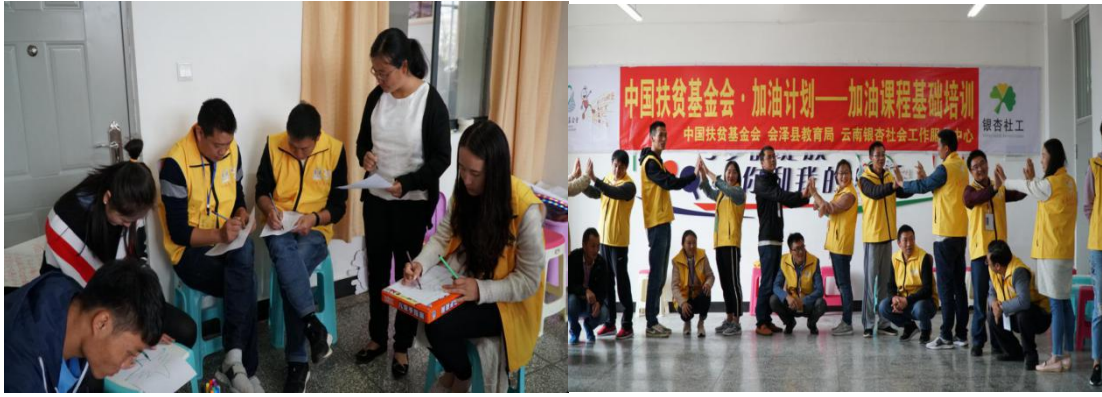
参加加油课程培训的老师们