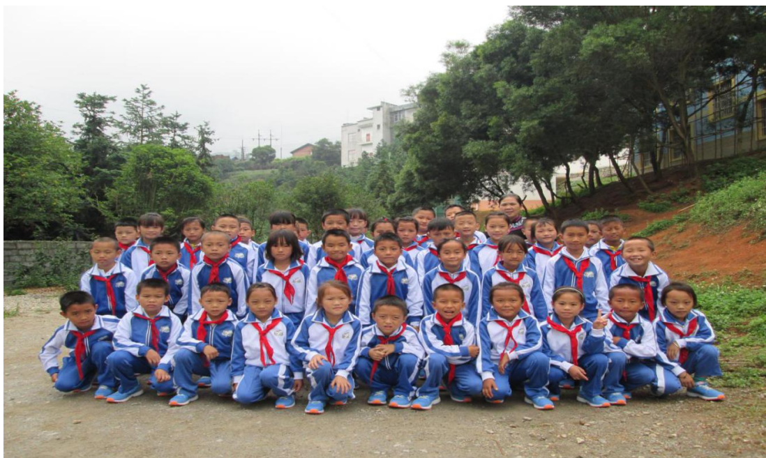
领到体育包的孩子们