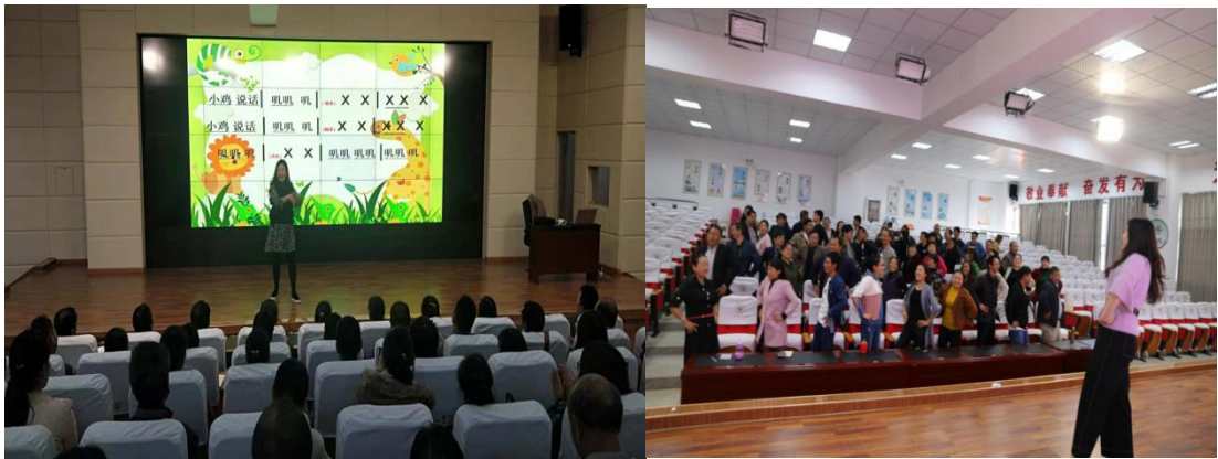
参加音乐培训的老师们