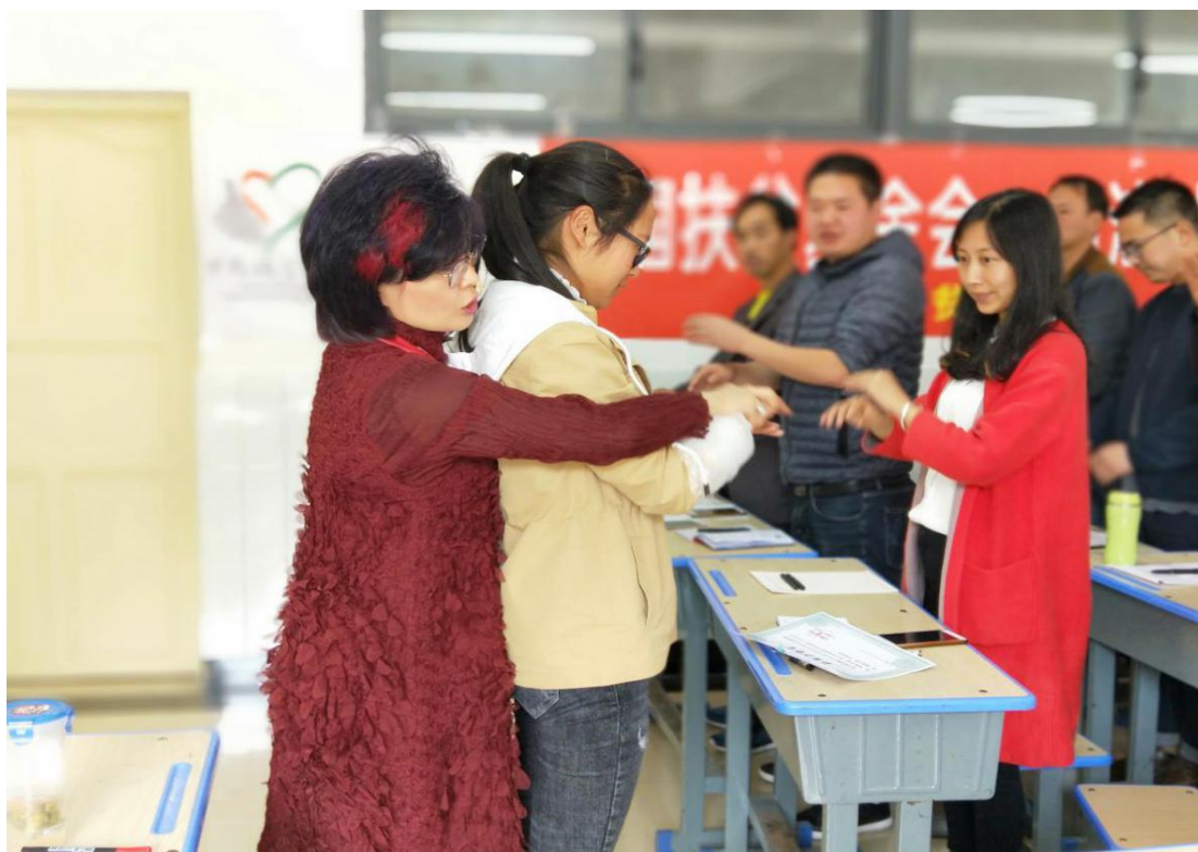
参加音乐培训的老师们