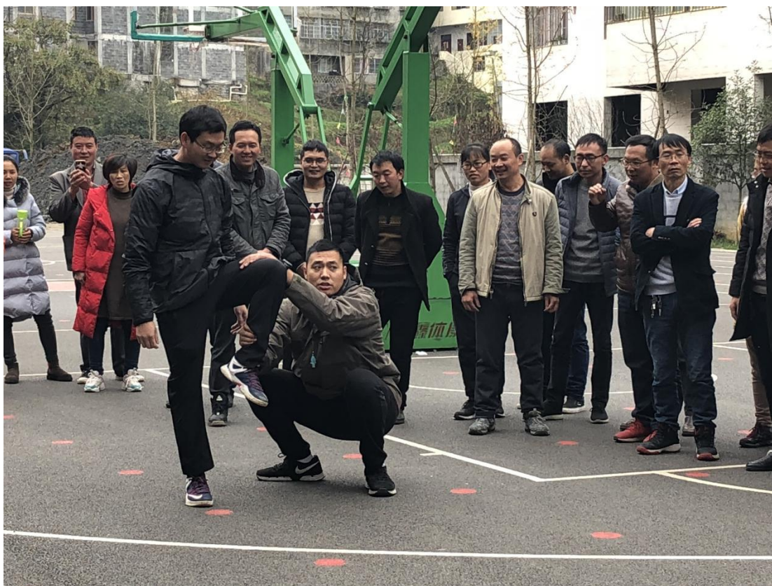
参加体育培训的老师们