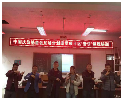
参加音乐培训的老师们