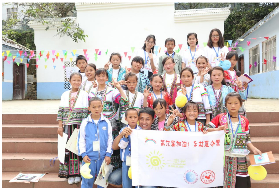
乡村夏令营在新民小学举行