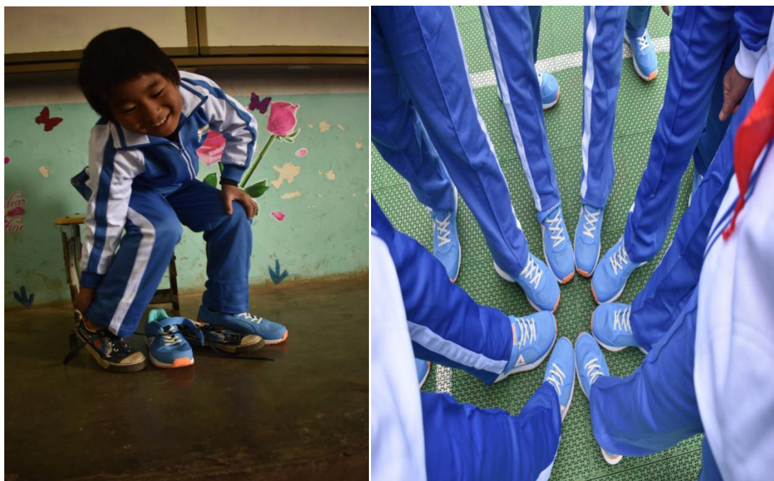
领到体育包的孩子们