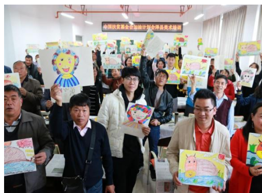
参加美术培训的老师們