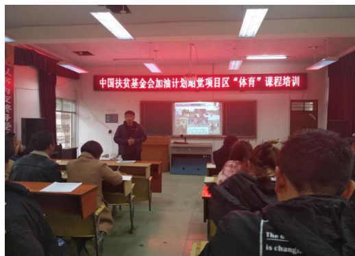
参加体育培训的老师们