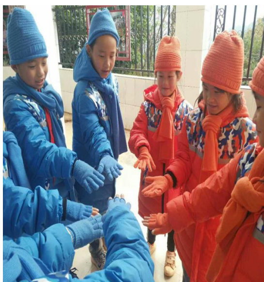
领到温暖包的孩子们