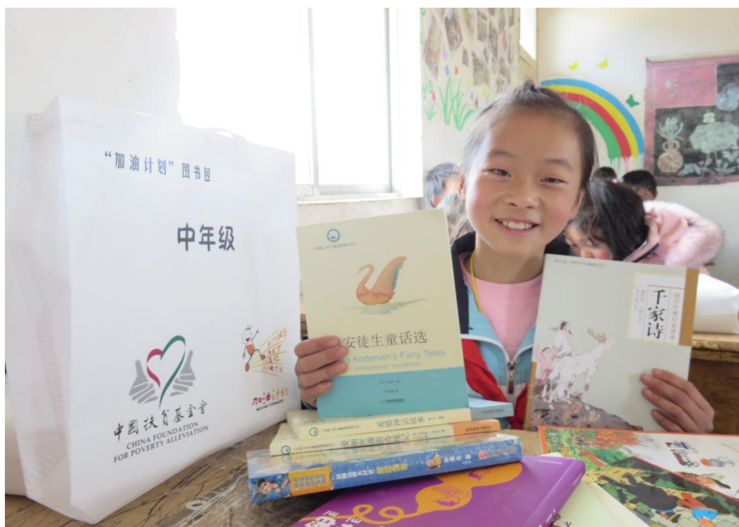
领到图书包的孩子们