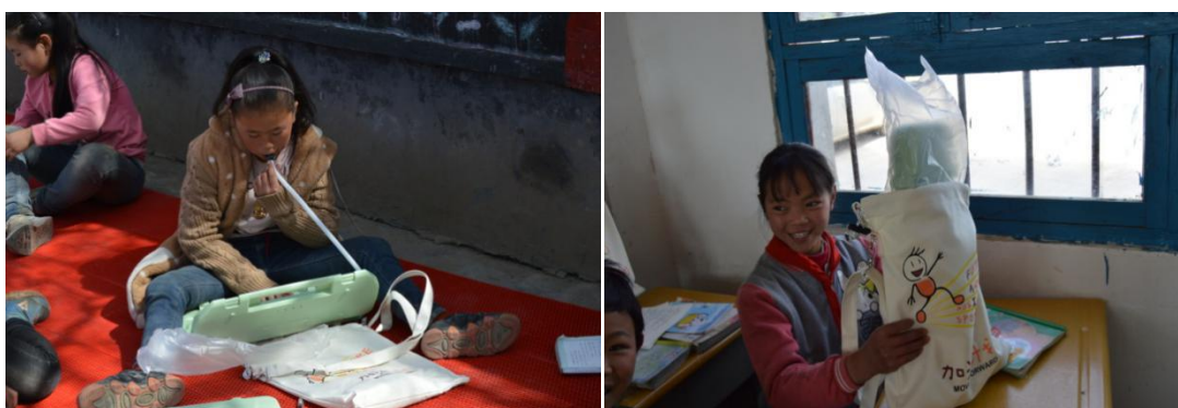
领到音乐包的孩子们