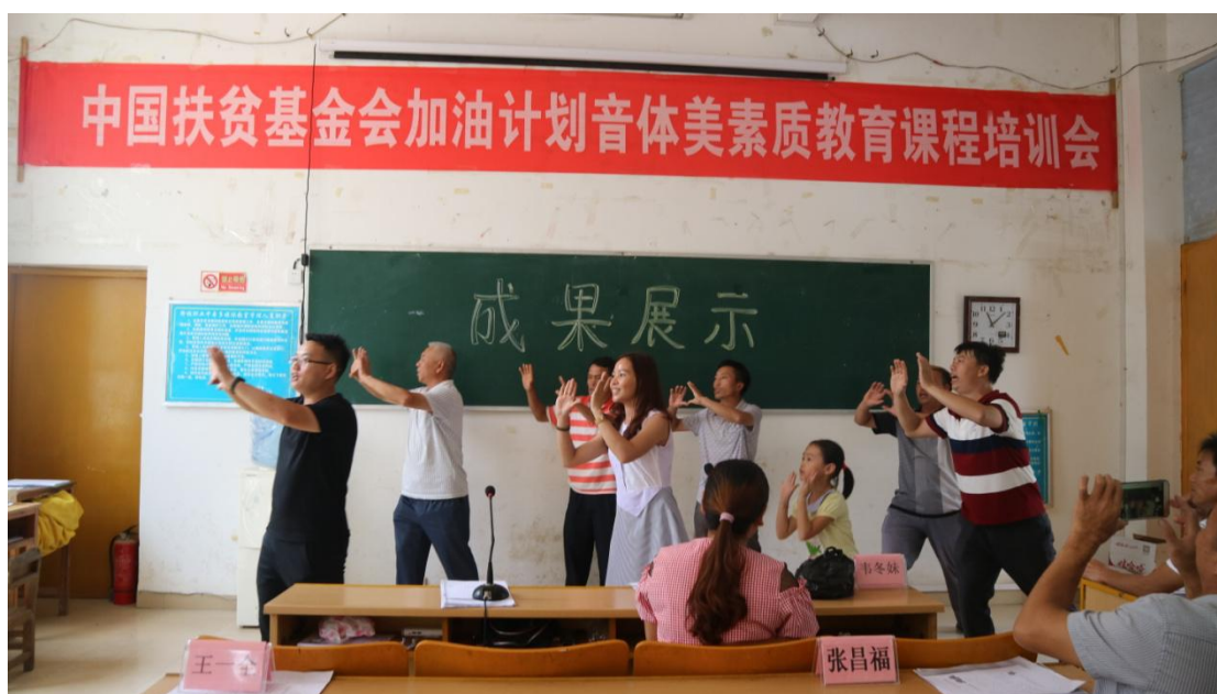
参加音乐培训的老师们