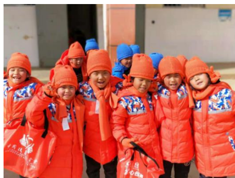
领到温暖包的孩子们