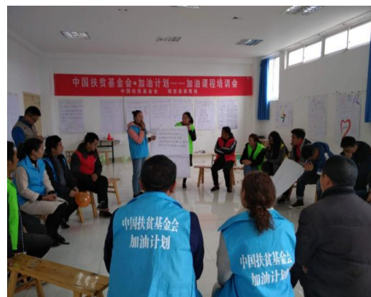
参加加油课程培训的老师們