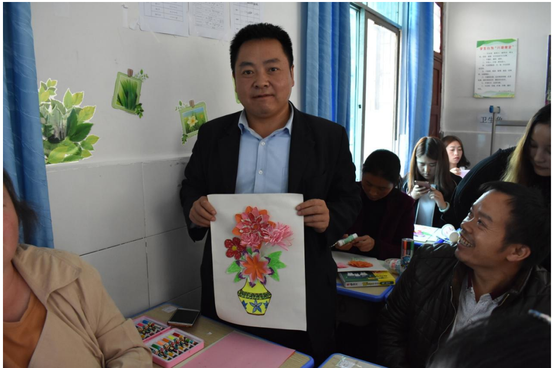
参加美术培训的老师们