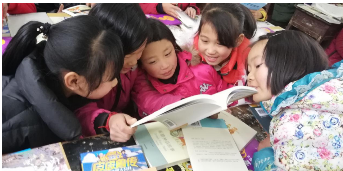
领到图书包的孩子们