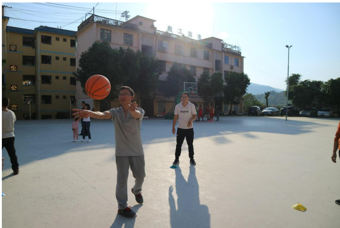
参加体育培训的老师们