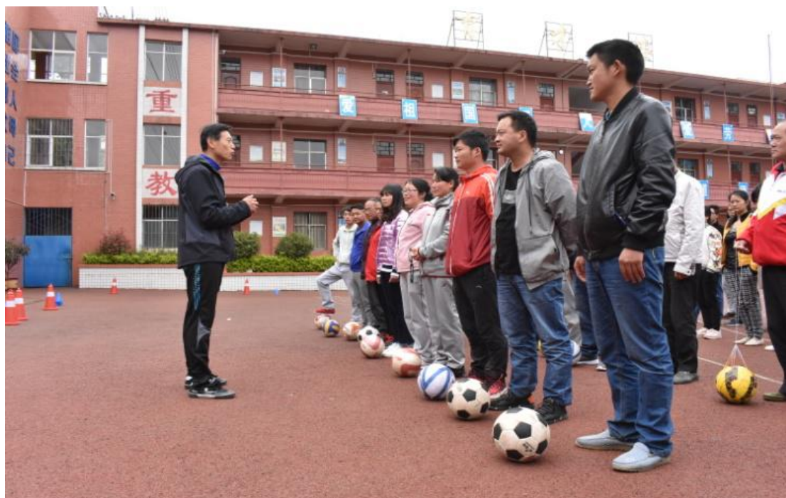
参加体育培训的老师們