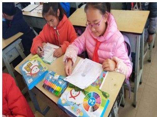
领到美术包的孩子们