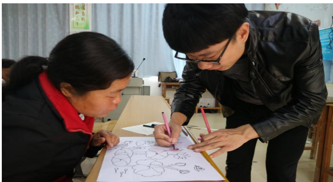
参加美术培训的老师们