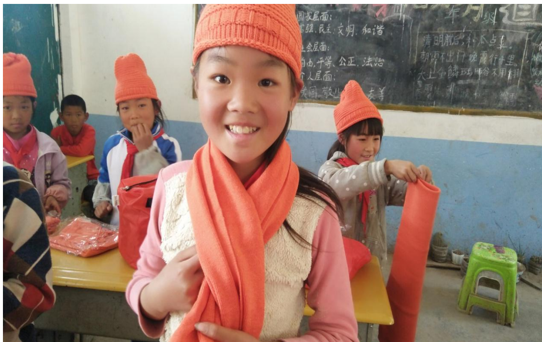
领到温暖包的孩子们