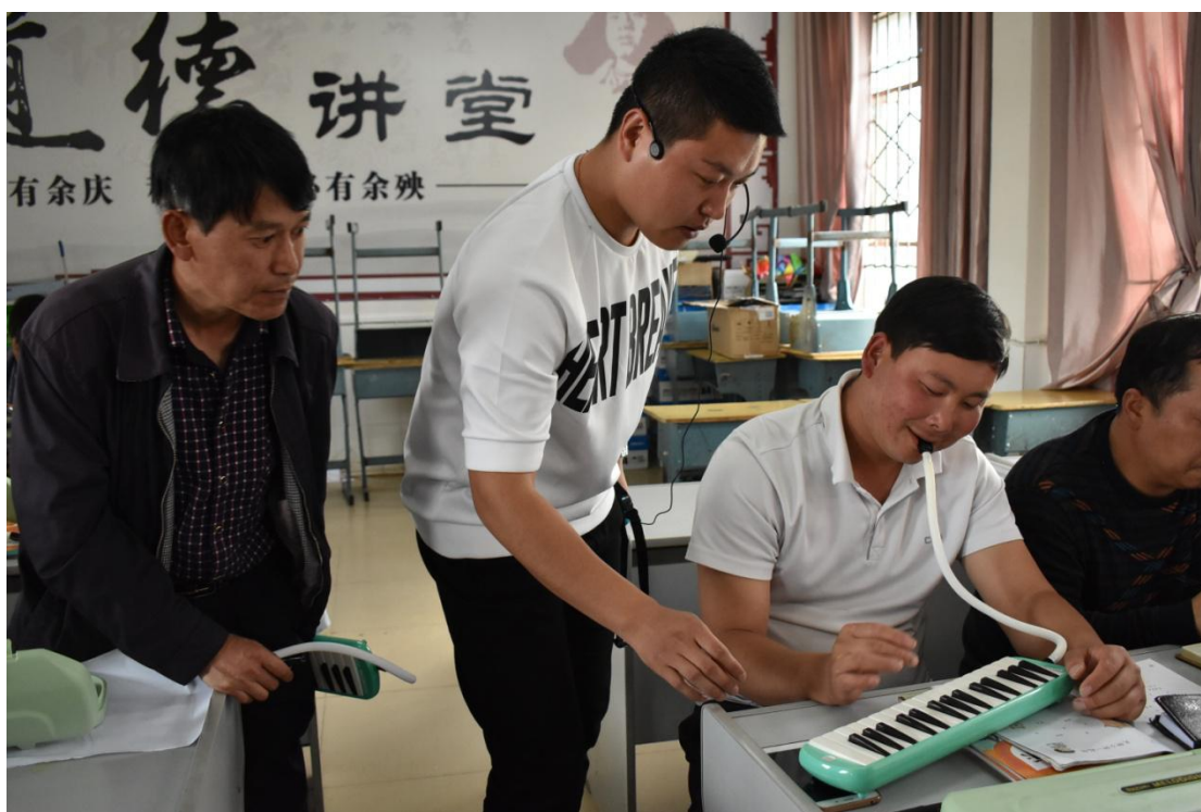
参加音乐培训的老师們