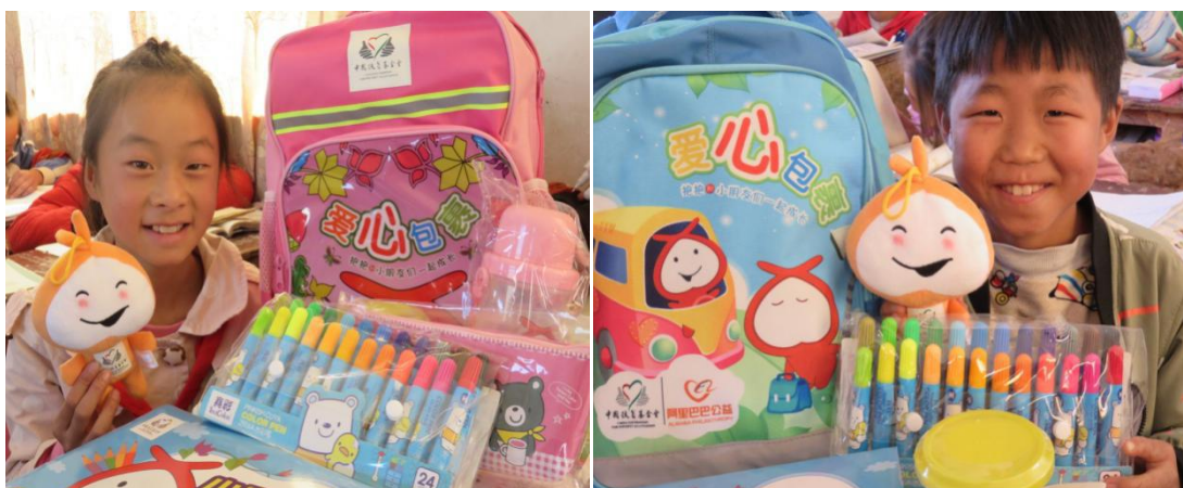
领到美术包的孩子们

沟小学、乐利小学、梅花小学、抹保小学、清水小学、妥打小学、新丰小学、营山小学、新田小学、田坝小学、马鞍小学、水营小学、汤朗小学、石门小学、银河小学、平山小学、妥那益小学等 27 所项目学校发放美术包 7075 个；