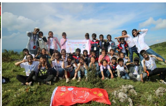
图 2 夏令营活动合影