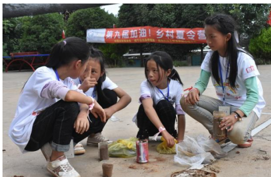
图 1 夏令营活动中的孩子