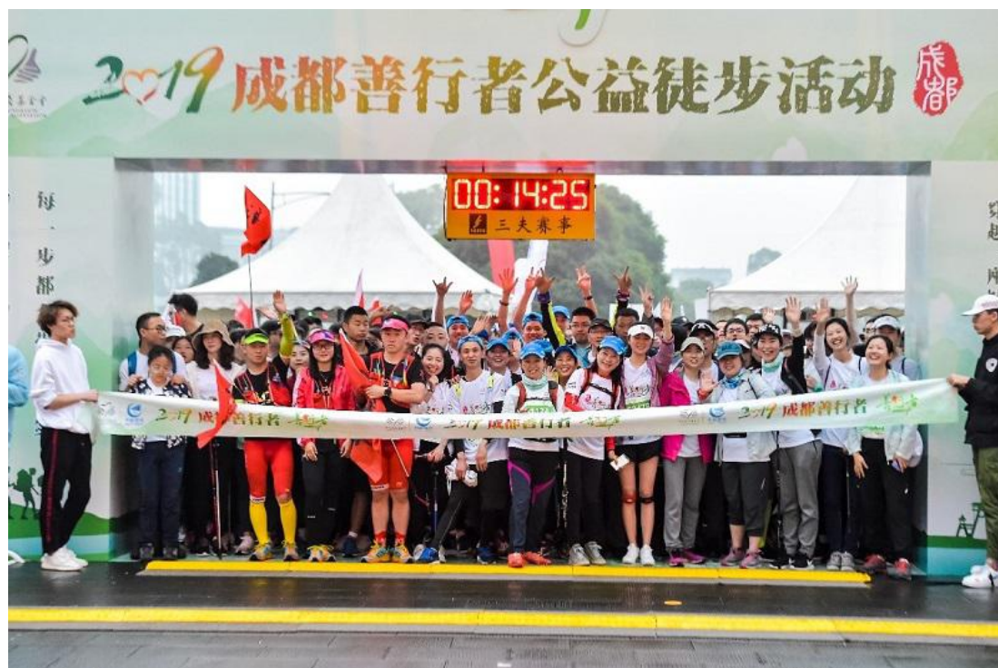
（善行者汇聚都江堰南桥广场，踏上征程）

辆到达 SP1 天然居站点运送队员返回终点南桥广场。最终，所有参与队员与志愿者安全抵达终点。