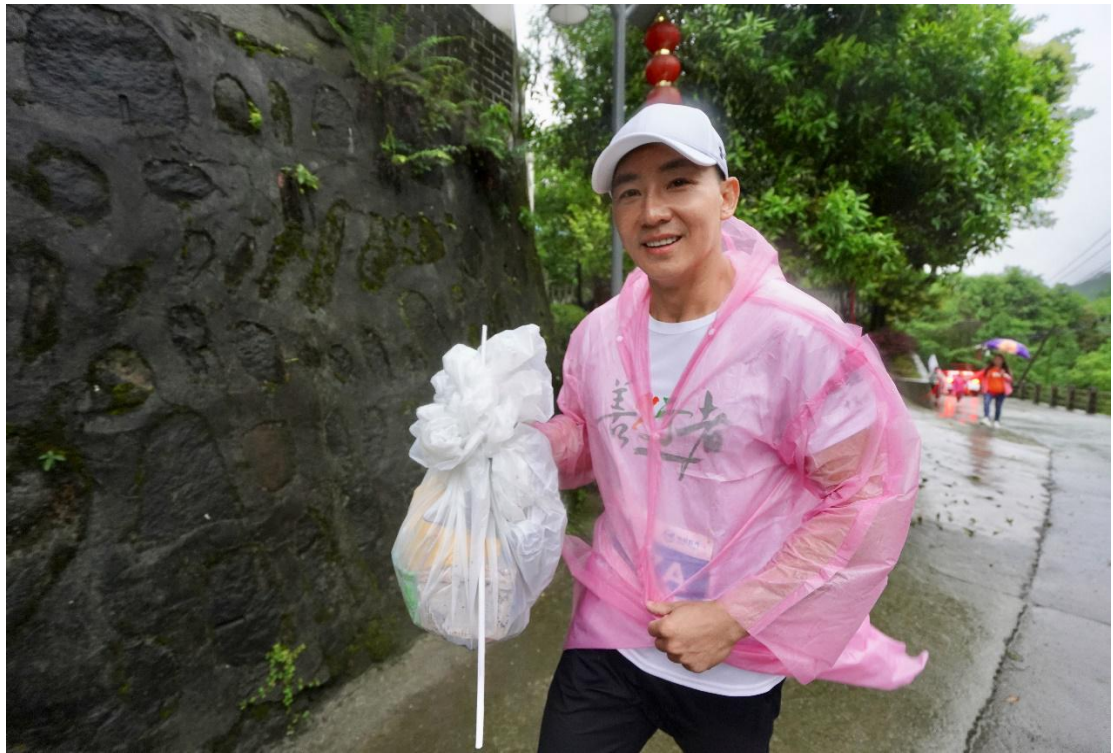
(2019 成都善行者善行大使刘畊宏践行环保善行)