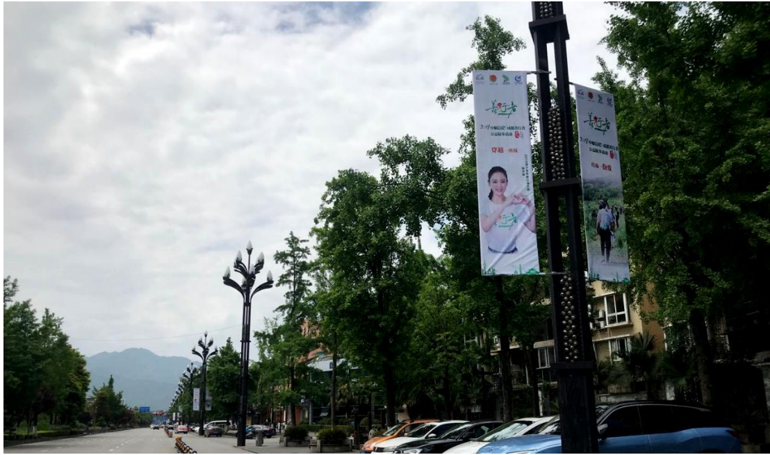
(都江堰市内灯杆道旗)