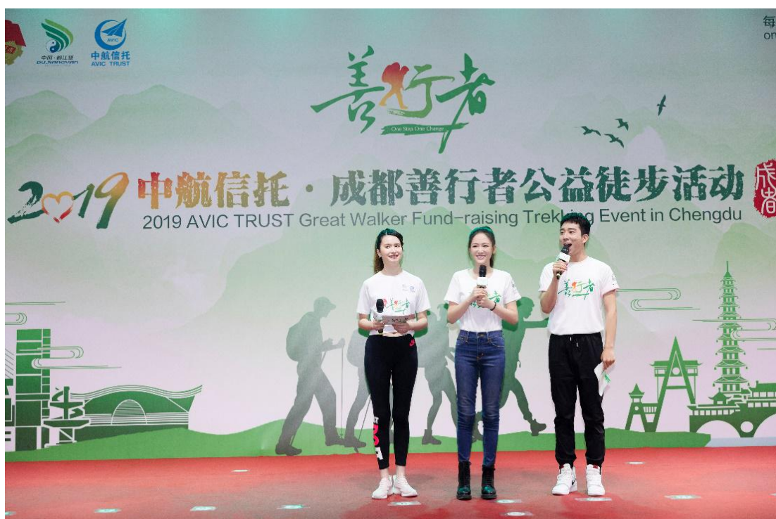
（2019 善行者年度公益大使陈乔恩在出发仪式上为队员加油鼓劲）

2019 成都善行者启动后，邀请演员陈乔恩女士担任年度公益大使，邀请歌手刘耕宏先生担任 2019 成都善行者善行大使，深入参与善行者宣传推广。陈乔恩女士参与录制视频 ID、原发微博，并出席 2019 成都善行者活动出发仪式，为队员们加油助威；刘耕宏先生现身 2019 成都善行者活动出发仪式，同队员一起冒雨从起点出发，并原发微博，以实际行动给队员们加油打气，支持公益。