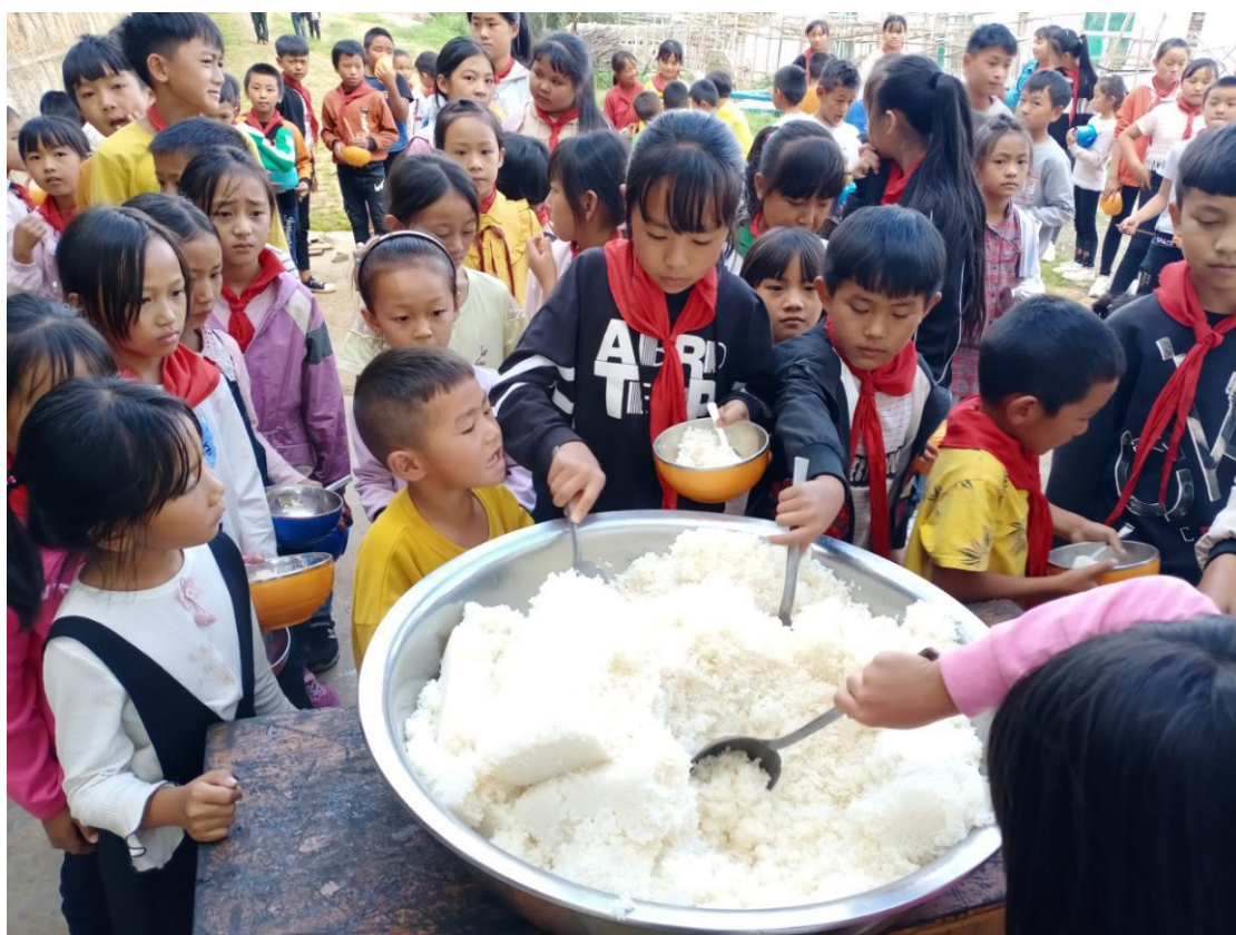
米香计划大米发放及学生用餐