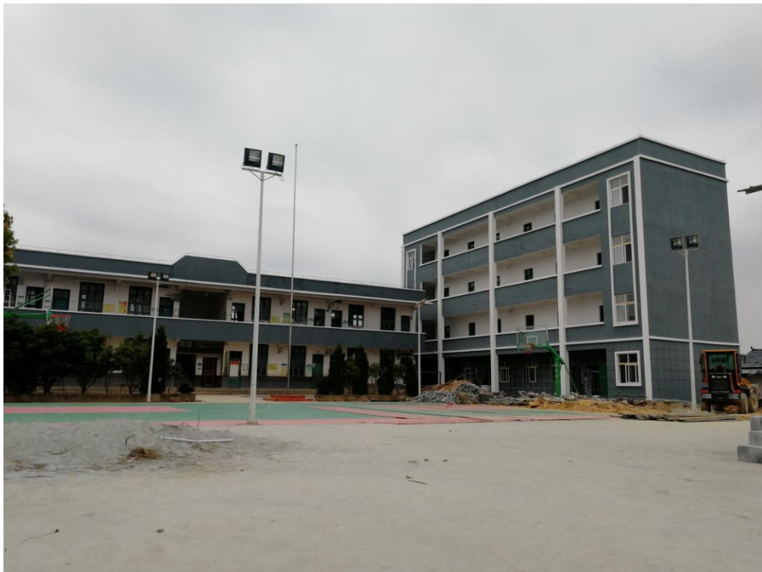
从江县归奶小学内部装修中