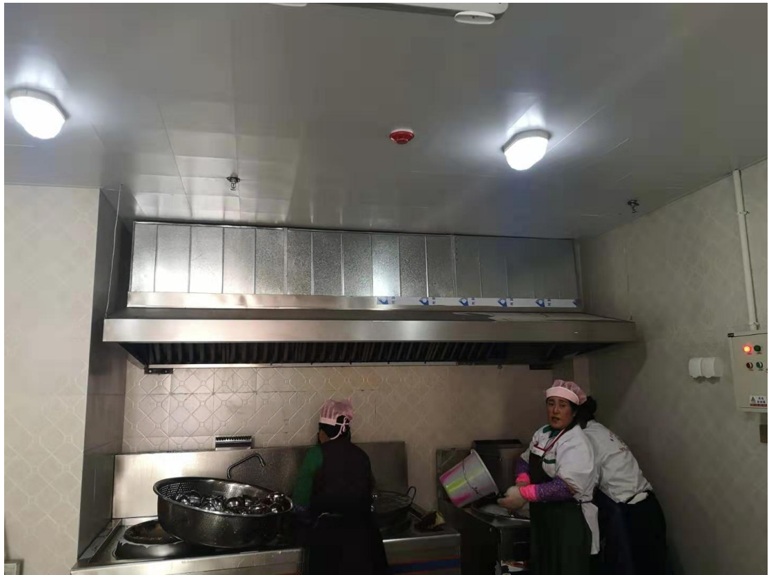
现为甘孜县第二幼儿园厨房的改造完成