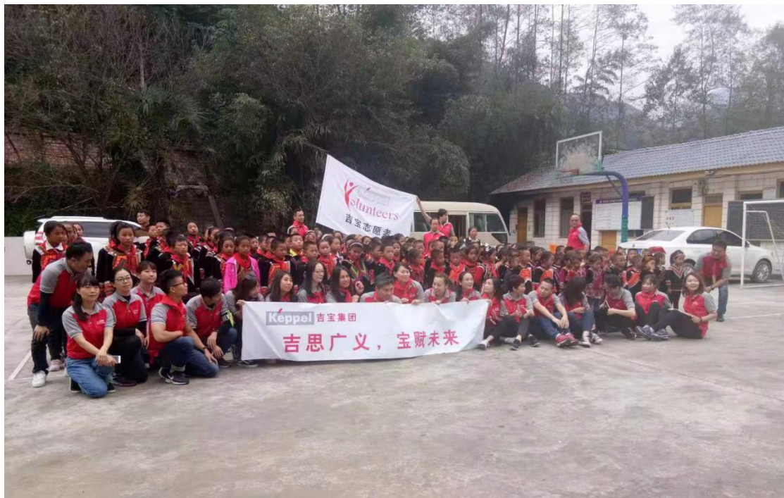
书路计划吉宝捐赠活动现场