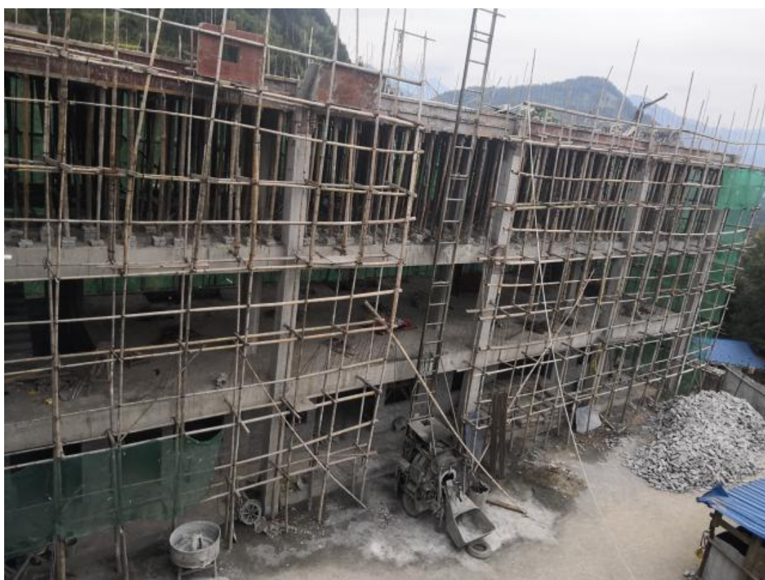
从江县良文小学三层砌筑中