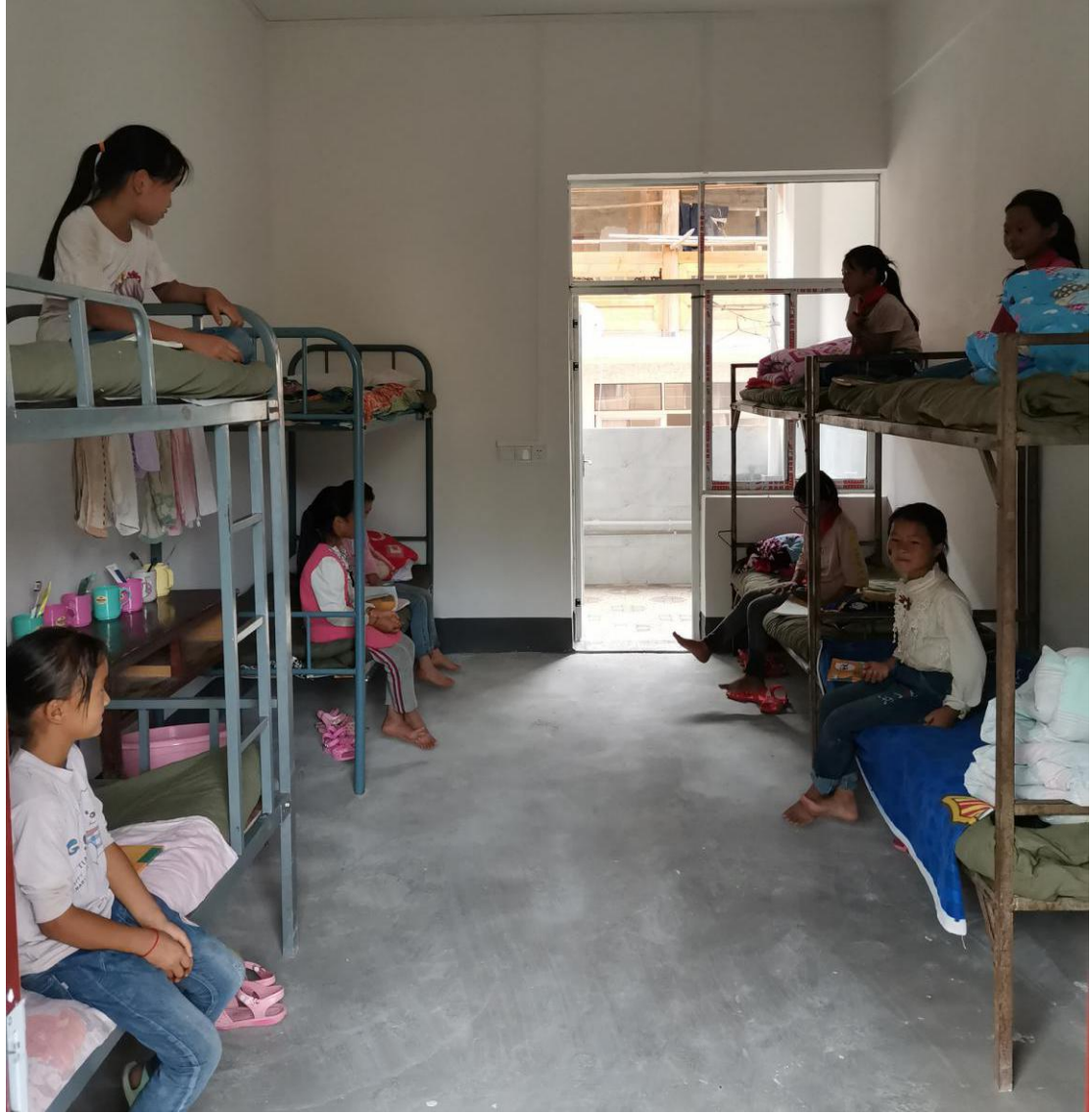
黎平县高求小学筑巢学生已入住