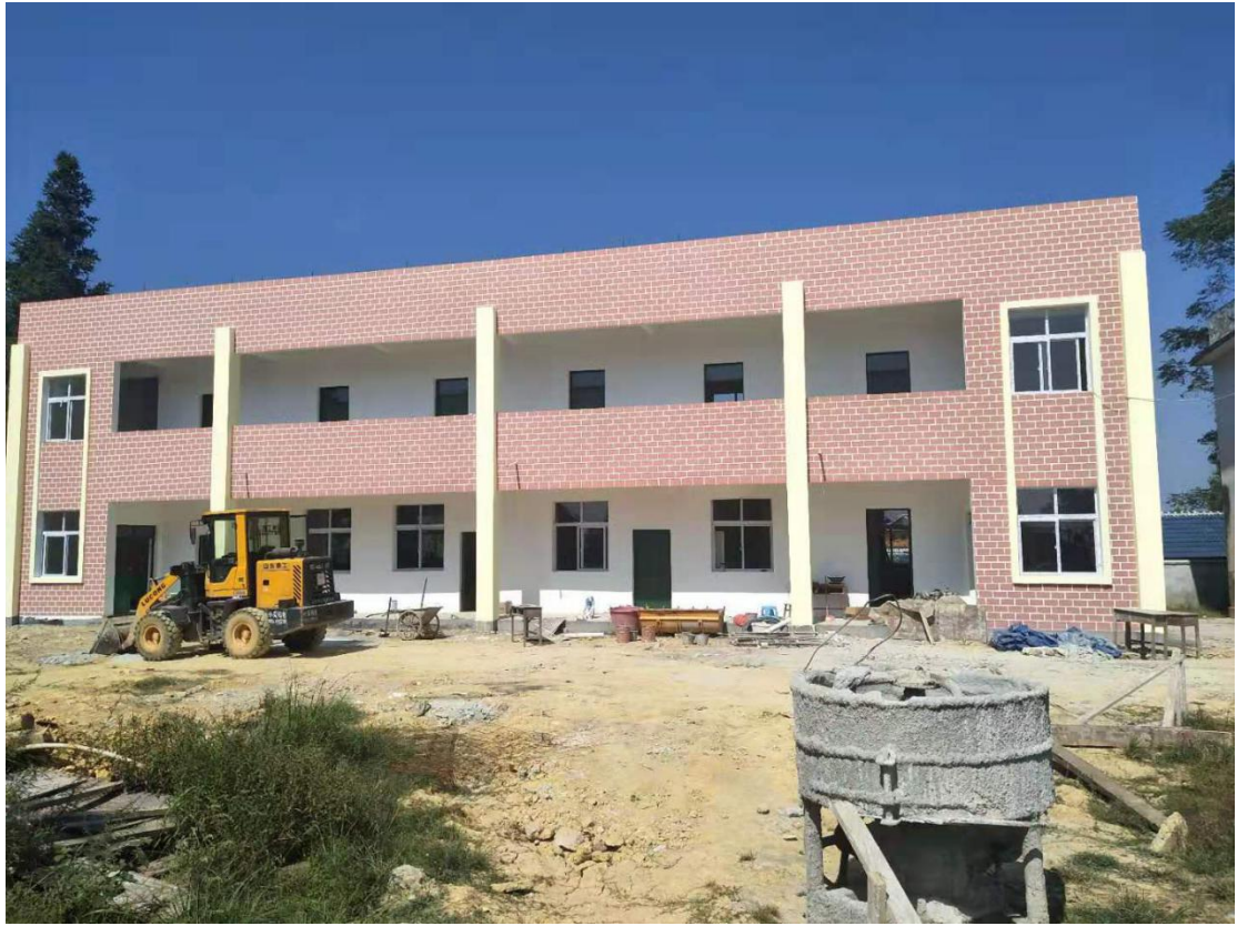
从江县东勤小学内部装修中