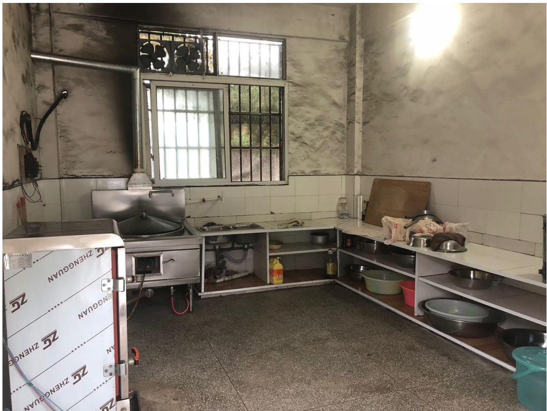
米香计划实地考察照片