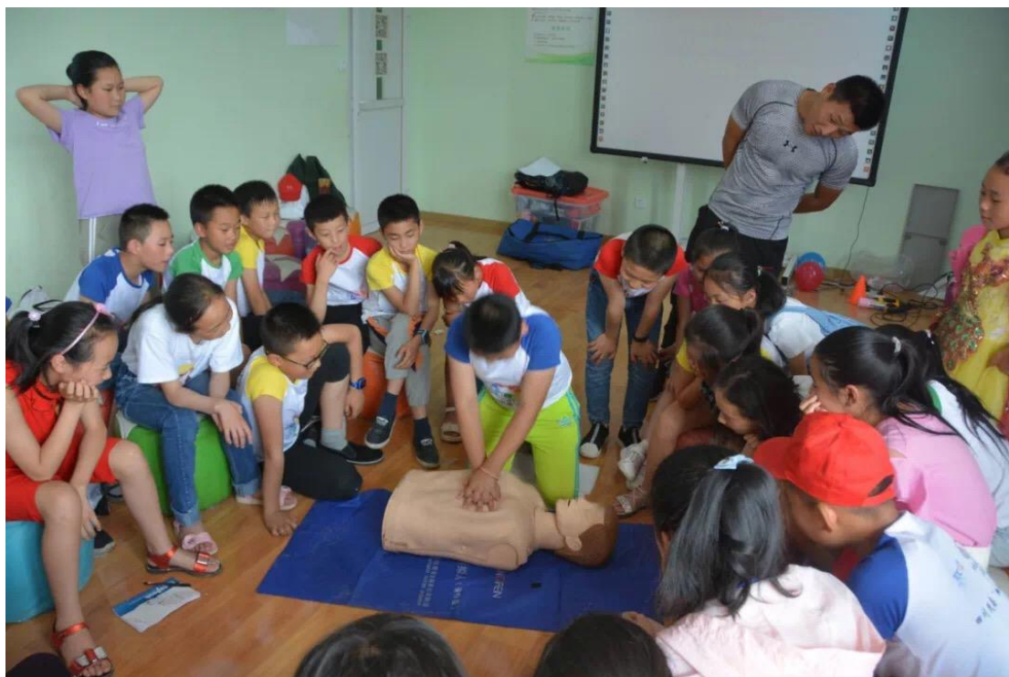
加油计划夏令营活动