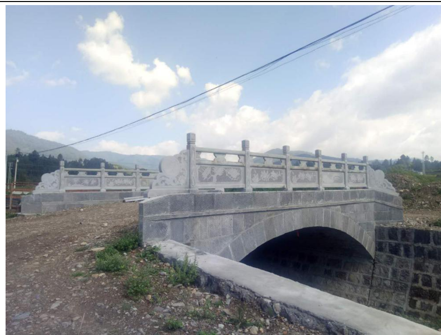
NO. 364 尖山脚小桥（竣工）