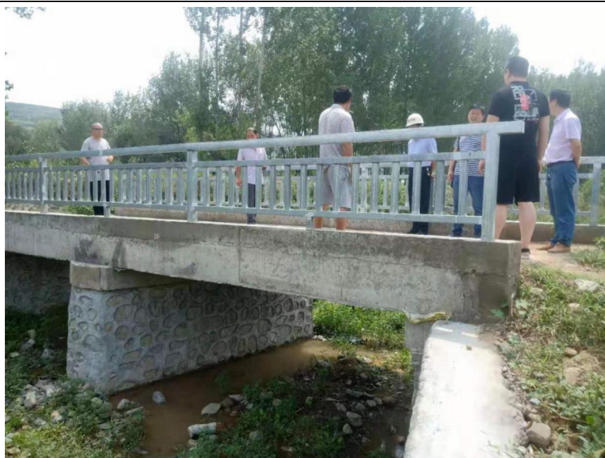
NO. 348 柴窑村涧河爱心桥（竣工）