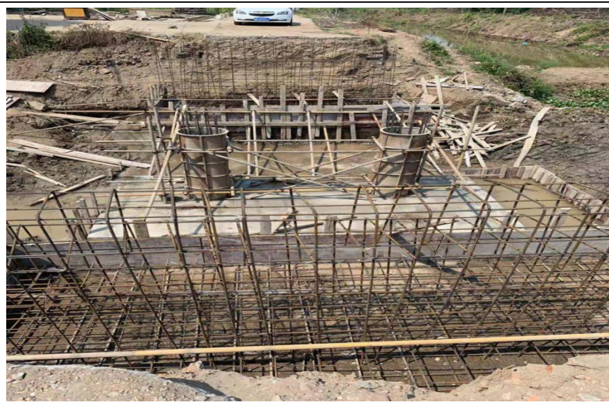
黄潭村邓家桥（在建）