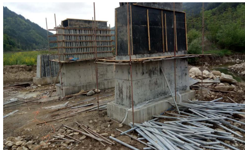
八里关云景桥（在建）