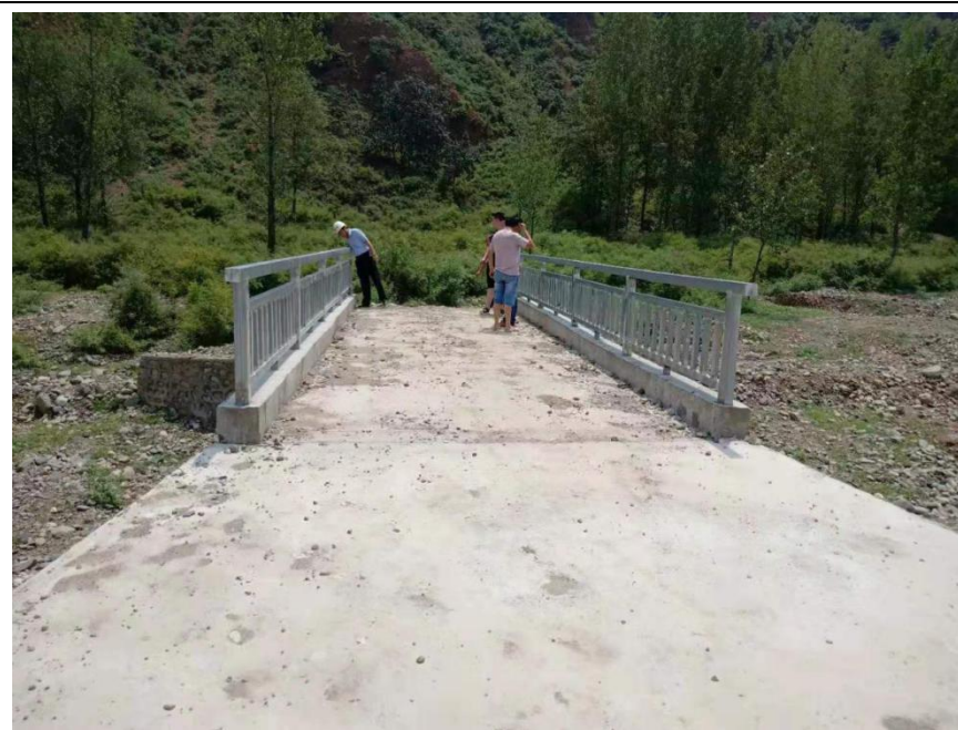
NO. 349 中高村涧河爱心桥（竣工）