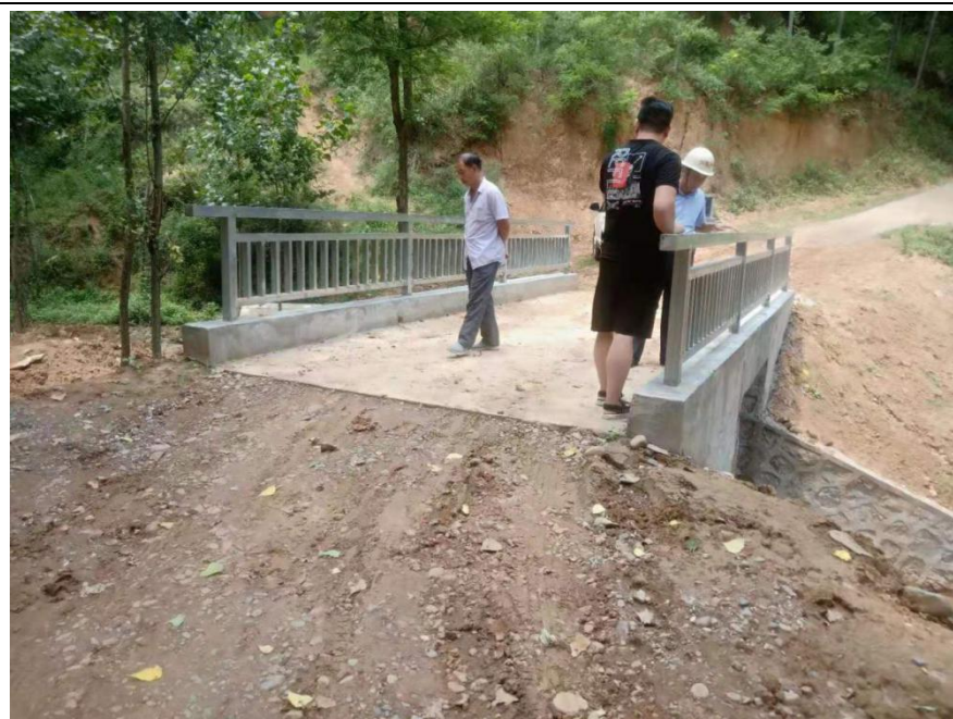
NO. 350 刘营邢家村爱心桥（竣工）