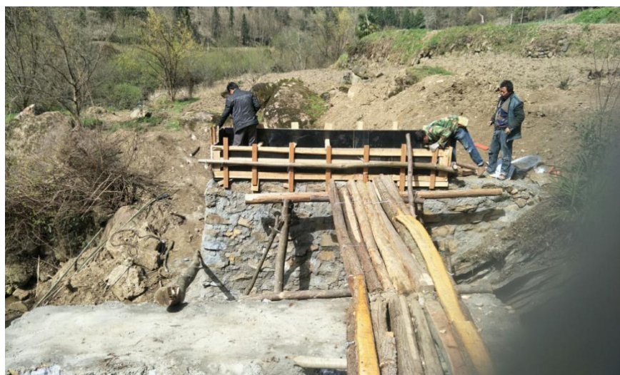
窑坪村欢乐桥（在建）