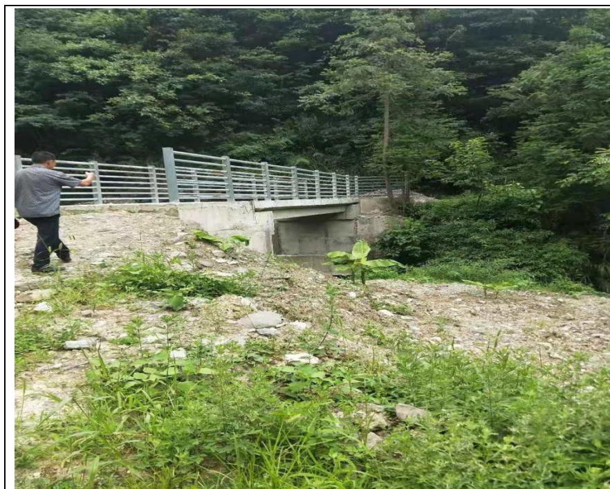
子河沟立农桥（竣工）