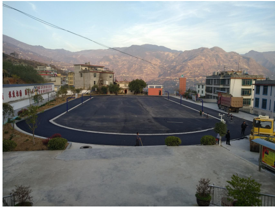
图3 沥青面层基本完成