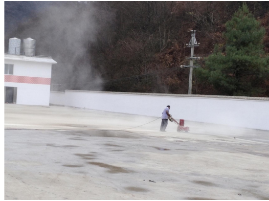
图 2 场地硬化打磨完成