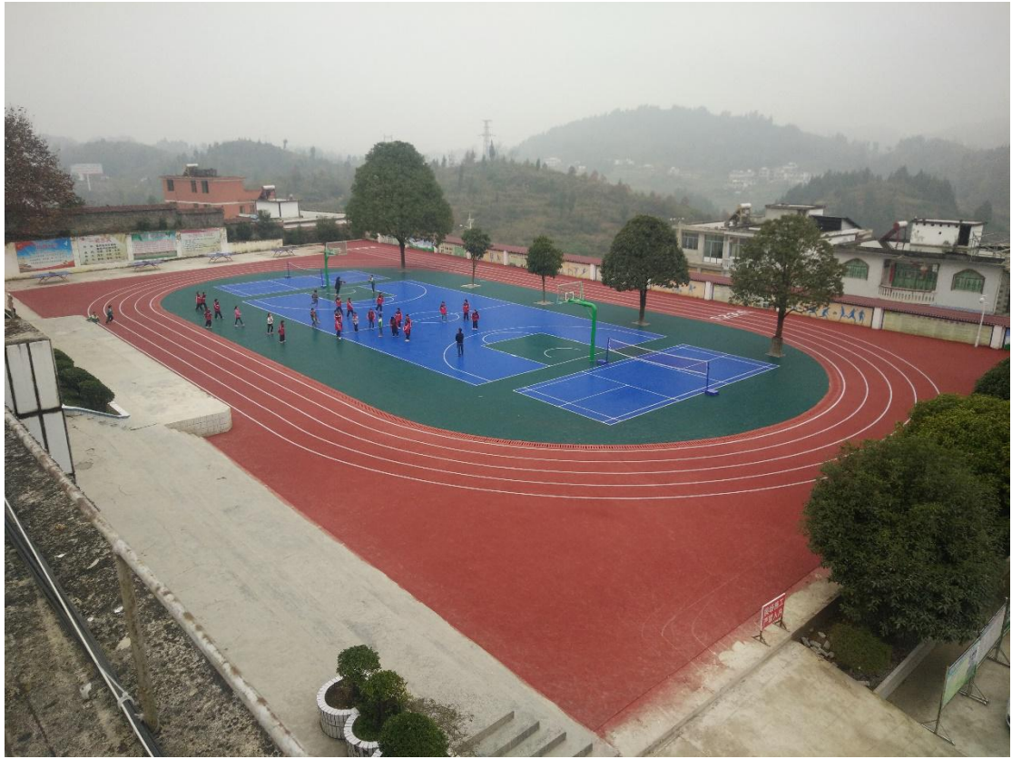
正安县庙咀九年一贯制学校阳光跑道建成照片