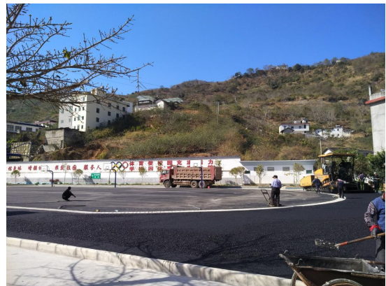
图2 沥青面层施工中