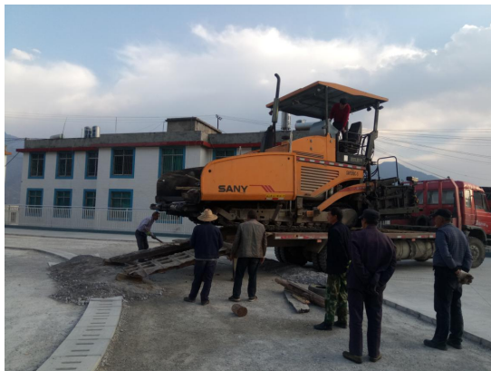
图1 沥青面层开始施工