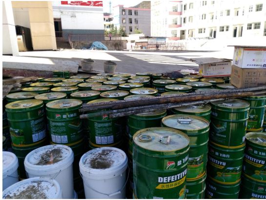
图 1 跑道软化材料进场