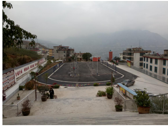
图4 场地球场灯安装完毕