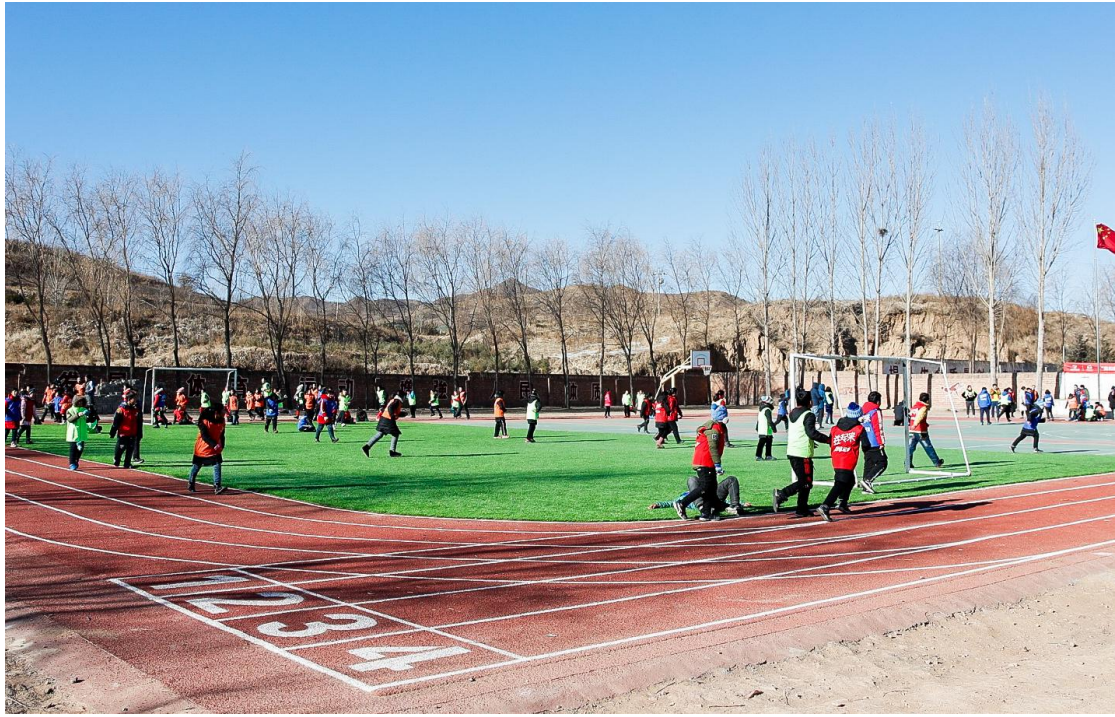
赤城县云州乡中心小学阳光跑道建成照片