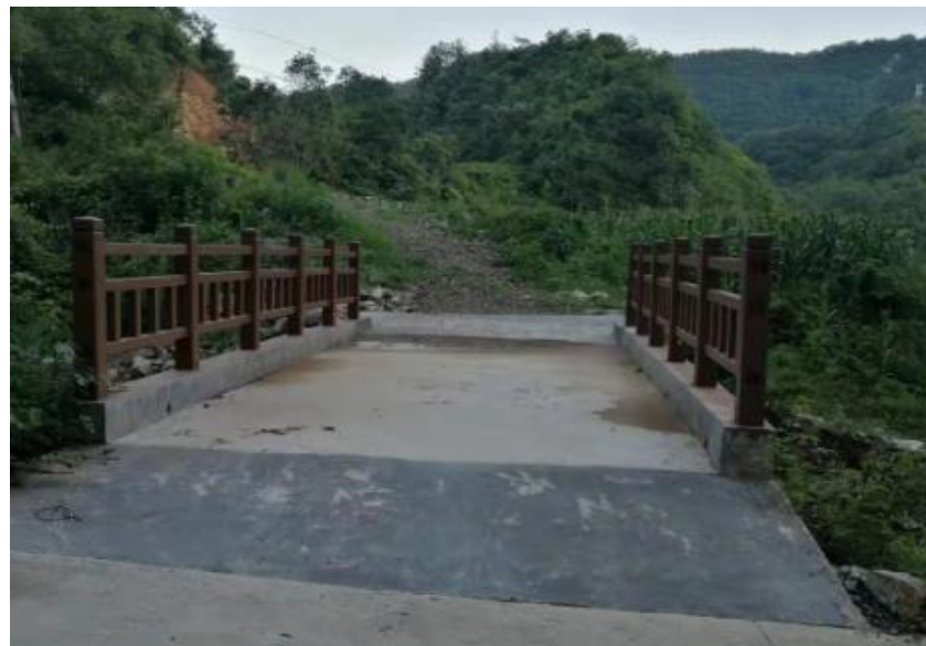
大地村和谐桥（竣工）