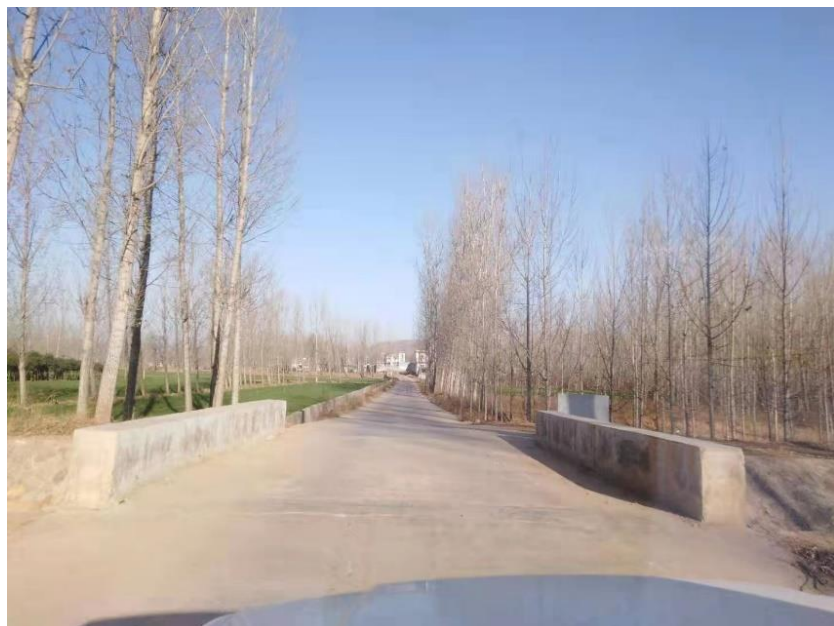
下河村快乐桥（竣工）