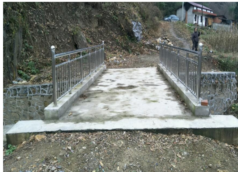
八里关云景桥（竣工）