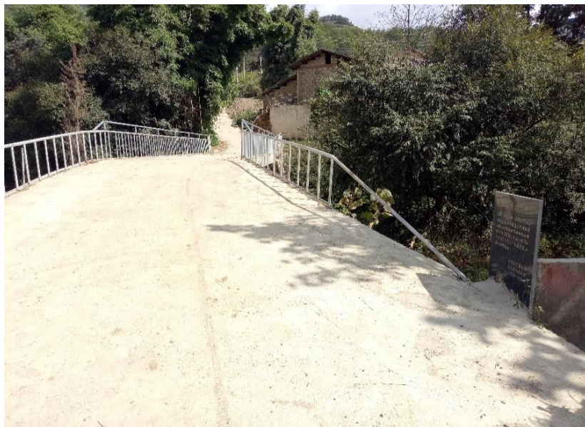
NO.357 清水河便民桥 (竣工)