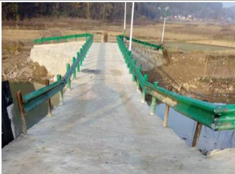
窑坪村欢乐桥（竣工）