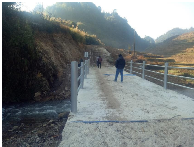
NO.038 红卫桥 (竣工)