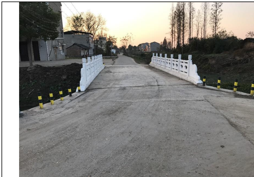
黄潭村邓家桥（竣工）