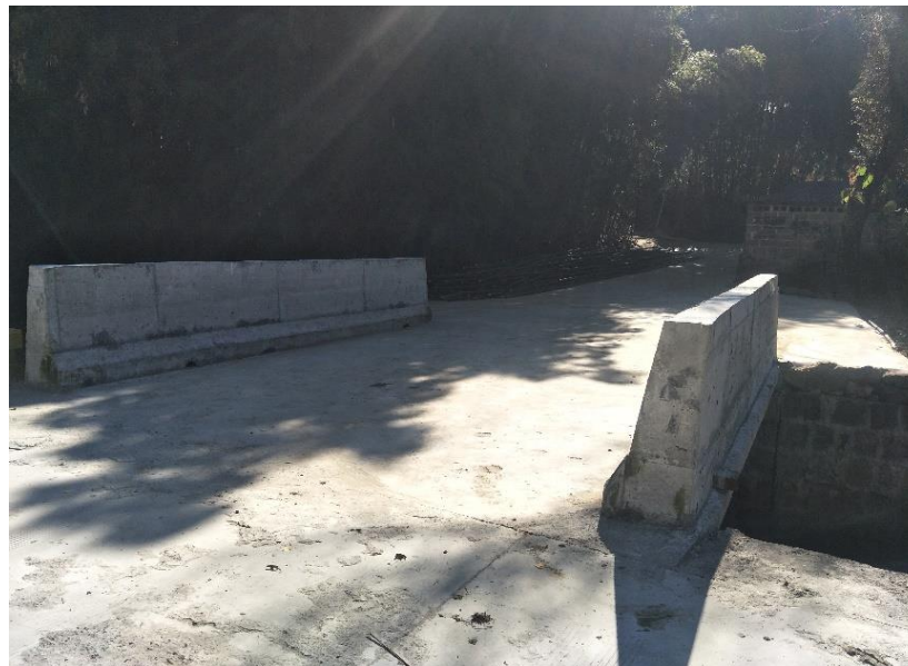
NO.363 白沙河小桥 (竣工)