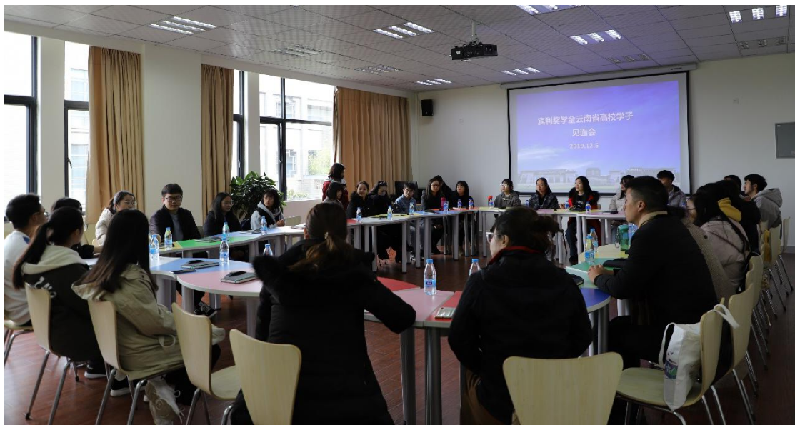
图 1. 宾利奖学金云南省高校学子见面会现场