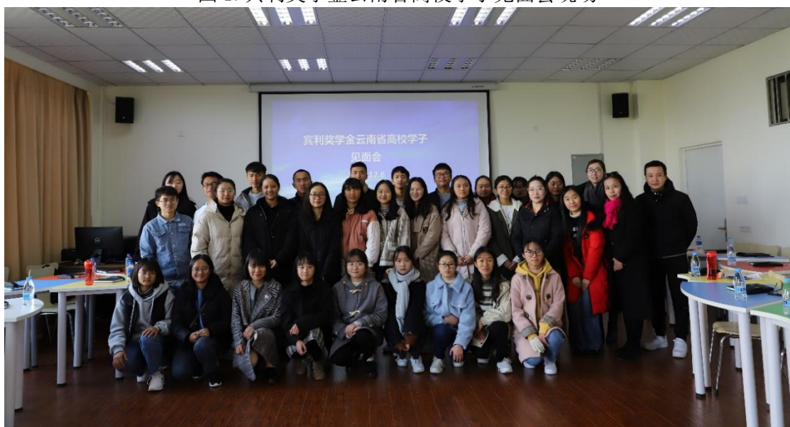
图 2. 宾利奖学金云南省高校学子见面会合影