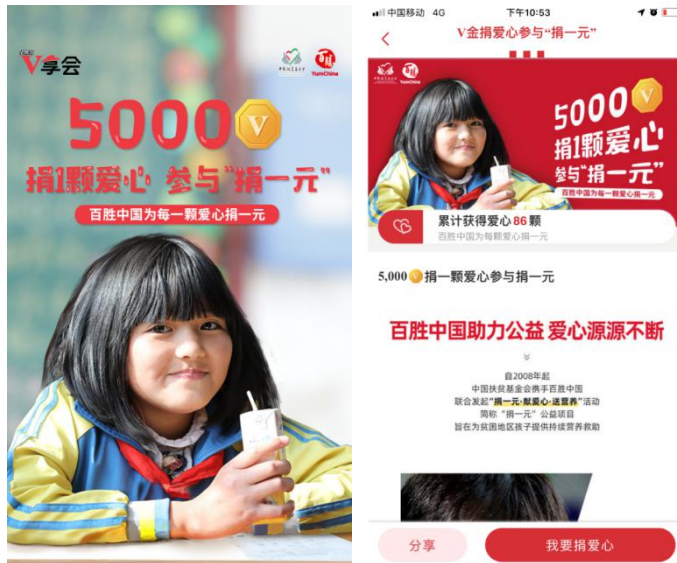
V金捐爱心海报、捐赠页面

1. 为动员更多人加入，“捐一元”推出“V金捐爱心”活动，消费者可使用在百胜中国旗下品牌累积的会员积分“V金”兑换爱心的形式参与到“捐一元”公益活动，百胜中国将为每颗爱心捐1元，最终根据在活动期间筹集到的爱心数量捐赠善款。