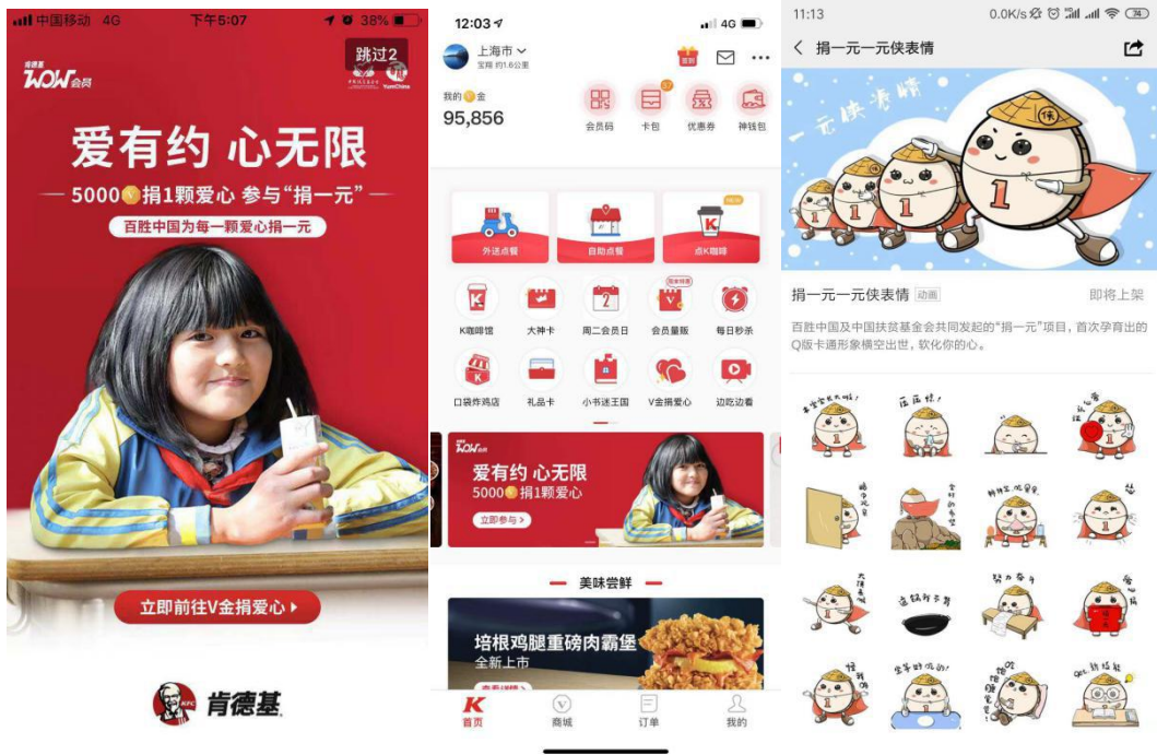
APP 开屏、首页推广资源，一元侠表情包