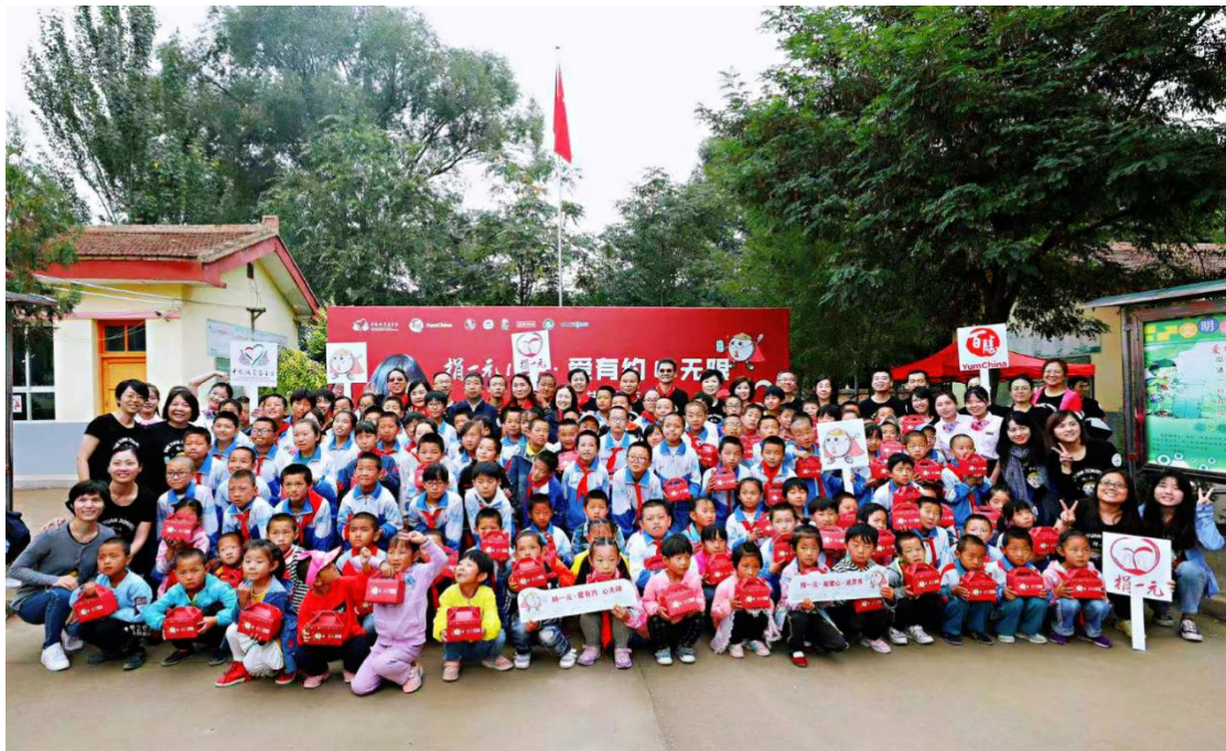
8月21日，2019捐一元探访活动在甘肃会宁下中滩小学进行。中国扶贫基金会执行副理事长王行最、百胜中国首席执行官屈翠容（Joey Wat）及多位百胜中国管理层代表、员工代表、志愿者们看望了“捐一元”受助的孩子们，把集结的社会爱心转化成的营养加餐、“爱心厨房”带到下中滩小学，一点一滴帮助贫困地区儿童改善营养