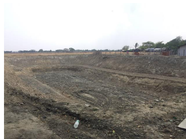
即将完工的蓄水池