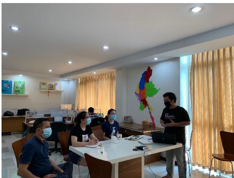
中国扶贫基金会缅甸办公室项目工作组会议讨论中

为筹备 2020 胞波助学金项目的启动，缅甸办公室相关工作人员进一步理清项目逻辑框架，并修订完善了 2020 年胞波助学金项目操作手册。