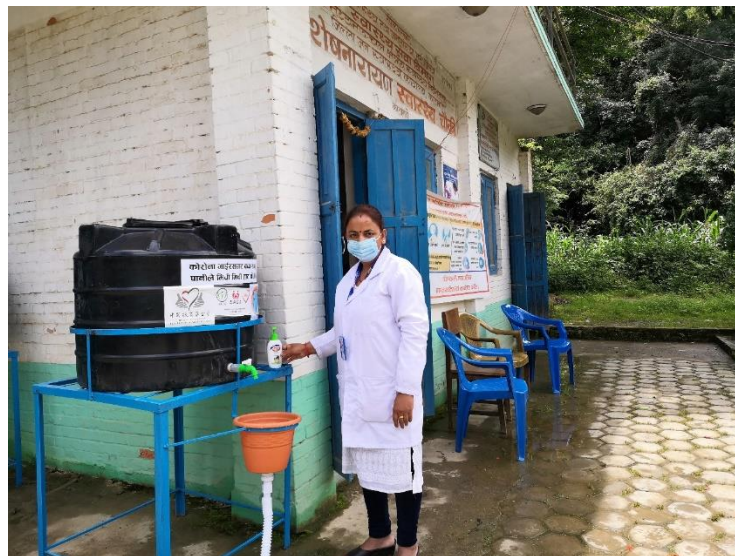
尼泊尔当地社区医生在洗手站旁边演示正确洗手规范