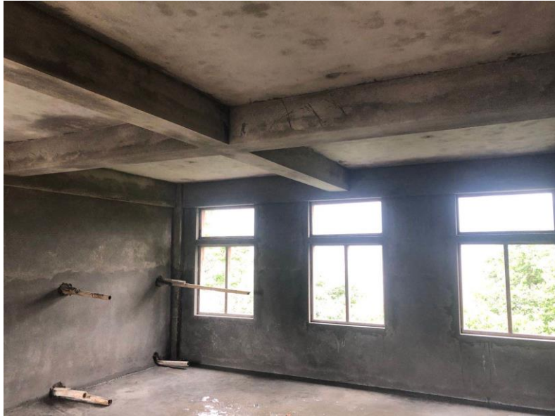
尼泊尔 ANANDA KUTI 学校教学楼主体工程建设完成