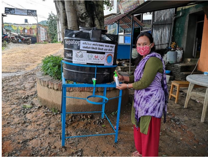
尼泊尔社区居民在卫生防疫洗手站进行清洁洗手