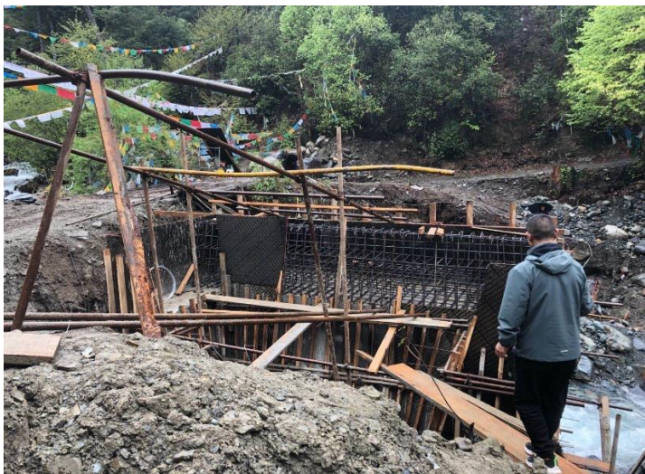
NO.308 朱龙巴桥 (在建)