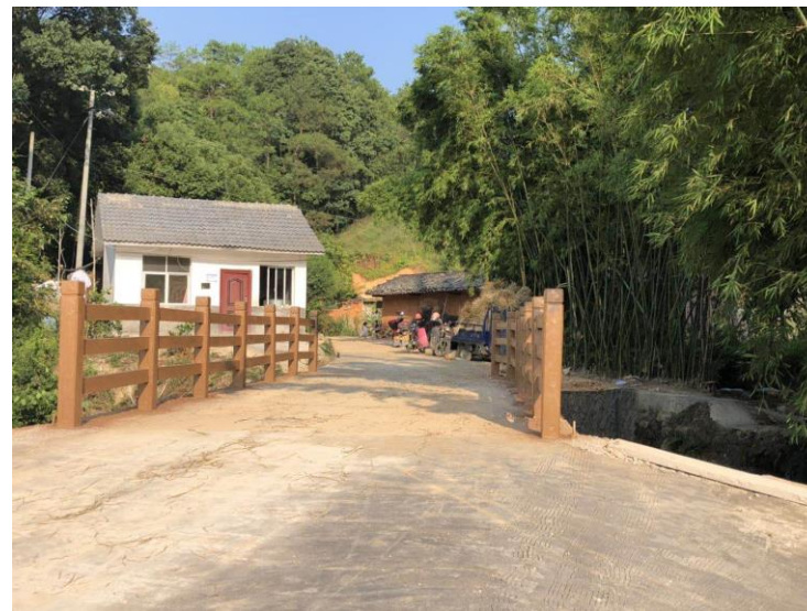
NO.366 大众坑口公路桥 (竣工)