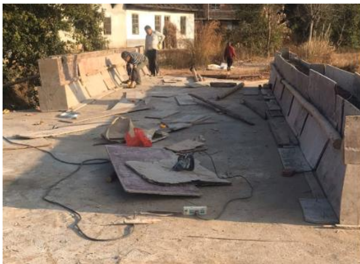
NO.369 大众组桥 (在建)