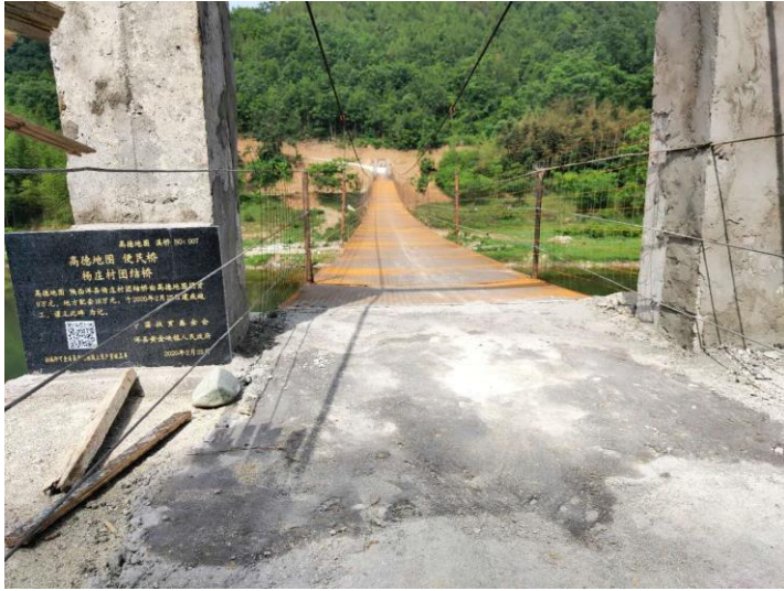
NO.006 杨庄村团结桥（竣工）