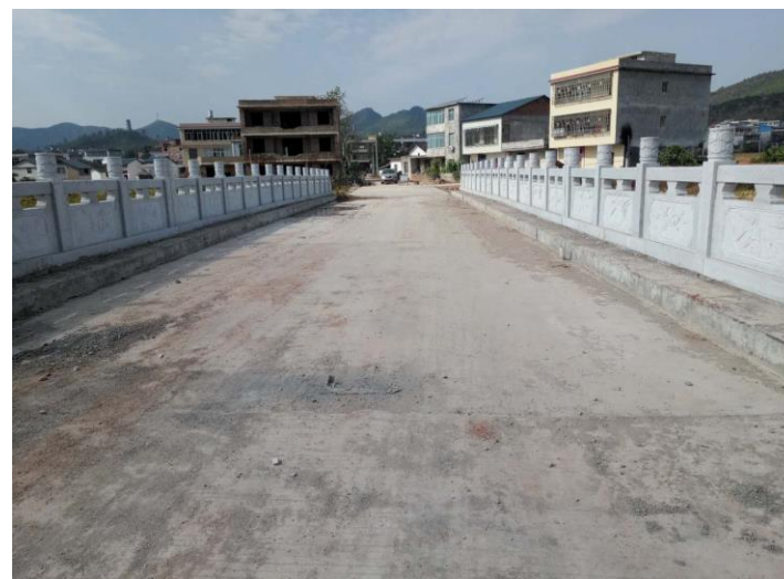
NO.370 伦飞桥 (竣工)