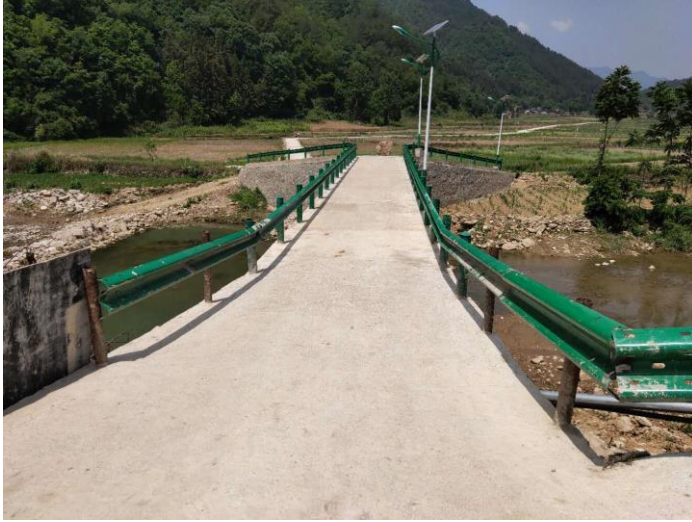
NO.036 秧田坝爱心桥 (竣工)