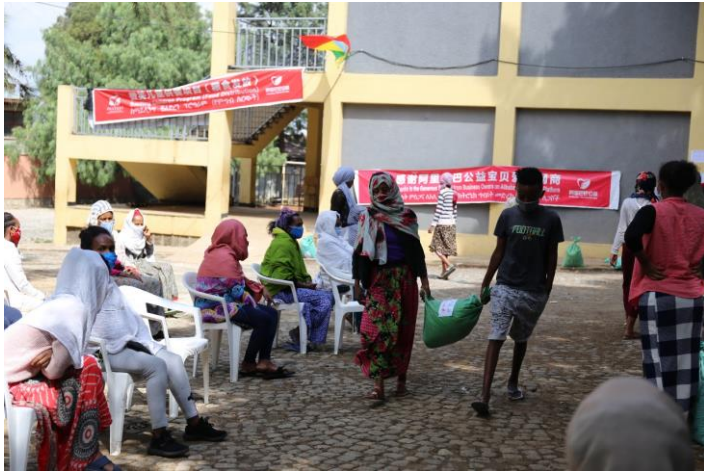
领到粮食的孩子和家长离开现场