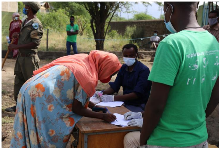
家长们在签领粮食包