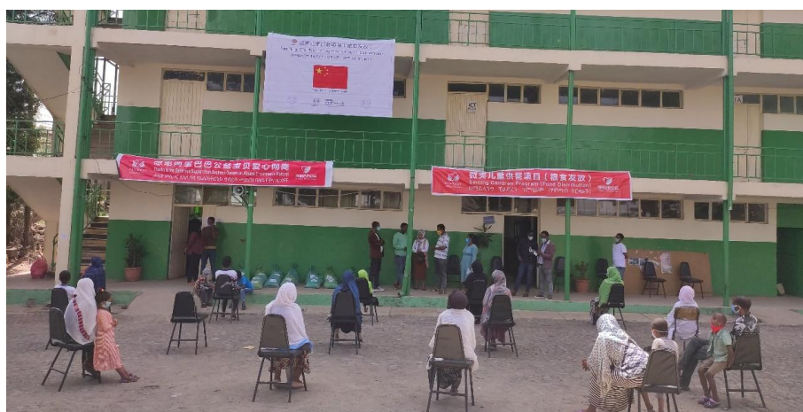
蒙特巴巴公立小学发放现场

5-6月份，中国扶贫基金会在埃塞俄比亚首都亚的斯亚贝巴欧米德拉和蒙特巴巴公立小学及欧罗米亚州哈若一小、哈若二小及蒙特哈若公里小学为贫困儿童发放粮食包，共计两个地区、五所学校 4934 名学生受益。中国扶贫基金会埃塞办公室项目人员、埃塞当地政府官员、学校教职工均参与了粮食包的现场组织发放工作。