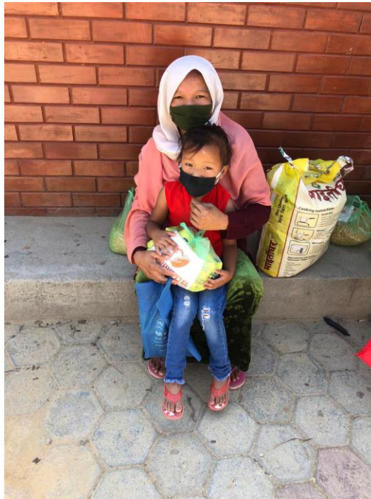
受益学生与母亲展示粮食包