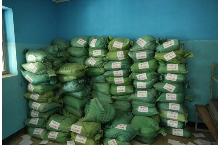
粮食包提前堆放好