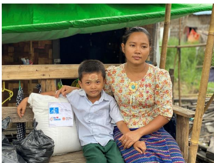
受益学生与家长收到“微笑儿童”粮食包