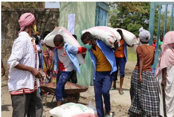
搬运粮食回家的孩子