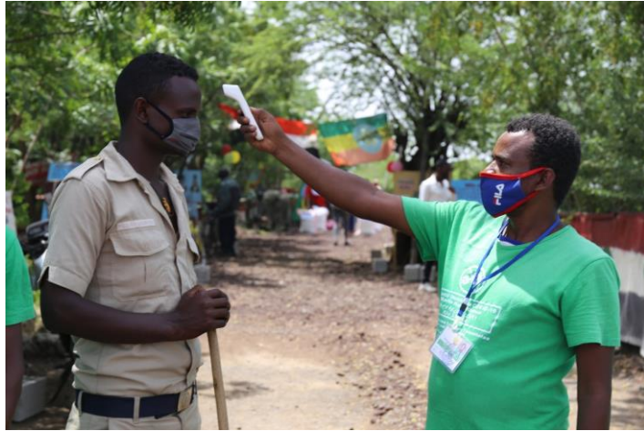
发放现场，工作人员组织大家测温洗手，演示发放安全注意事项