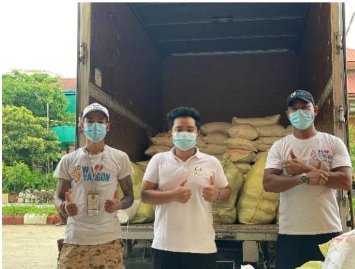
项目工作人员筹备粮食包发放