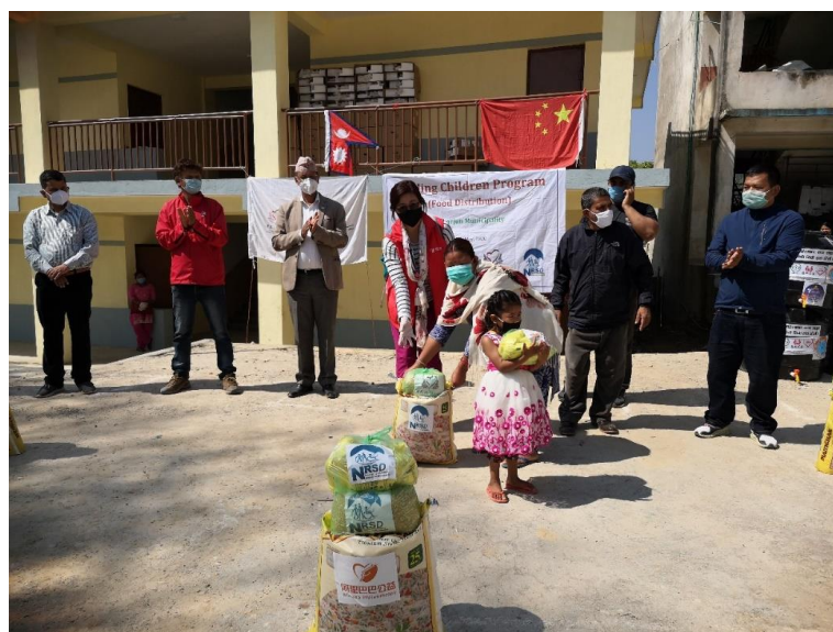
受益学生从工作人员手中接过粮食包