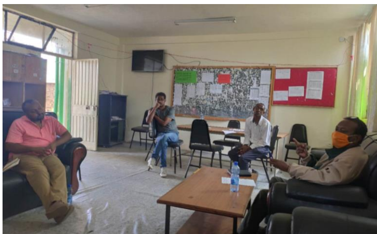
埃塞项目人员拜访受益学校了解需求并探讨项目执行

4月，项目组积极调研当地需求，走访学生家庭，与学校、当地各级教育部门、其他相关政府部门等讨论制定相关方案，并与捐赠人沟通变更原有的学校供餐模式为粮食发放模式。