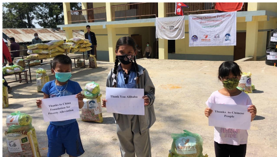
受益学生致谢捐赠人

中国扶贫基金会尼泊尔办公室项目团队与合作伙伴 NRSD 向尼泊尔福利委员会 (SWC) 进行微笑儿童项目进展汇报，并提交项目调整申请材料，并获得其批准，为接下来 7 月份展开的第二轮粮食发放做好准备。