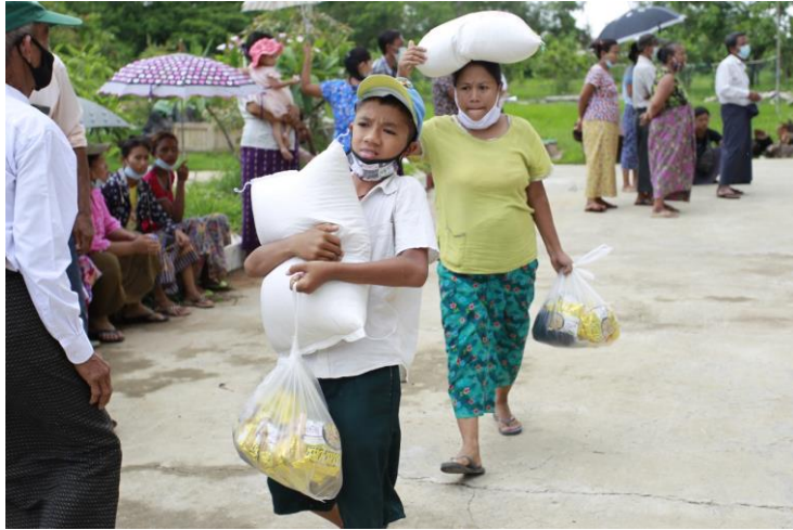
受益学生与家长领取“微笑儿童”粮食包