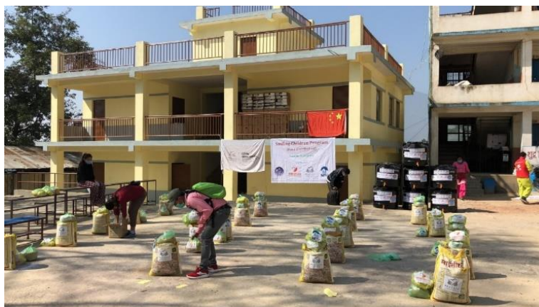
码放整齐的粮食包

5 月，中国扶贫基金项目工作人员为尼泊尔 Chandragiri 和 Nagarjun 地区的 12 所政府学校完成了 2383 个微笑儿童粮食包的发放工作。中国扶贫基金会尼泊尔办公室