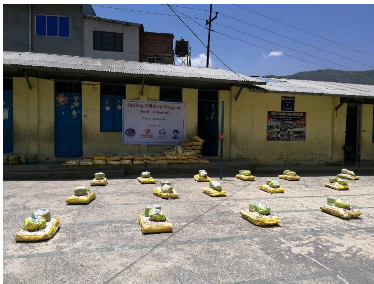
发放现场，粮食包按照 1 米距离被提前摆放好

项目人员、当地合作伙伴、当地政府官员、学校教职工等均参与了粮食包的现场组织发放工作，此轮粮食包发放工作共惠及 2383 个受益儿童。