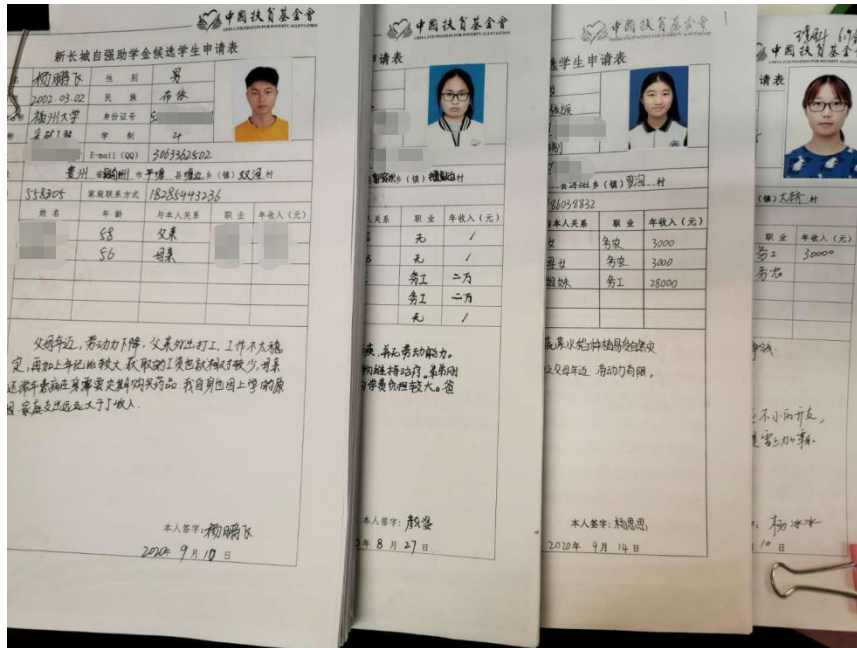
(图 1: 县推荐受益学生申请材料收集审核)