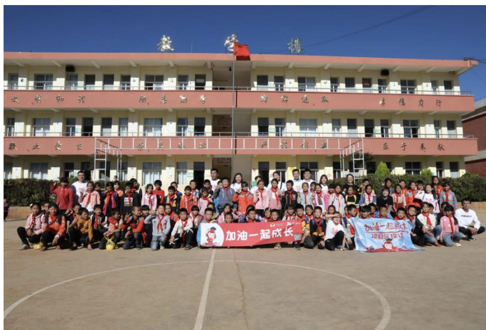
月捐人探访和孩子们的合影留念