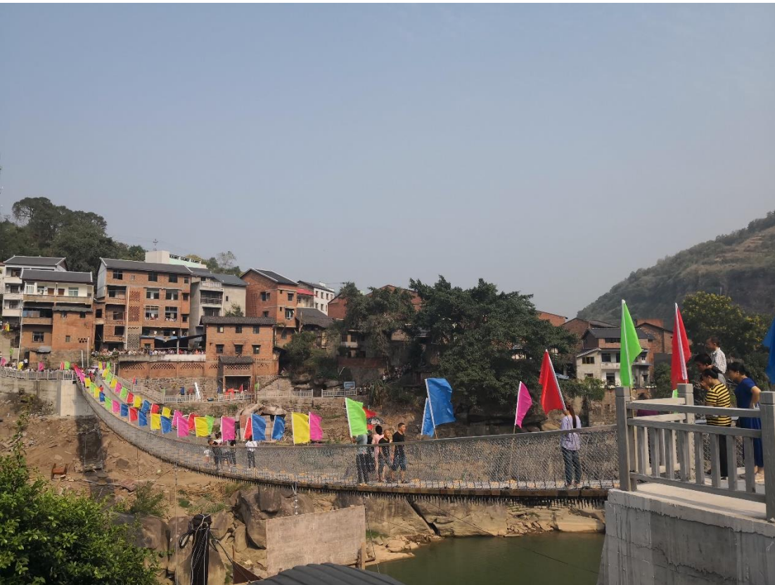
重庆綦江区盖石铁索桥进展照片