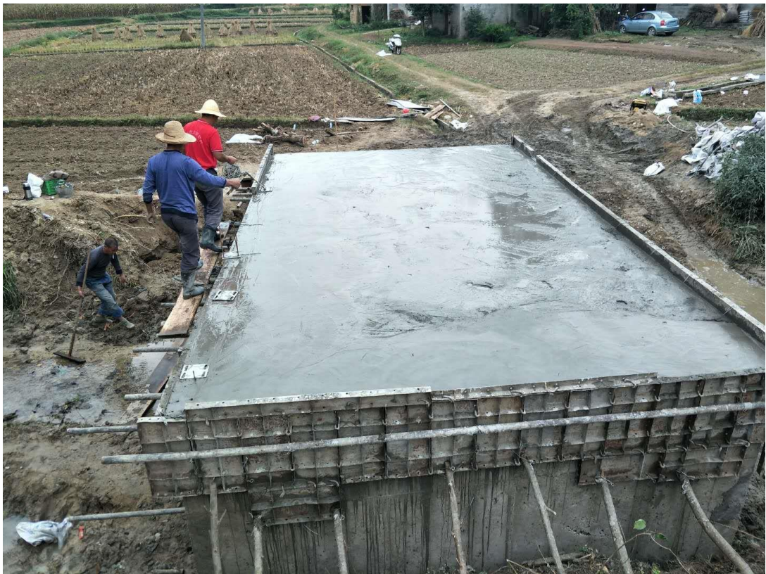
洋县程河村桥进展照片