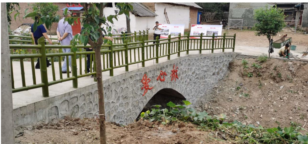
洛宁县便民桥进展照片