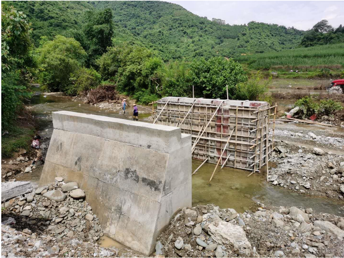
田林县便民桥进展照片