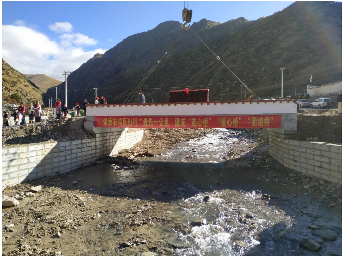
墨竹工卡县便民桥进展照片