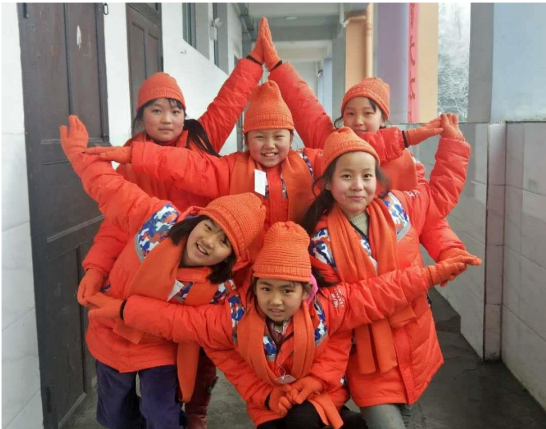
学生们穿上了“温暖包”中的御寒衣物