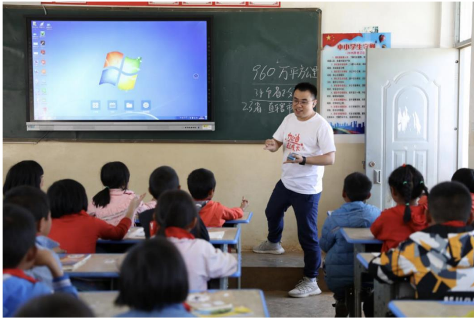
月捐人为学生准备的课堂