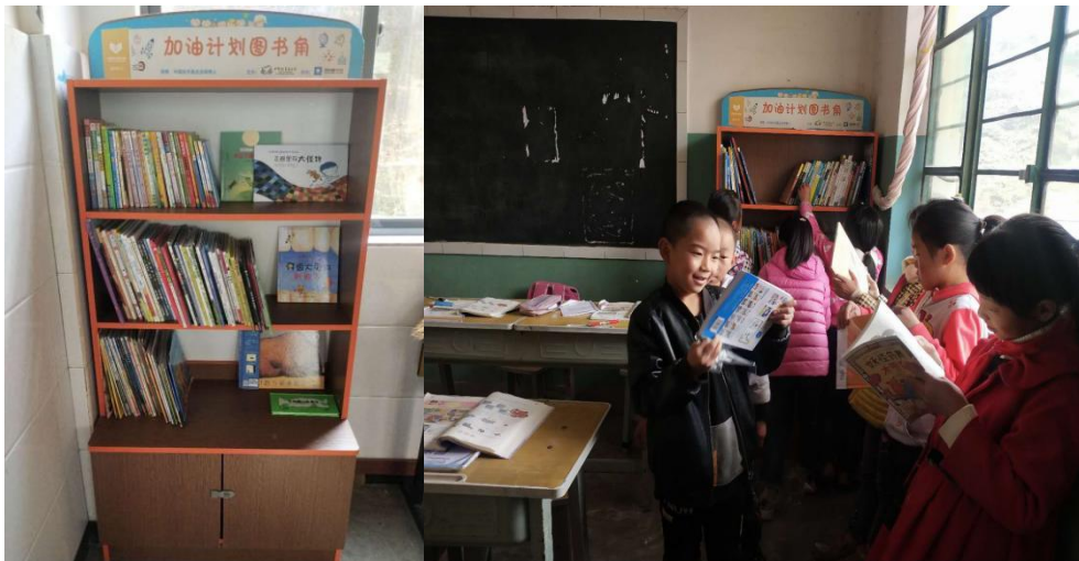
图1| 图书角图书整齐摆放 图2| 孩子们课间借阅图书

2020年9月，为32所项目学校图书角每班均各增补图书70册。目前，所有增补的图书已全部摆上各班的图书角，供学生课间、课后及阅读课时借阅。