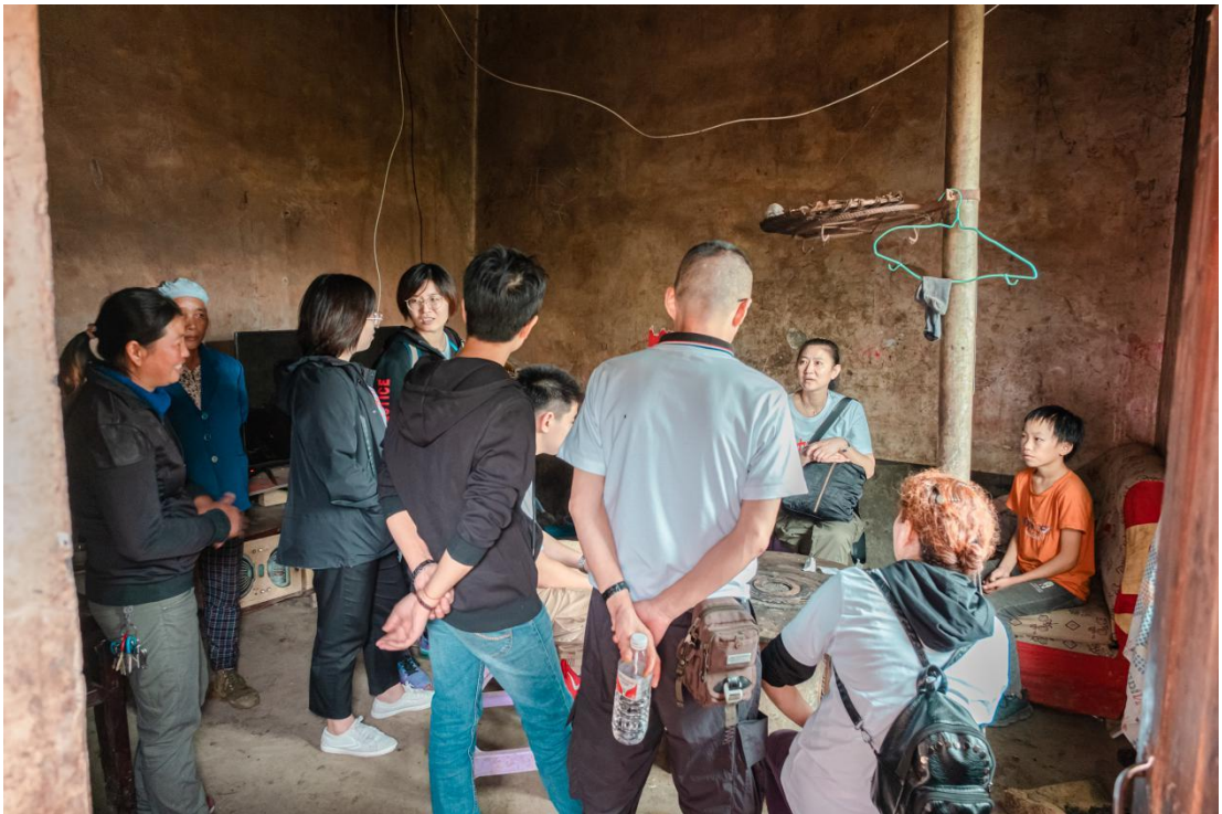
捐赠人探访“一对一”捐赠的孩子的家