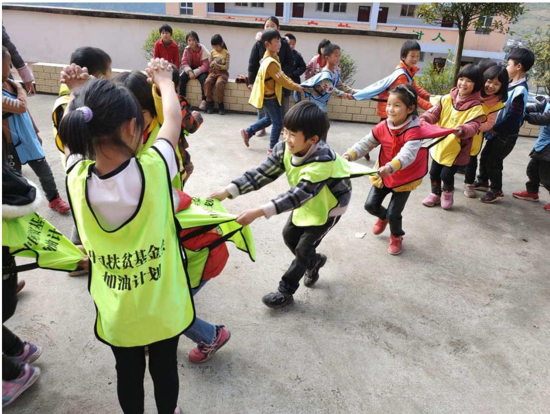
学生们加油课的“凌波舞”游戏

孩子们的幸福来自于美丽梦幻的“未来空间”。它是 2018 年由中国扶贫基金会汇聚爱心人士们的力量打造的，里面安装了木质地板，屋顶是耀眼的 LED 射灯，墙壁上悬挂有超大液晶电视，柜子里有笔记本电脑。整个未来空间五颜六色、丰富多彩、如梦如幻，使人向往未来。这里是我们的加油教练给孩子们上加油课的地方。“加油课”是中国扶贫基金会根据乡村学校设定的一大特色课程，对培养学生的合作精神、耐挫力、建设性交流能力和创造力，以及对孩子进行心理健康教育、丰富学生校园文化生活等都起到了举足轻重的作用。