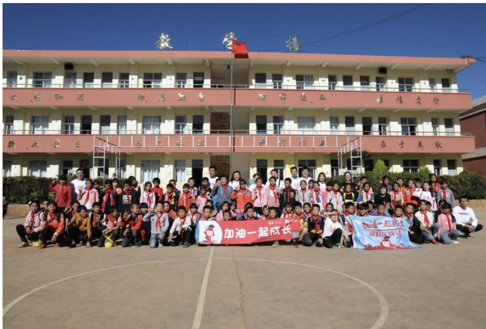
月捐人探访和孩子们的合影留念