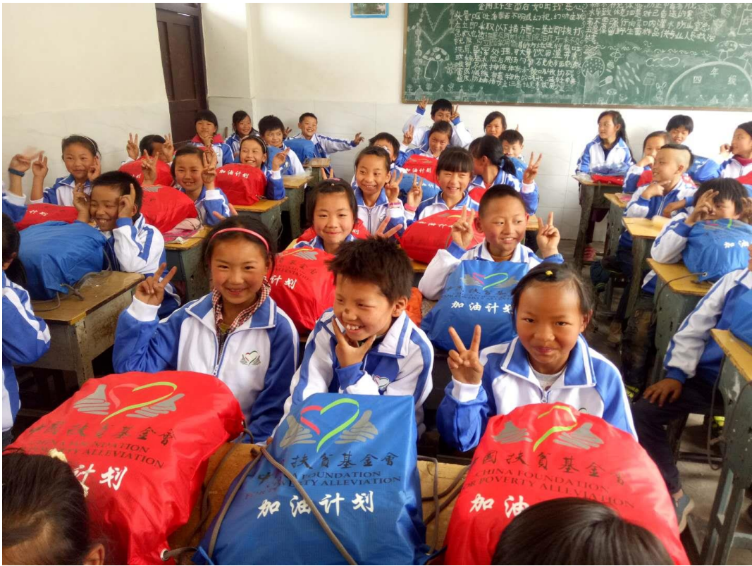
学生们收到“运动包”开心溢于言表