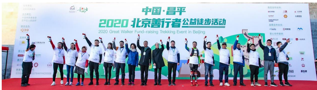
（2020 北京善行者第一批出发仪式现场）

10 月 17 日，来自国内外的 2671 名善行者队员从居庸关长城出发，开启 38.3 公里征程。第一支 6128 肯跑善行队冲破终点线，用时 4 小时 02 分 58 秒，荣获冠军。