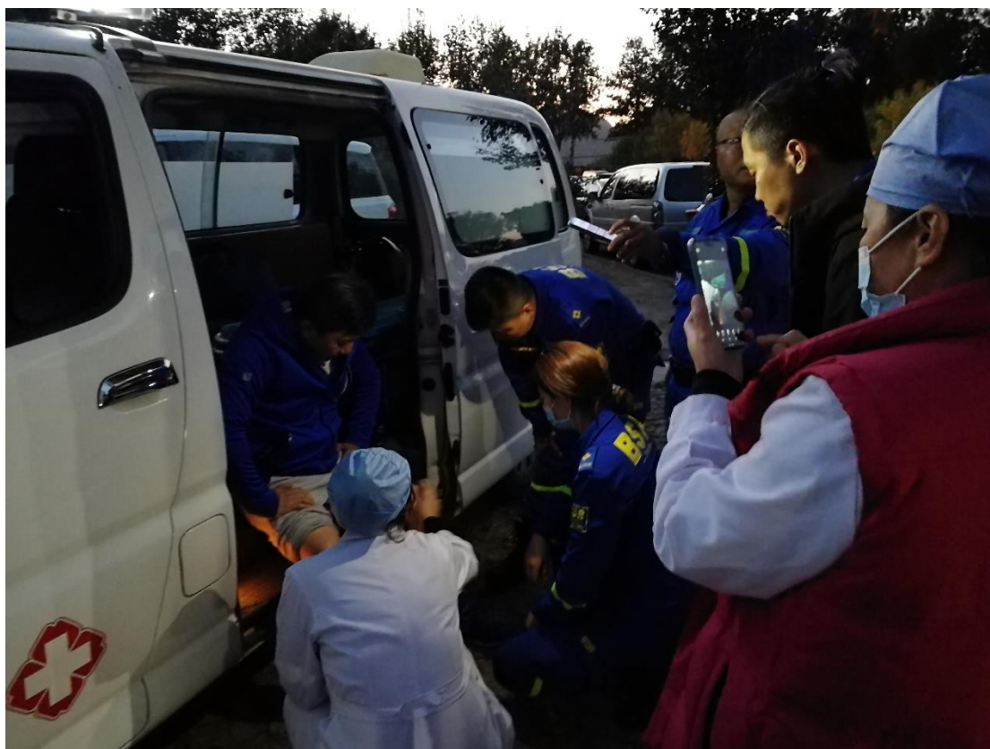
(医疗队为队员进行治疗)