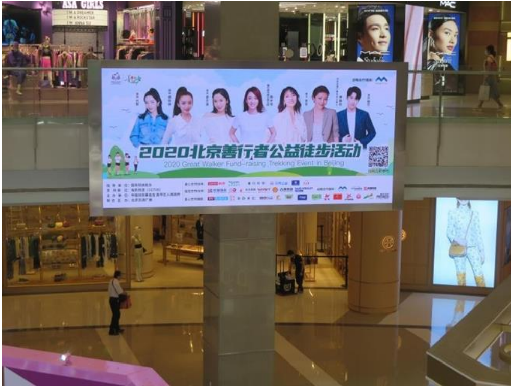
2.3 电梯楼宇广告：在全国近 2000 块电梯屏幕上刊