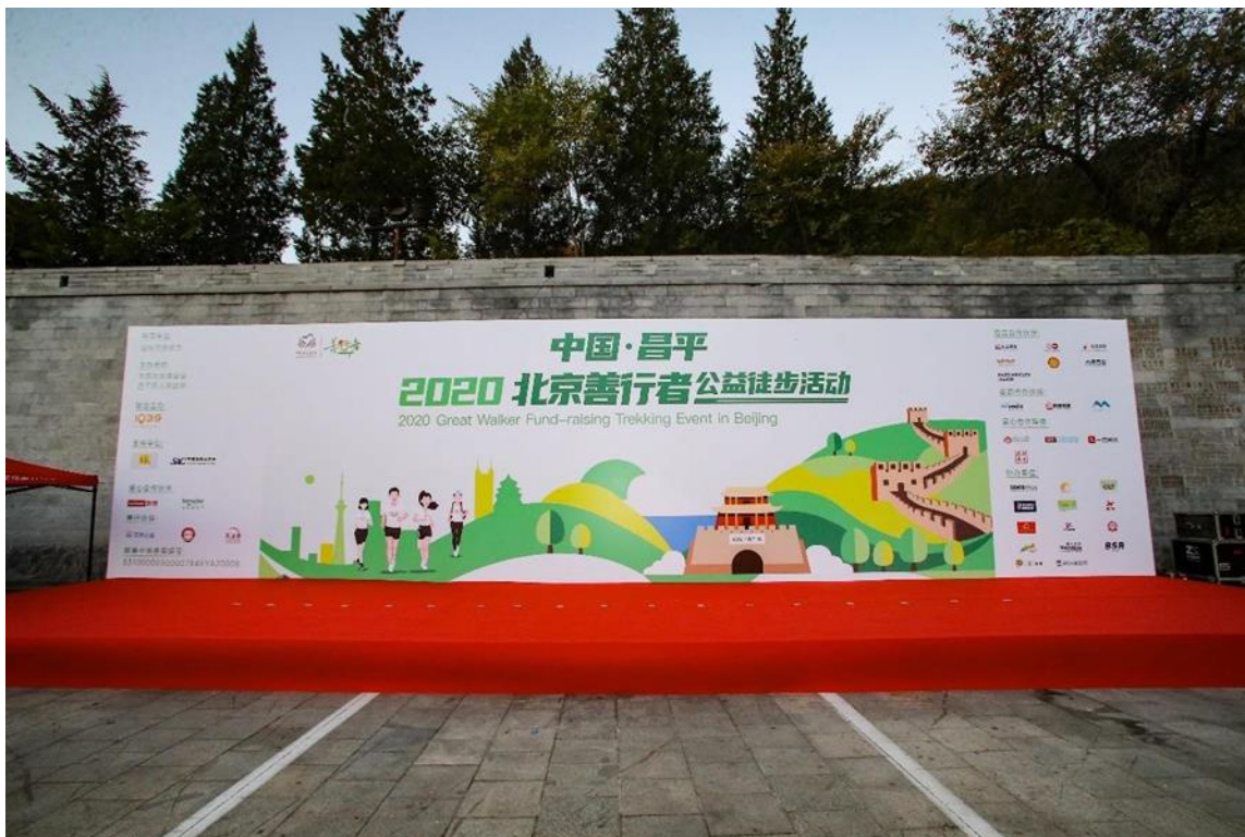
5.2 活动日企业露出展板