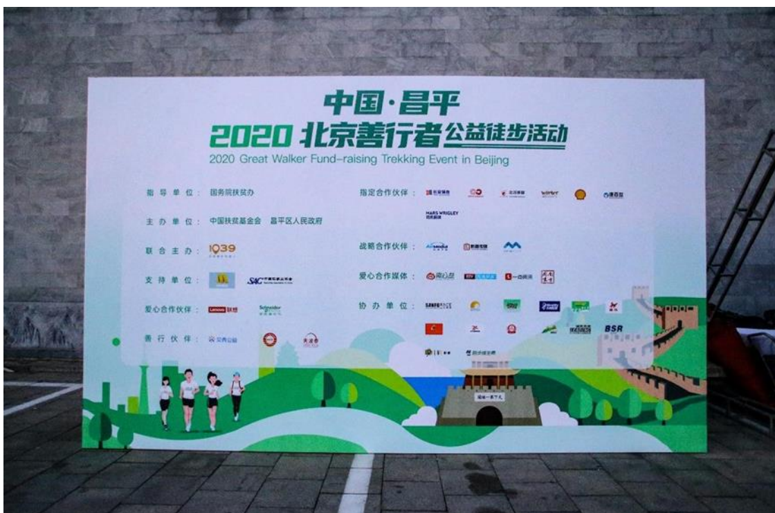
5.3 活动日 X 展架