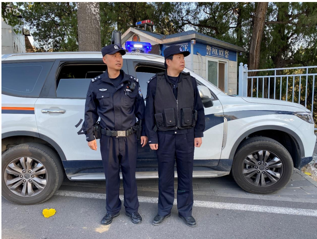
(公安现场执勤保障活动安全)