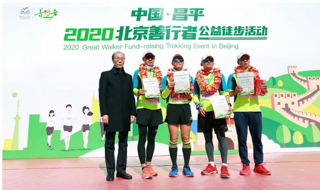
(为到达终点的团队颁发证书)

此次活动全程设置 7 个站点，公安、交警、卫计、城管等 23 个政府属地镇街及企事业单位，704 名工作人员的日夜值守，保障各站点及路段的安全与畅通，蓝天救援队、跑团志愿者及组委会等 690 余名志愿者和工作人员不言辛苦，全力以赴打造这场公益嘉年华盛会。