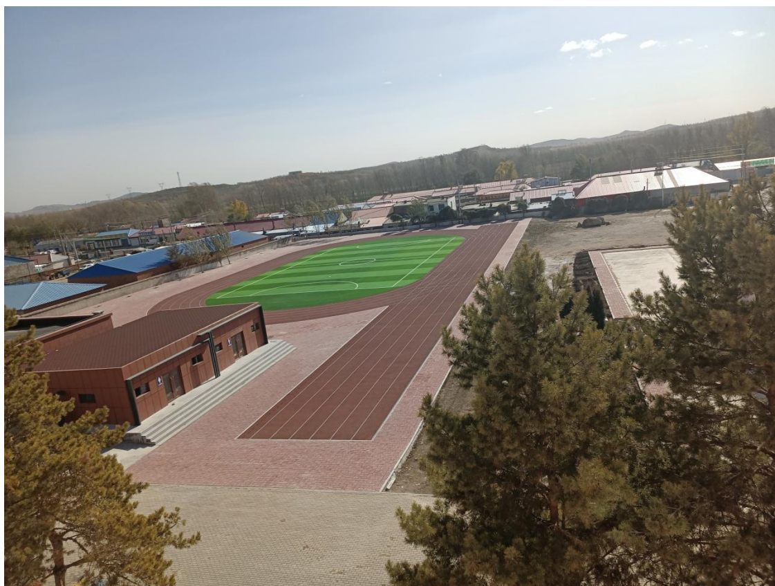
科右前旗大坝沟小学