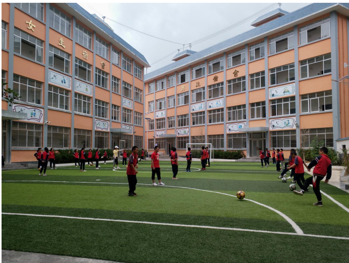
麻栗坡县铁厂小学