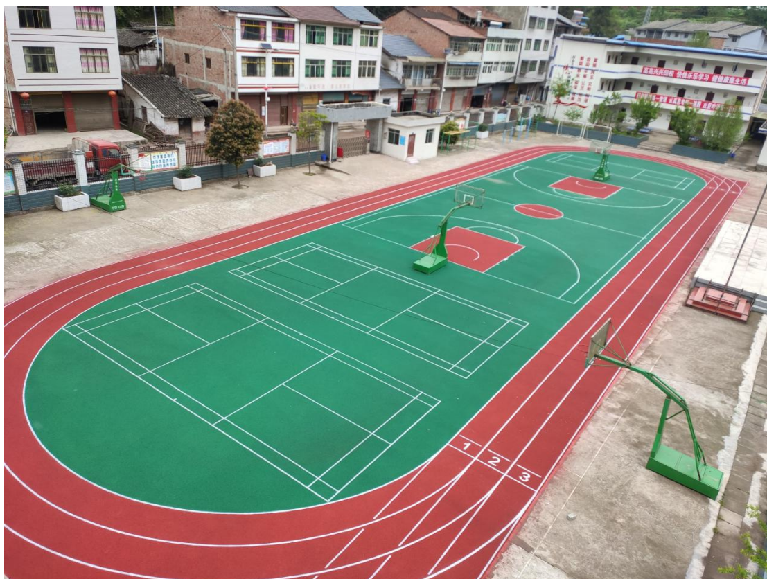
万源市新店乡中心小学