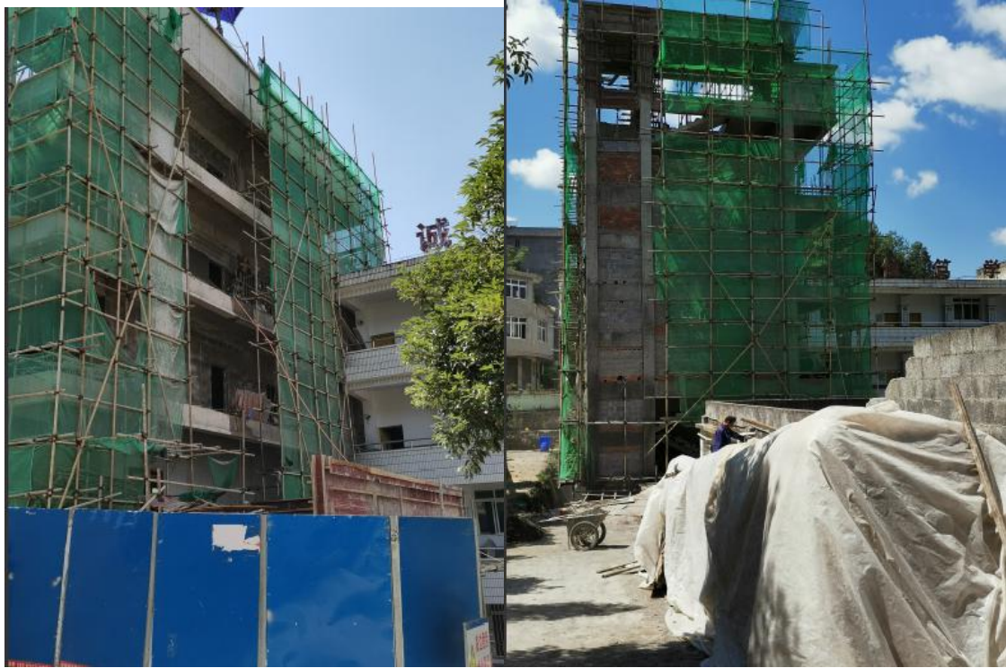
彭水县鞍子镇小学主体封顶

银保监会教育助学项目在和政县及临洮县两县开展，对学生及教师进行资金援助，已于 12 月对两县提交资料审核完毕，共计 3792407.82 元，临洮县已全部拨付完毕，和政县因财务扎账问题有 126817 元待 1 月财务开账后支出。受益人数达 699 人，其中教师 45 人，学生 654 人。