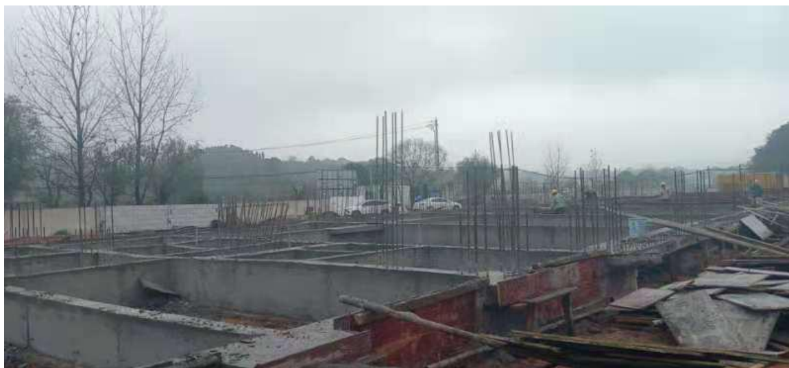
横峰县港边乡小学地基完成

2020年中石油进一步加大力度推进定点帮扶与对口支援工作，拟援助江西省横峰县港边乡小学进行教学楼及综合楼建设。项目资金1150万（其中中石油项目资金900万，250基金会自筹），首款1000万已于6月18日拨付至地方教育局进行监管，再由地方教育局按项目进展情况分批拨付至施工单位。在当地政府及教育局大力支持与推进下，港边石油中心小学项目进展顺利，于2020年5月开展，7月已完成相关招投标前期手续，9月完成招投标，截至12月底已完成一层主体建设。建成投入使用后预计受益学生达1000人。