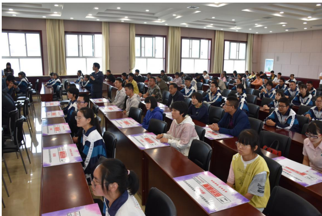
银保监会扶贫项目资助仪式现场