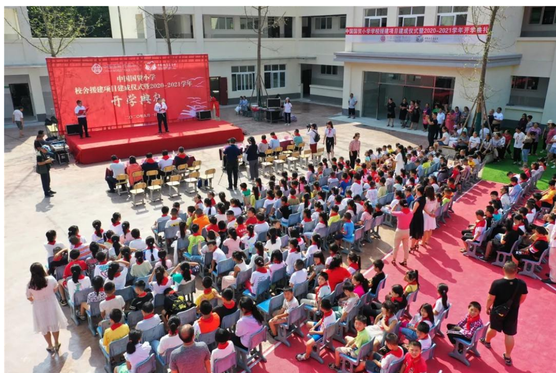
国贸小学援建项目建成仪式活动现场