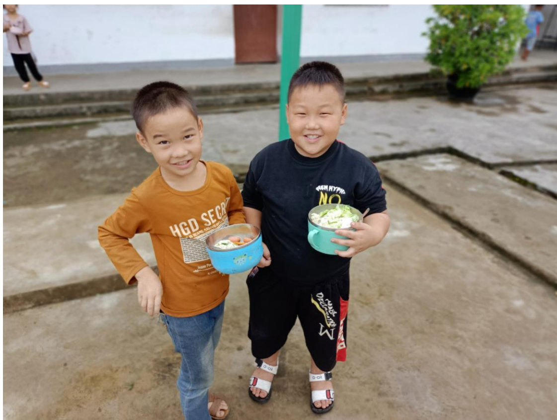
米香计划受益学生