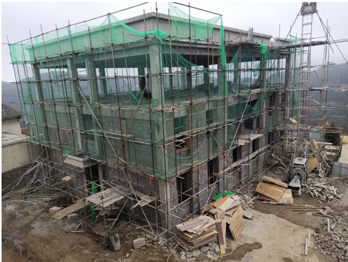
纸厂小学主体竣工