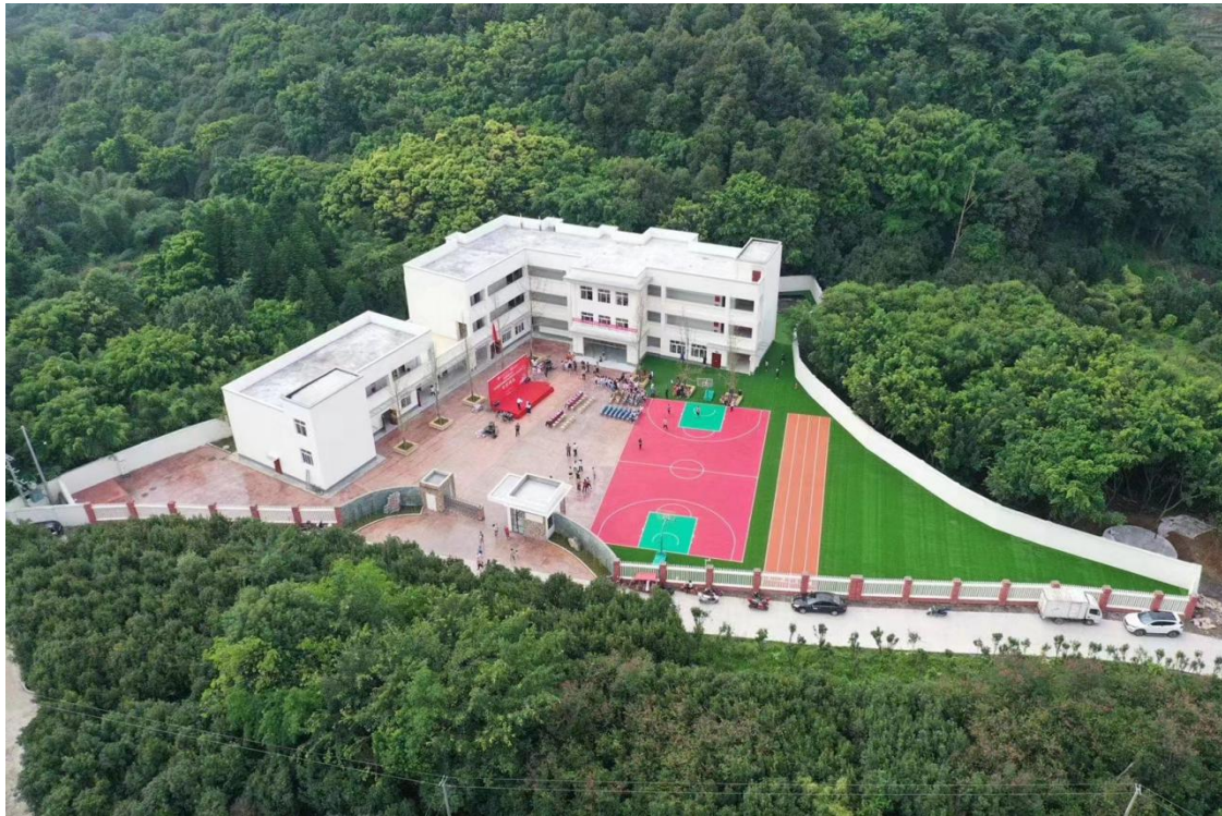
国贸小学项目竣工

2020 年，完成长宁县中国国贸小学的工程建设，覆盖 1 省 1 县，直接受益人数达 300 人次。