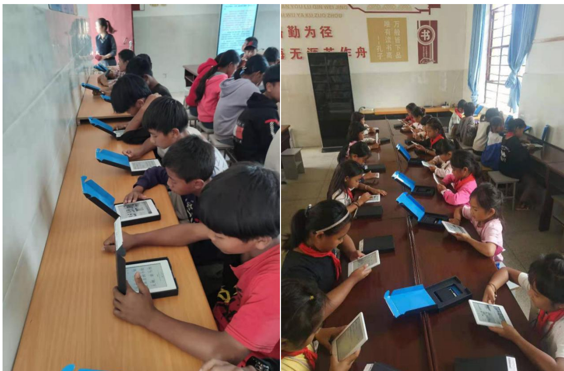
书路计划受益学生观看电子书

2020 年，完成西盟县 2 所小学校的图书室建设，覆盖 1 省 1 县，受益人数约 1000 人。采购 Kindle700 台，可覆盖项目校 14 所。