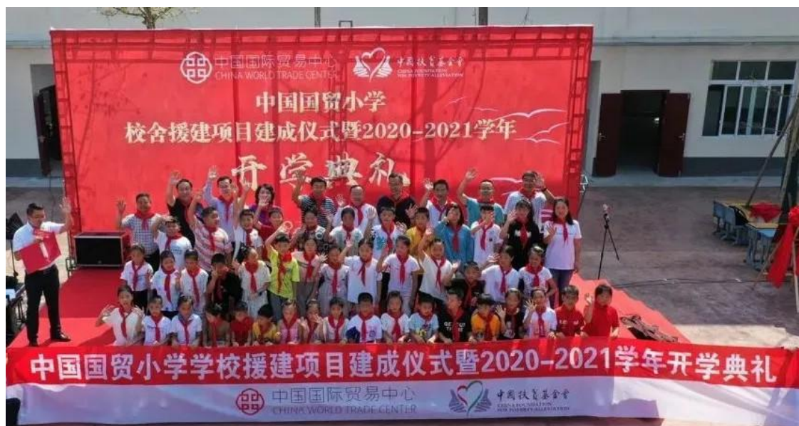
国贸小学援建项目建成仪式活动现场