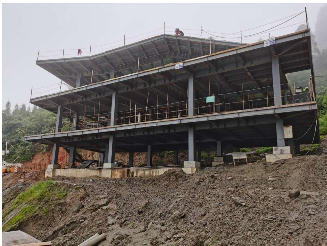
红河县学校建设项目主体竣工

红河县学校援助项目：红河县人民政府根据自身的扶贫工作整体规划，拟实施“哈尼梯田全球重要农业文化遗产综合扶贫项目——梯田学校援建”，以此落实精准扶贫战略，创新精准扶贫模式，通过开展农旅综合扶贫，帮助受益村庄脱贫致富。项目参建各方紧密协作加快项目推进，项目7月以来取得较大进展。并于9月28日完成主体结构封顶，截至12月中，墙体建设基本完成建设。