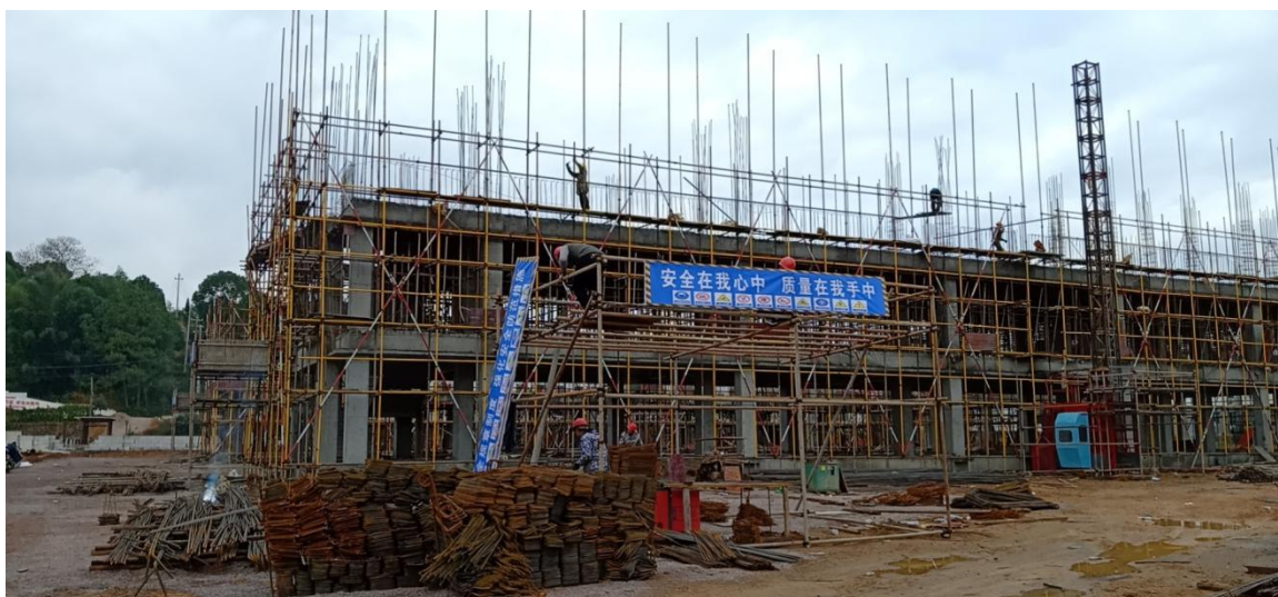
横峰县港边乡小学一层主体建设