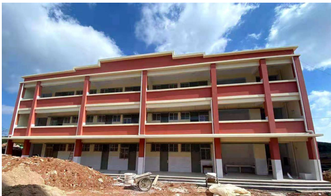
奋斗小学已基本竣工，待验收

2020年中石油进一步加大力度推进定点帮扶与对口支援工作，拟援助江西省横峰县港边乡小学进行教学楼及综合楼建设。项目资金1150万（其中中石油项目资金900万，250基金会自筹），首款1000万已于6月18日拨付至地方教育局进行监管，再由地方教育局按项目进展情况分批拨付至施工单位。在当地政府及教育局大力支持与推进下，港边石油中心小学项目进展顺利，于2020年5月开展，7月已完成相关招投标前期手续，9月完成招投标，截至12月底已完成一层主体建设。建成投入使用后预计受益学生达1000人。