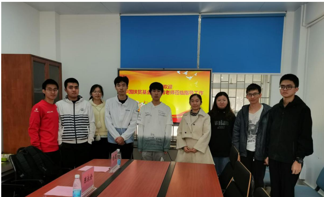
图 2：华南理工大学回访学生合影