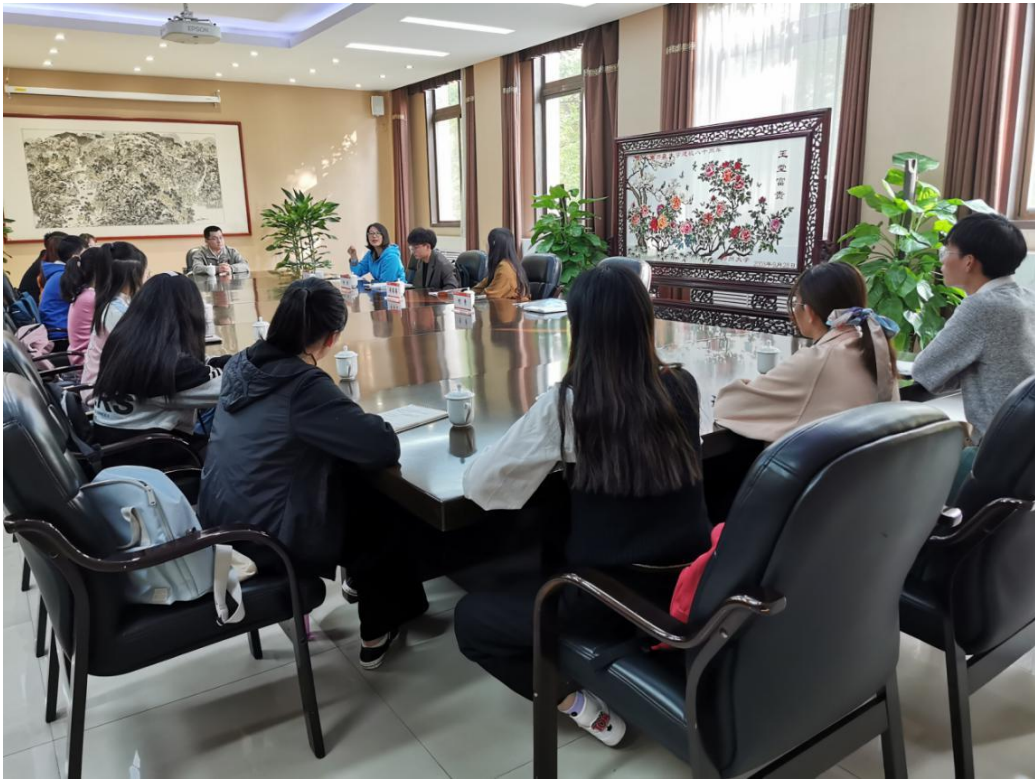
图 1：河南师范大学师生参加座谈会