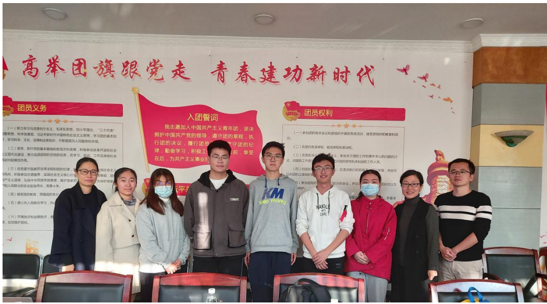
图3： 中山大学回访学生及项目负责人合影