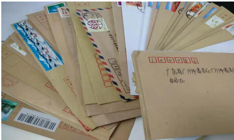
(图 1: 学生感谢信)