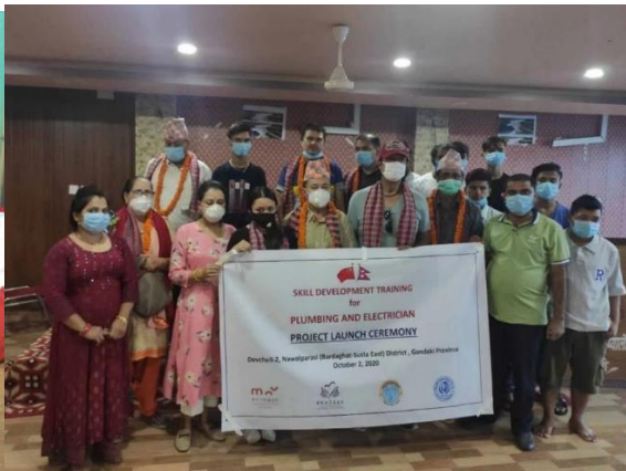
尼泊尔青年职业培训第二期启动仪式