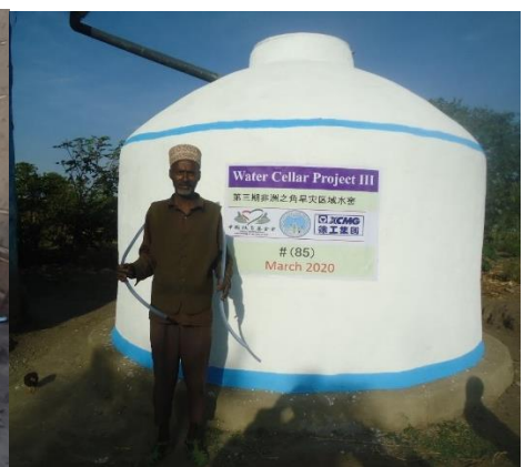
埃塞家庭水窖项目三期受益人