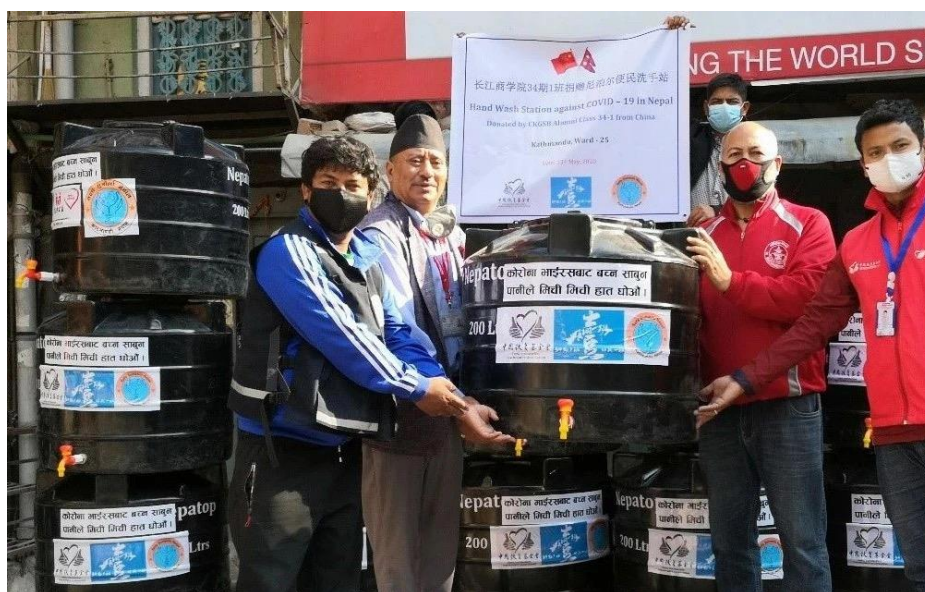
尼泊尔社区卫生防疫洗手站加德满都交接仪式