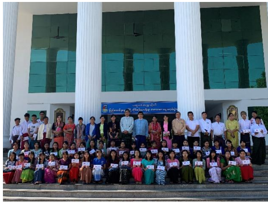
马乌宾大学助学金发放仪式