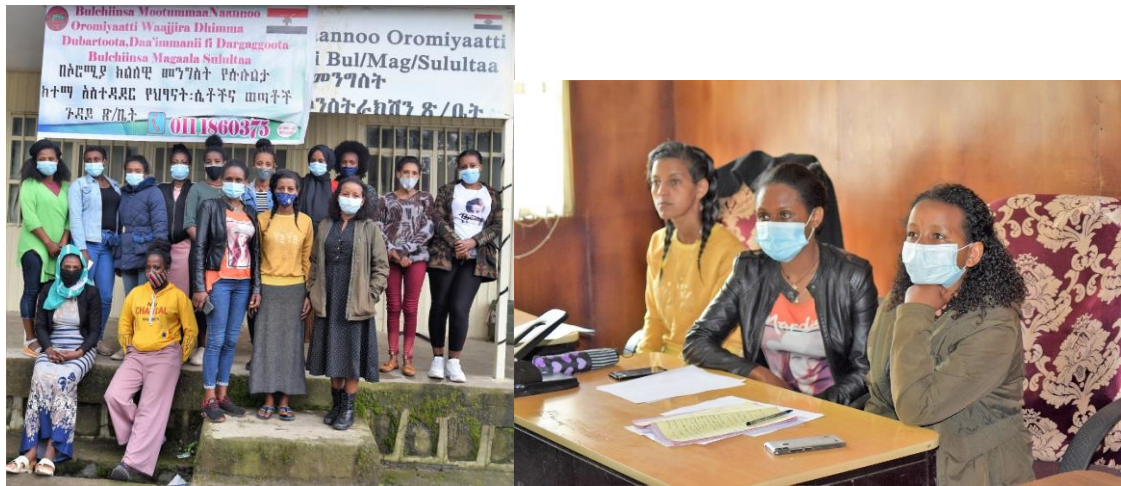
埃塞妇女职业经济发展项目受益人参加培训