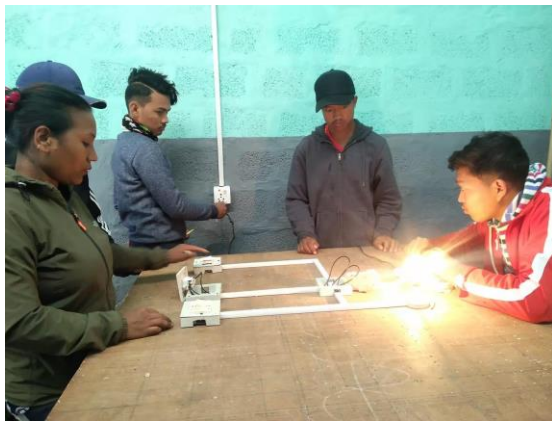
尼泊尔青年职业培训第一期受益青年

完成了对埃塞妇女职业经济发展项目 15 名受益人的筛选，并举办了性别和生活技能的培训。