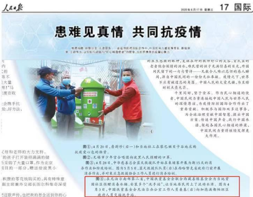
中尼媒体对我会在尼泊尔建立社区卫生抗疫洗手站的报道