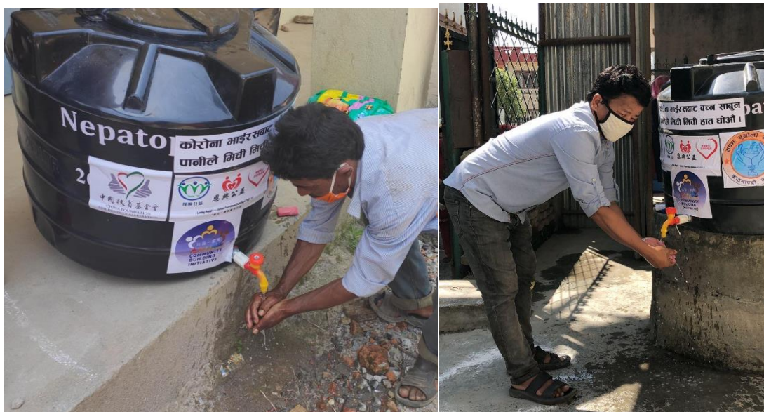
尼泊尔第二省那格郡村民众在洗手站洗手

2020 年全球新冠疫情爆发后，我会在尼泊尔的贫困与弱势社区、疫情防控检查站、公共卫生站等地建立了卫生抗疫洗手站，并进行防范病毒传播、居家隔离、自我防护等健康卫生及防疫知识宣讲，增强尼泊尔贫困与弱势社区的防疫意识与能力，降低新冠病毒感染风险。