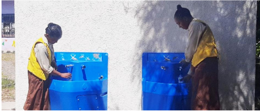
埃塞受益学生在使用学校净水设备