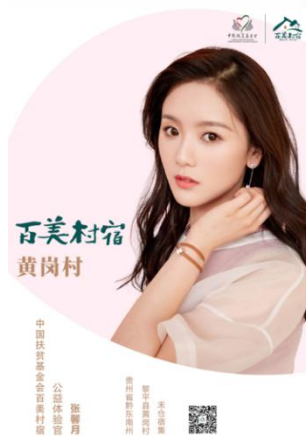
明星公益体验官：张馨月