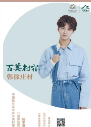
明星公益体验官：陆思恒