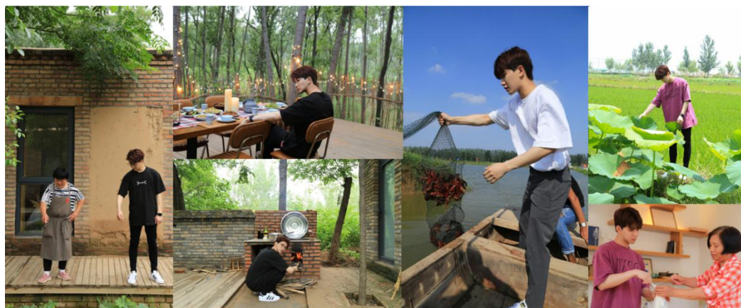
明星公益体验官陆思恒 x 百美村宿姜庄村、韩徐庄村