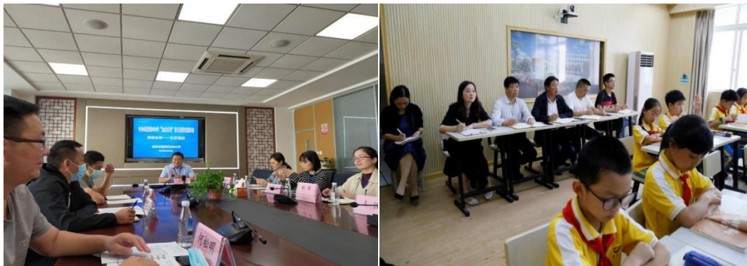
图为校长参加研修

2. 2020年9月至10月，分批安排加油计划项目学校校长及所在乡镇中心校校长65人外出8省13市17所学校进行为期5天的跟岗研修学习。