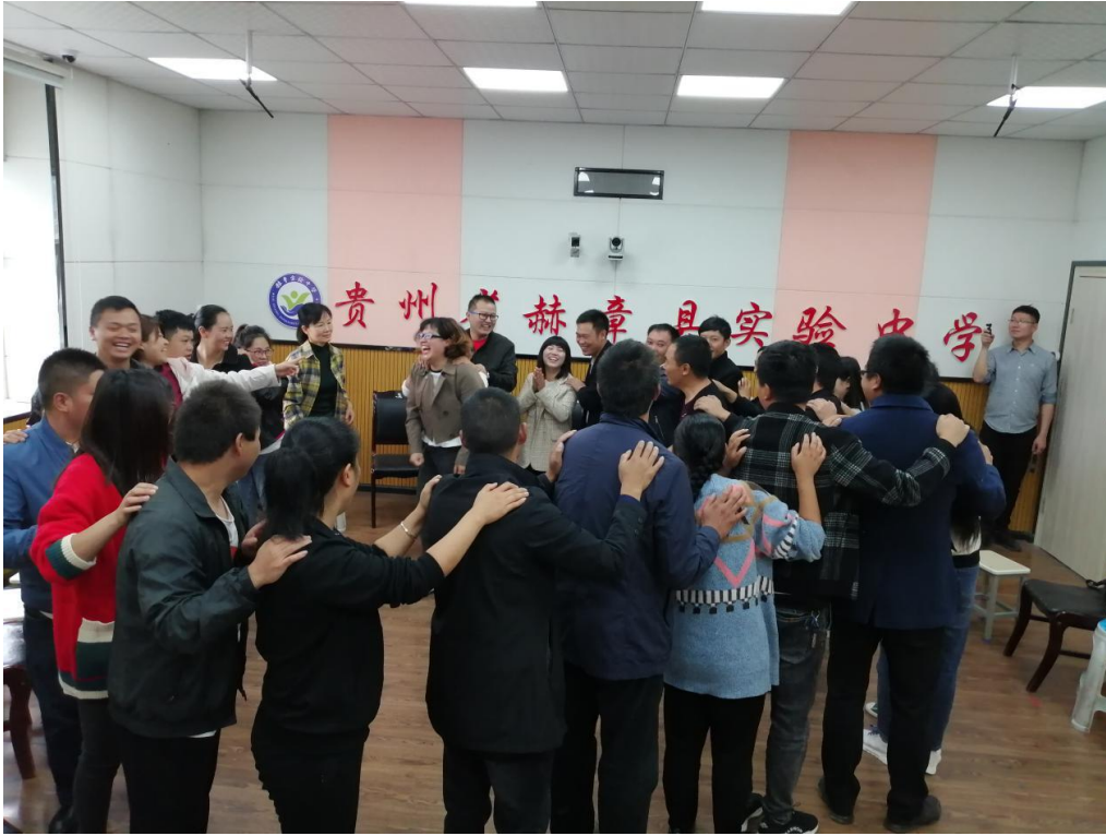
2. 2020年12月，在30所项目学校落地加油空间。