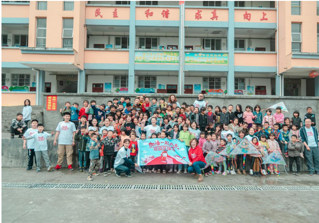
月捐人探访官庄小学和孩子们的合影留念