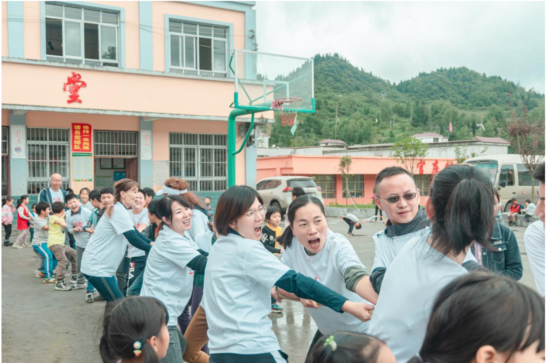
捐赠人和孩子们共同参加拔河比赛