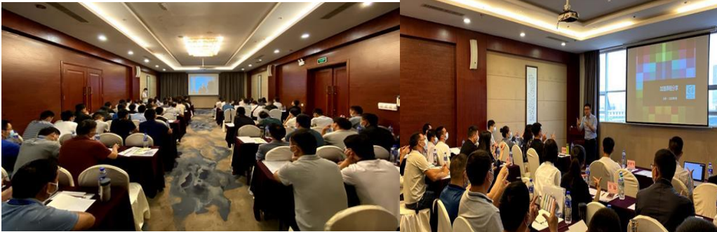
图为校长参加培训

1. 2020年8月，加油计划项目学校校长及所在乡镇中心校校长65人在昆明参加校长集中培训。