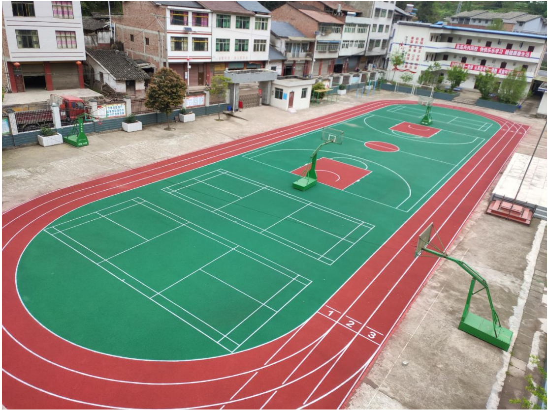
万源市新店乡中心小学