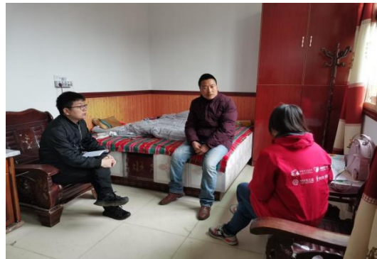
项目执行团队探访旬邑县受益人