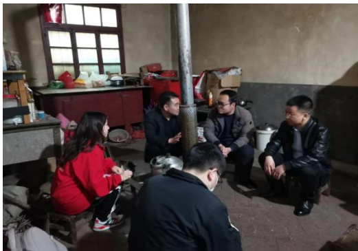
项目执行团队与受益人交谈

2021年3月16日-19日，顶梁柱公益保险项目工作人员与农民日报、中国网记者共同前往陕西省商洛市商州区、咸阳市旬邑县探访。