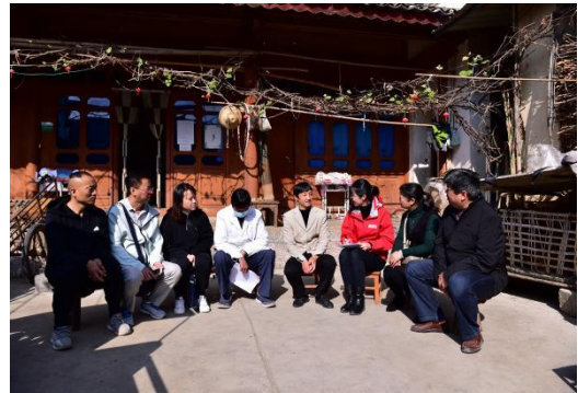
项目执行团队探访施甸县受益人